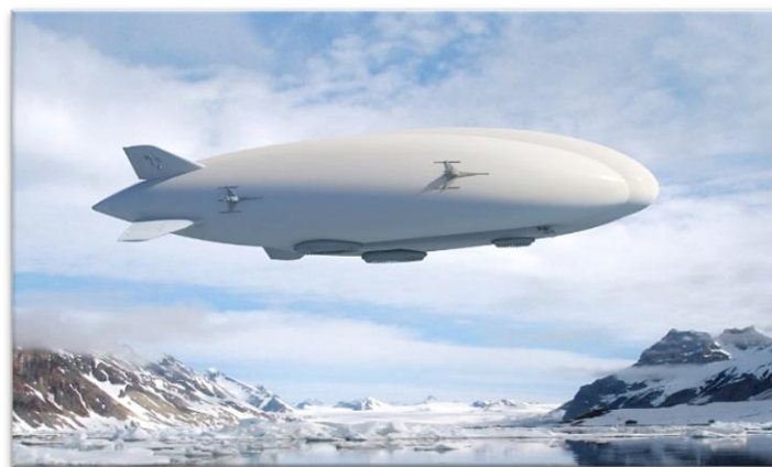
Transport de 100 000 tonnes par an de concentrés de Strange Lake par dirigeables hybrides développés par Lockheed Martin