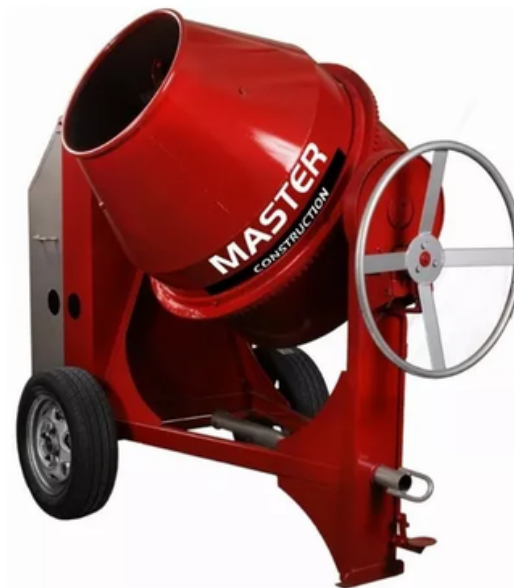
MEZCLADORA MASTER 1.5 BULTOS (325LITROS/11FT3) MOTOR DIESEL MASTER 10HP