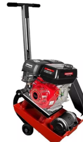
VIBROCOMPACTADORA (RANA) MASTER (ZANJERA) 50X30CM MOTOR GASOLINA HONDA 6,5HP GP200H