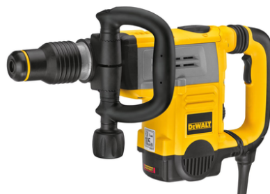
SDS Demolator Dewalt D25831K-QS, 615 W, SDS-Max, 8 J, 2840 PPM