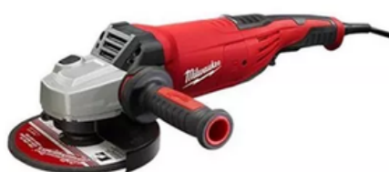
Pulidora Industrial De 7" , 15amp Y 8500rpm 6086-30 Milwaukee