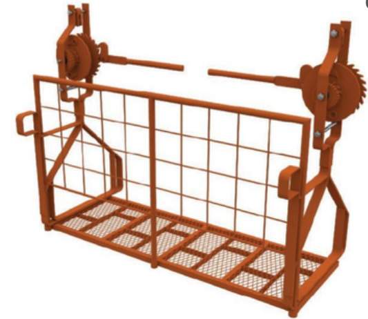
ANDAMIOS COLGANTE + PESCANTE + PLATAFORMA + BARANDAS