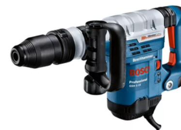
Rotomartillo Demoedor BOSCH GBH8-45D 1500W 12,5J