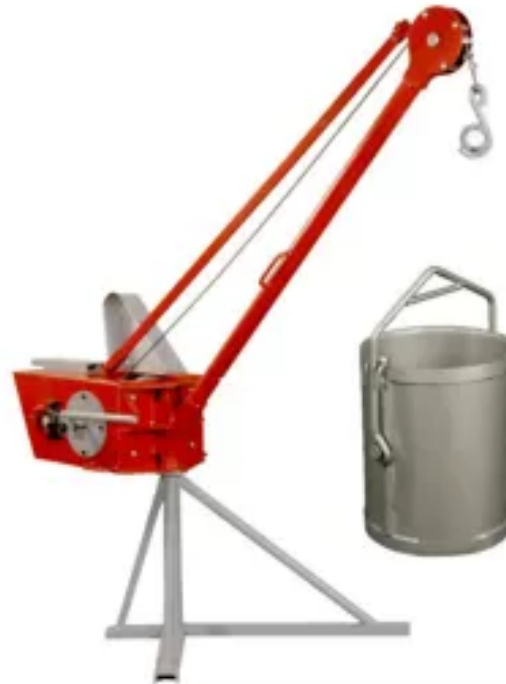
PLUMA GRUA MASTER 300 Kg MOTOR ELECTRICO, BALDE + CANASTA