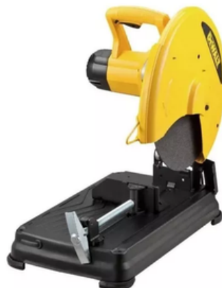
Tronzadora 14" 2300w 3800 Rpm Dewalt D28730-b3