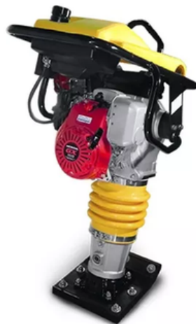
Apisonador (canguro) Motor HONDA GX120R Gasolina