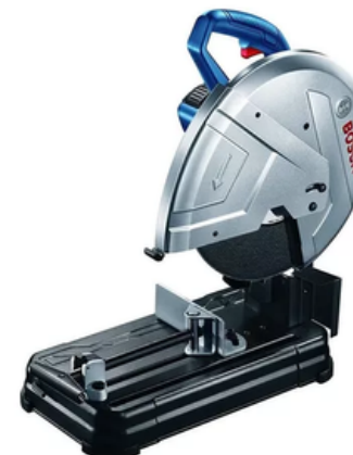
Tronzadora 14 Pulgadas 2.400w Gco 14-24 Bosch