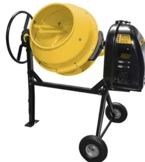
Mezcladora Hormigoner Mx15 150litros Equipmaster