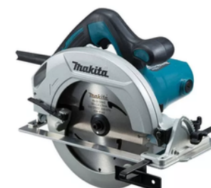
Sierra Circular Makita M5802B 1200W 4900RPM DISCO 7-1/4"