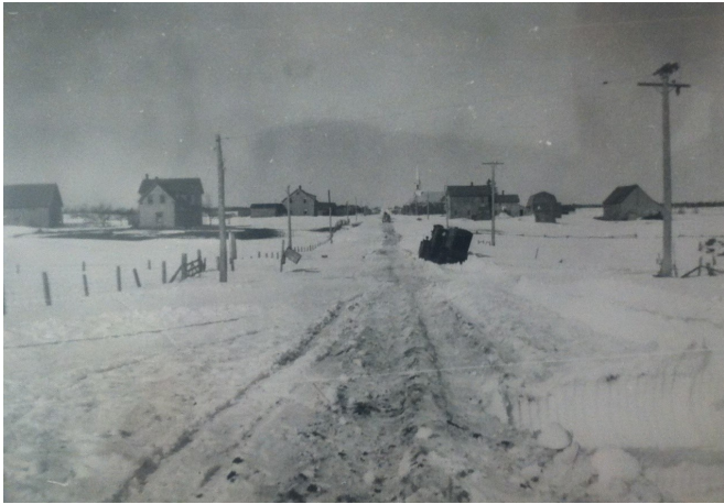
Cette photo d'une souffleuse à neige dans le fossé, par Dr. Michelle Delagarde, est de l'époque où l'on a commencé à ouvrir les routes l'hiver dans la paroisse vers 1950. Gracieuseté de Mr Charles-Eugène Duclos