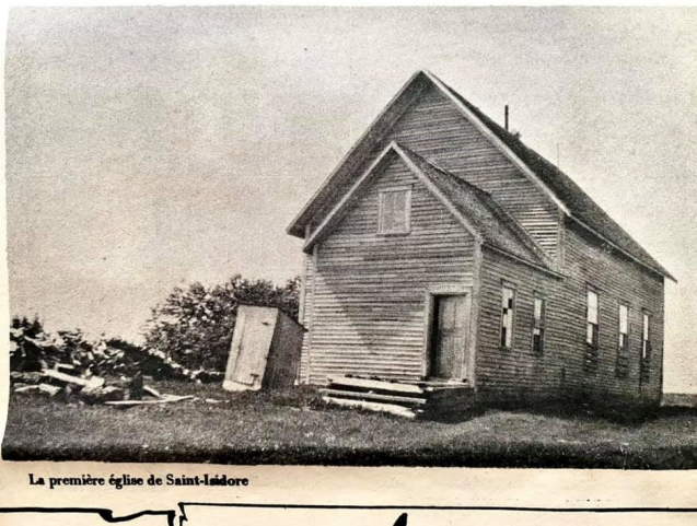
La première église de Saint-Isidore