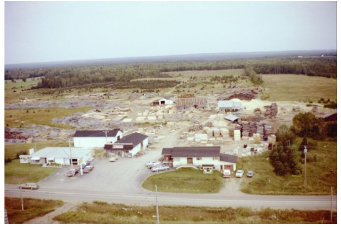
Le moulin Duclos en 1981