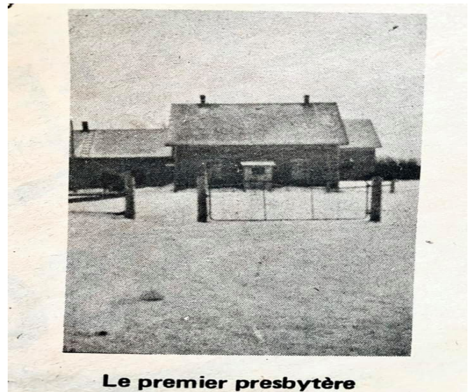
Le premier presbytère

Première église de St-Isidore et son presbytère ( Tirées d'un cahier spécial du 'Le Voilier' sur le centenaire de Saint-Isidore - 16 juillet, 1975 )