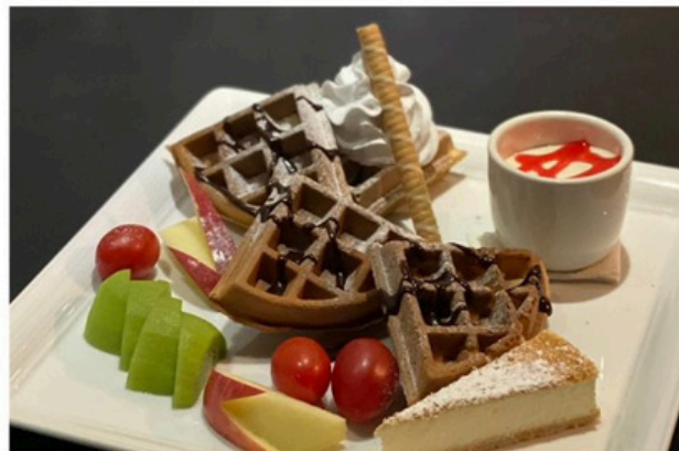
鬆餅套餐 Waffle $ 480

開放三明治 Open Sandwich 沙拉 Salad 薯條 Frise 任意飲品 Any Drinks