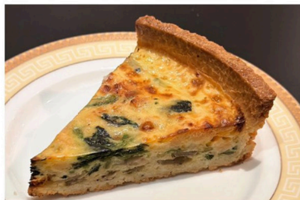
鹹派套餐 Quiche $ 480

鬆餅 Waffle (巧克力 Chocolate/ 蜂蜜 Honey/ 覆盆子 Raspberry/ 焦糖蘋果 Caramel Apple) 蛋糕 Cake 奶酪 Panna Cotta 任意飲品 Any Drinks