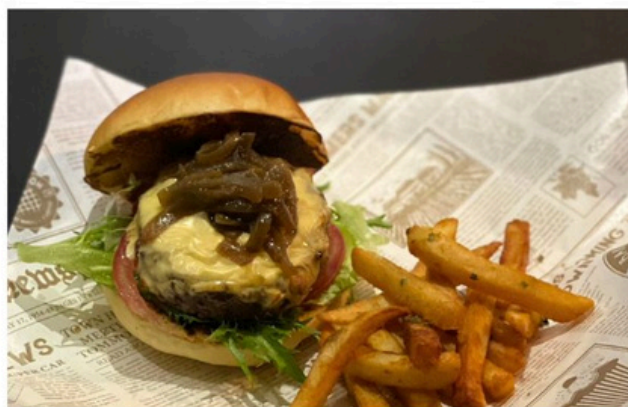
手打漢堡套餐 Beef Burger $ 520

鹹派 (菠菜鮭魚/燻雞蘑菇) Salmon/Chicken 沙拉 Salad 薯條 Frise 飲料任選 Any Drinks