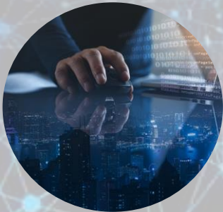
Internet de las Cosas (IOT)