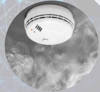
Control de Riesgos