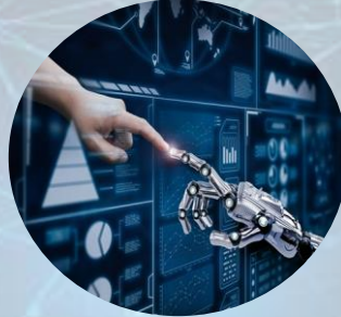
Manejo automatizado de espacios