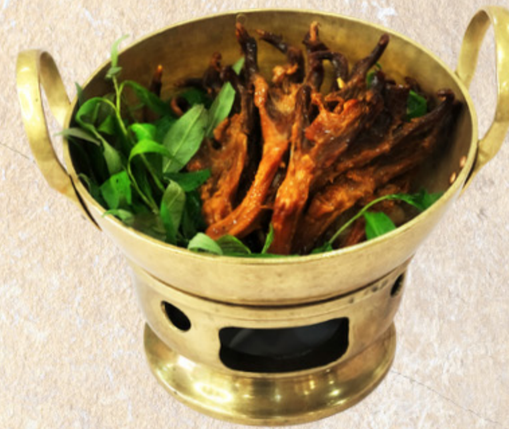
Lưỡi vịt phá lẩu Braised duck tongue