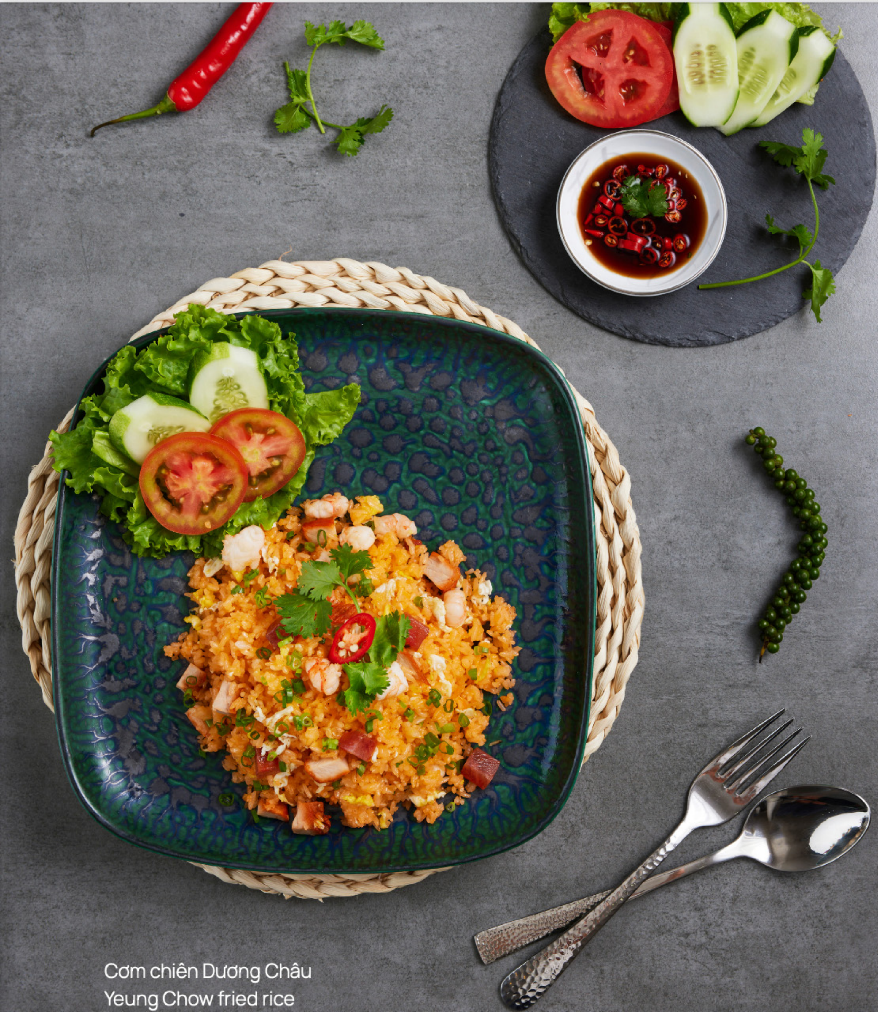
Cơm chiên Dương Châu Yeung Chow fried rice VND 130,000