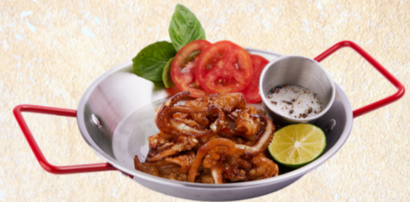
Mực chiên bơ tỏi Garlic butter squids