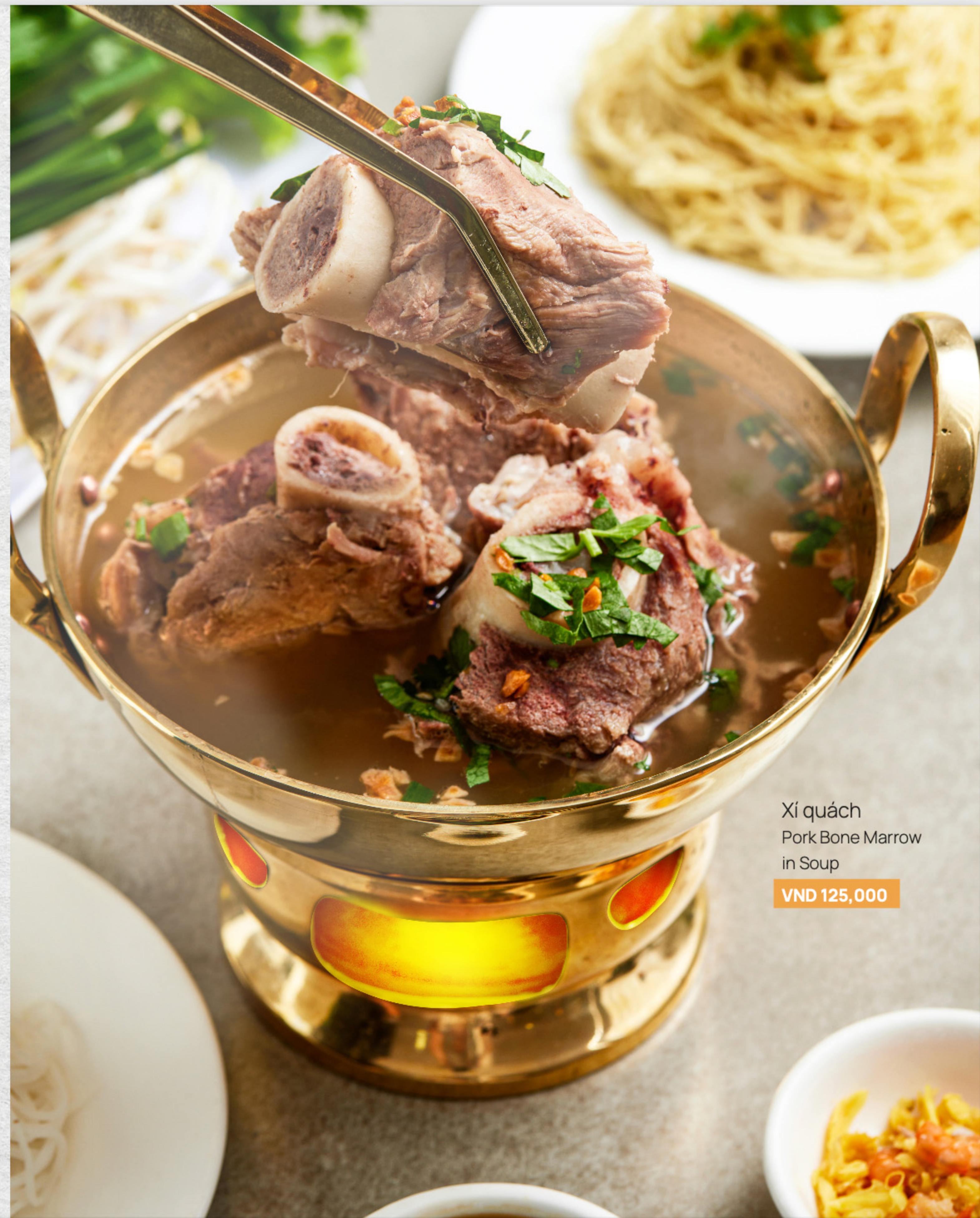
Xí quách Pork Bone Marrow in Soup VND 125,000