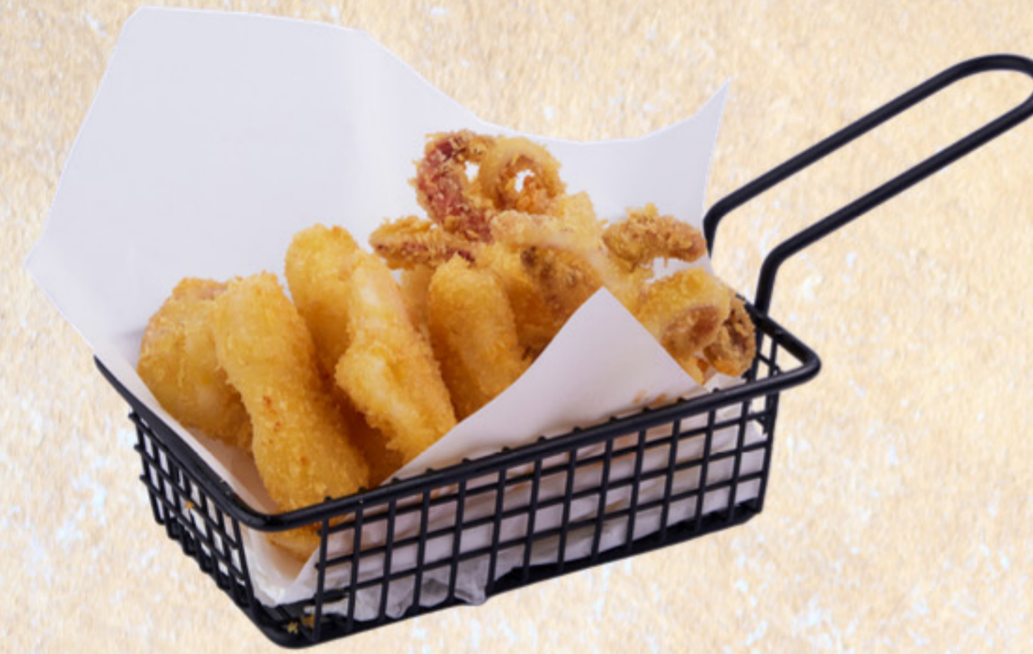
Mực chiên giòn Crispy fried squids