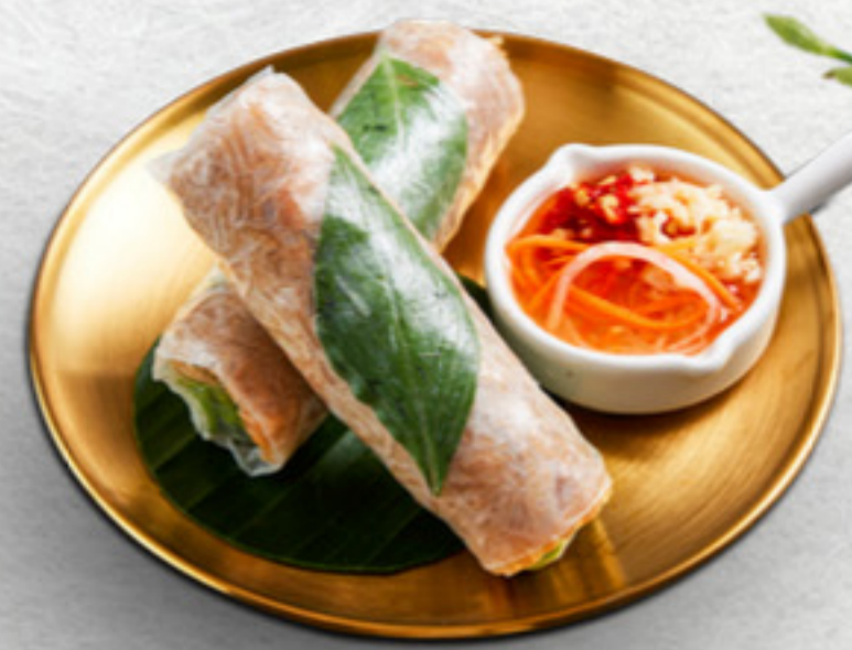
Bì cuốn (2 cuốn) Shredded pork salad rolls (2 pcs) VND 50,000