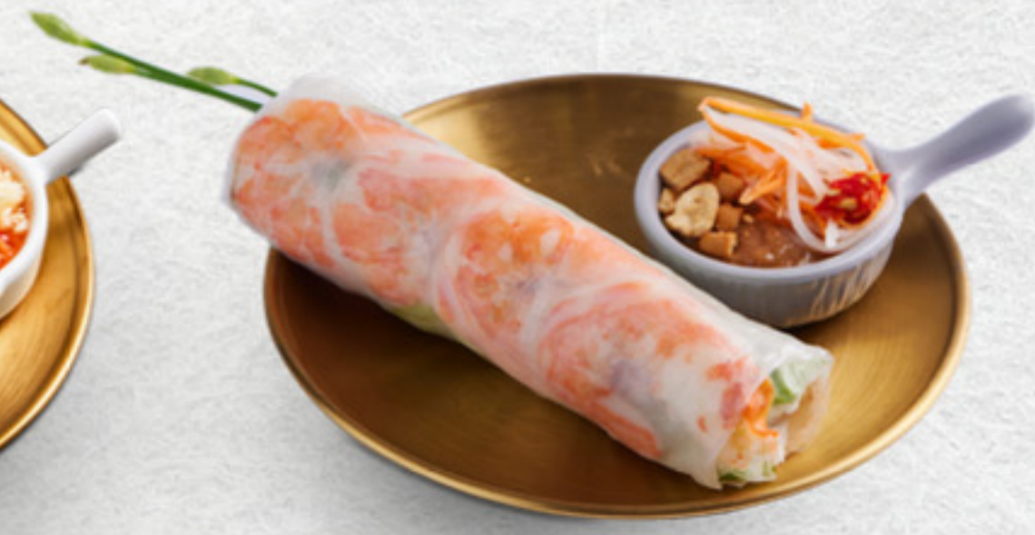
Gỏi cuốn Jumbo (1 cuốn) Tôm sú tươi + Bắp giò heo Jumbo size salad rolls VND 70,000