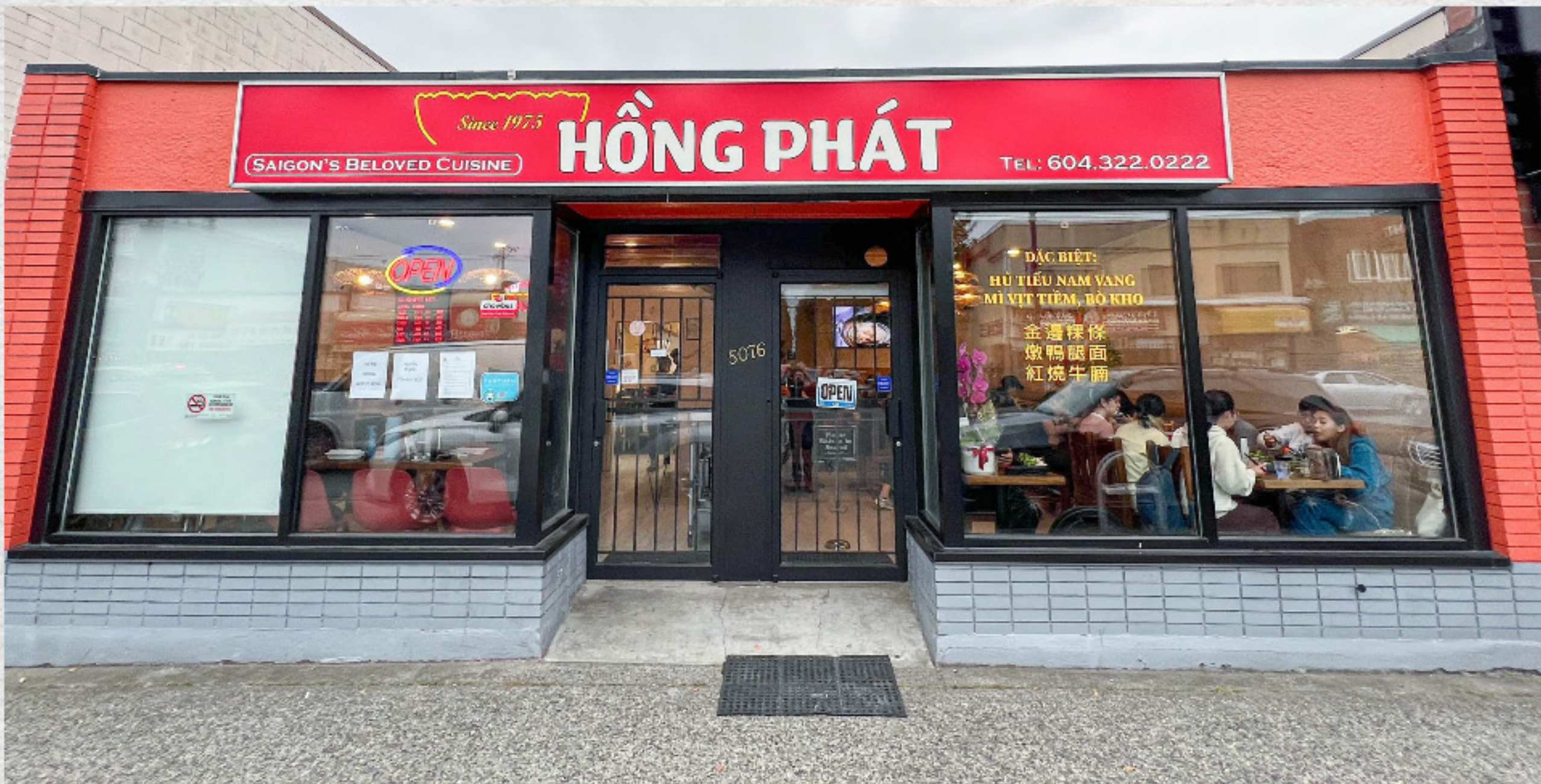
Chi Nhánh Vancouver, BC, Canada