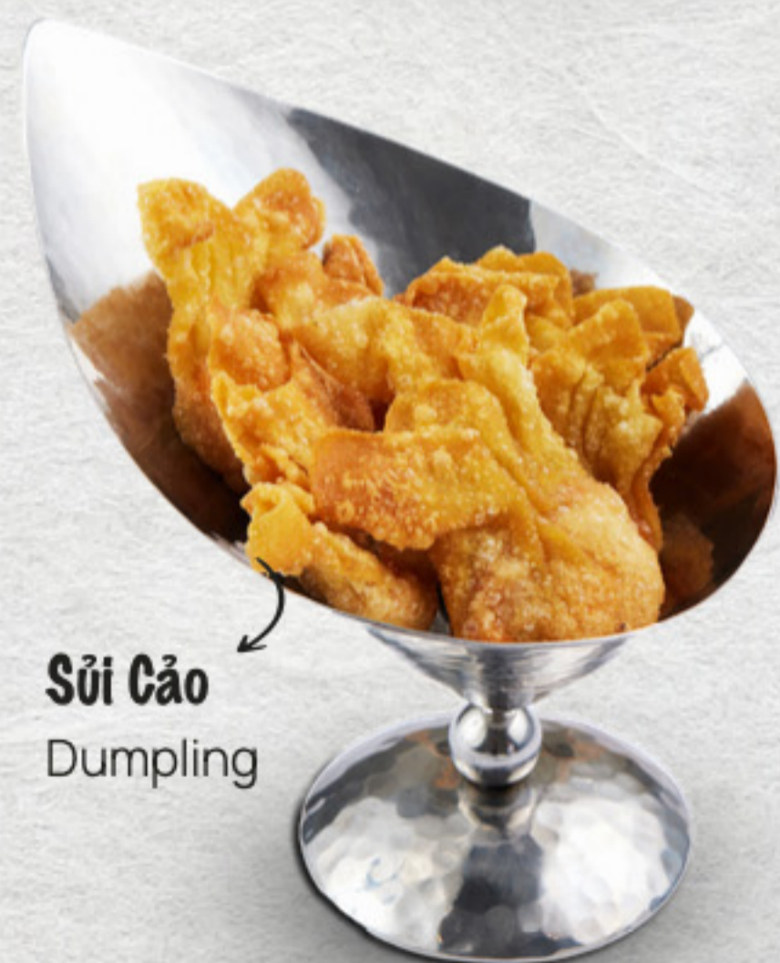
Sủi Cảo Dumpling