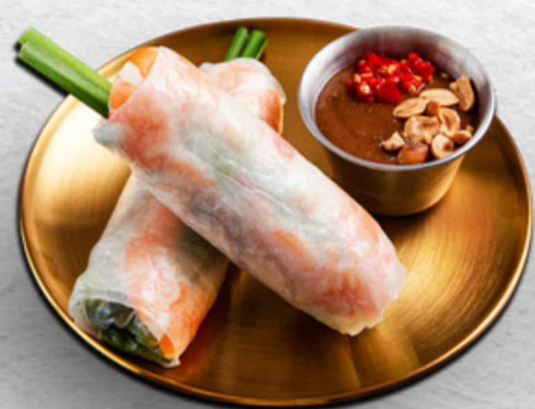
Gỏi cuốn (2 cuốn) Tôm sú tươi + Bắp giò heo Shrimp salad rolls (2pcs) VND 70,000