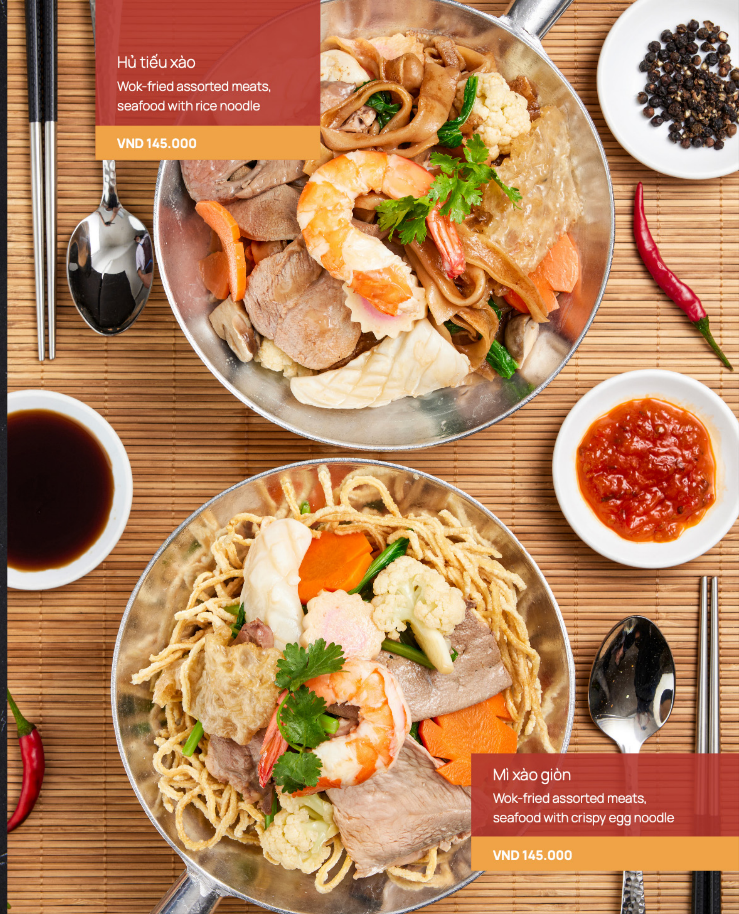
Hủ tiếu xào Wok-fried assorted meats, seafood with rice noodle