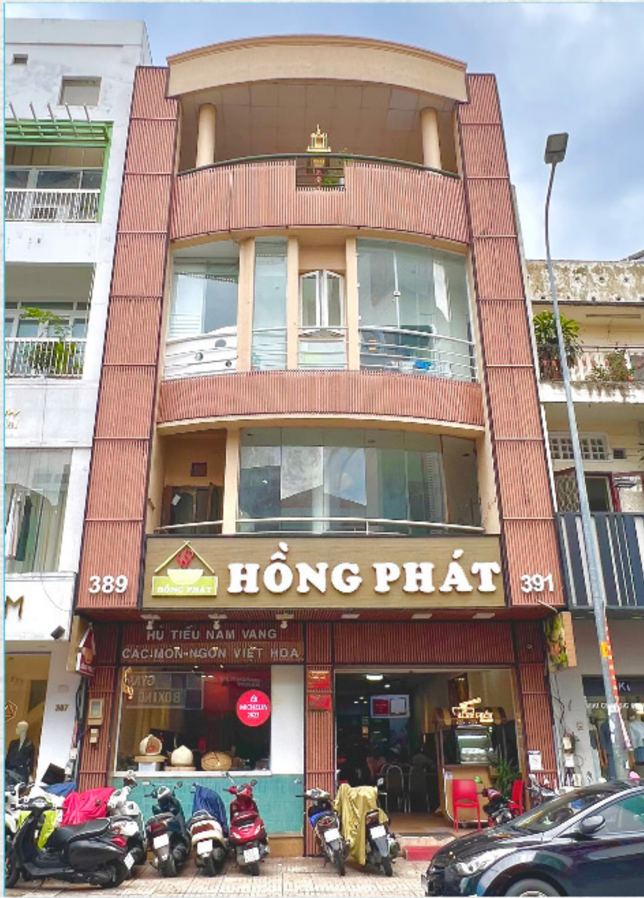
Chi Nhánh Quận 3