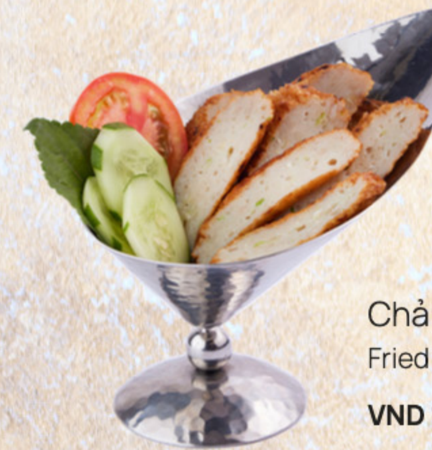
Chả cá thác lác chiên Fried Mekong fish cakes