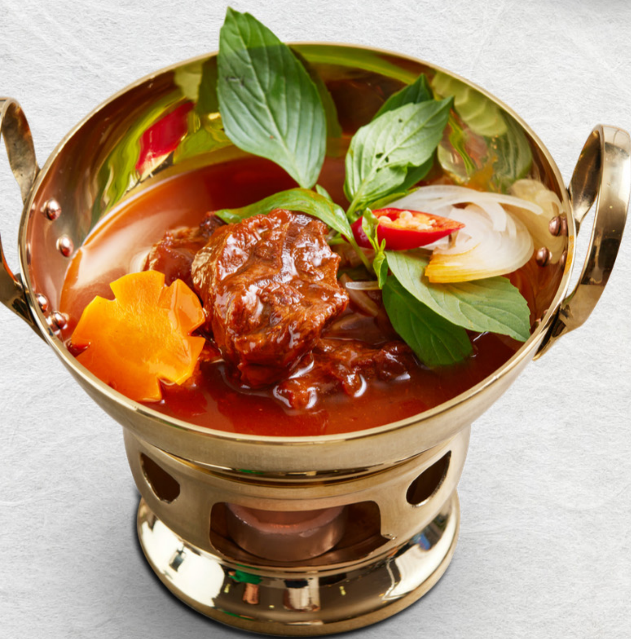
Hủ tiếu / Mì Bò Kho Stewed Beef shanks with rice / egg noodle VND 160,000