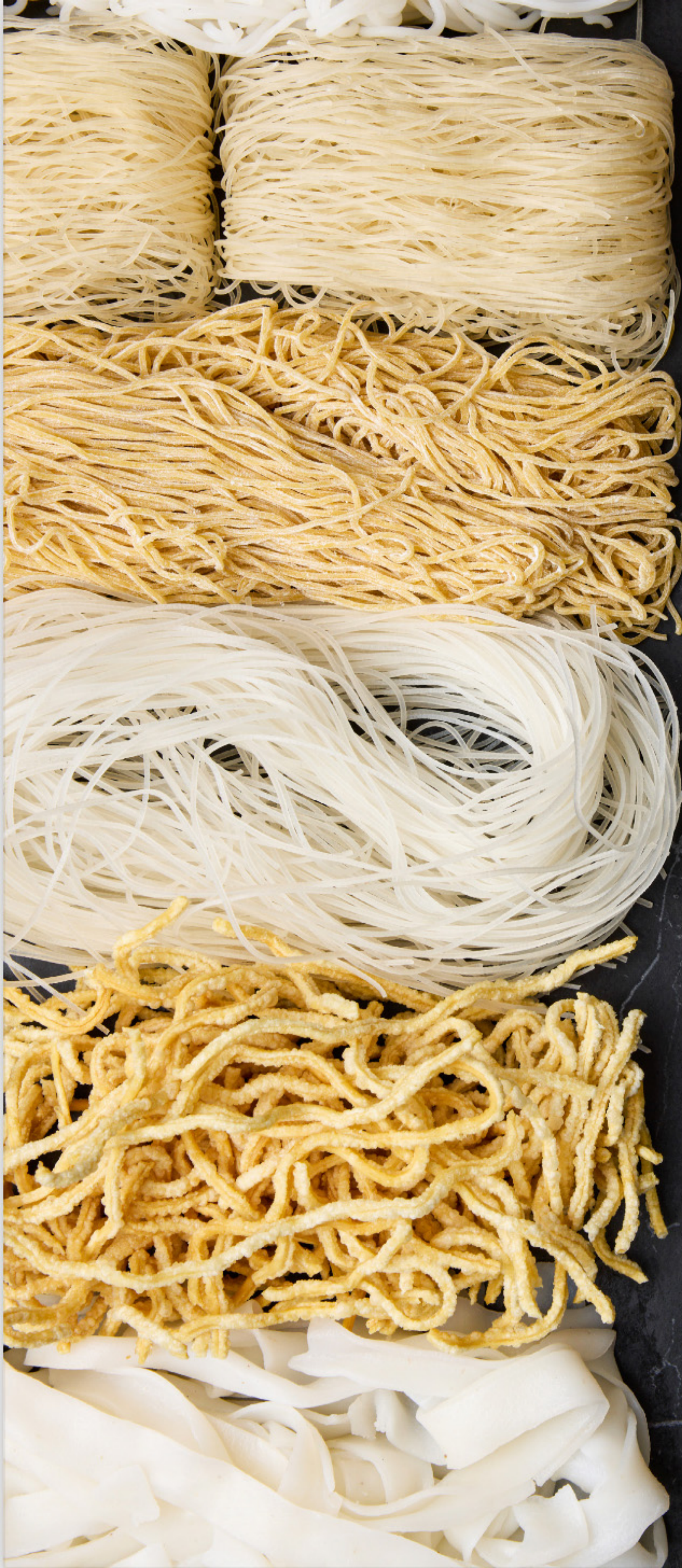
Hủ tiếu mềm Thick Rice noodles