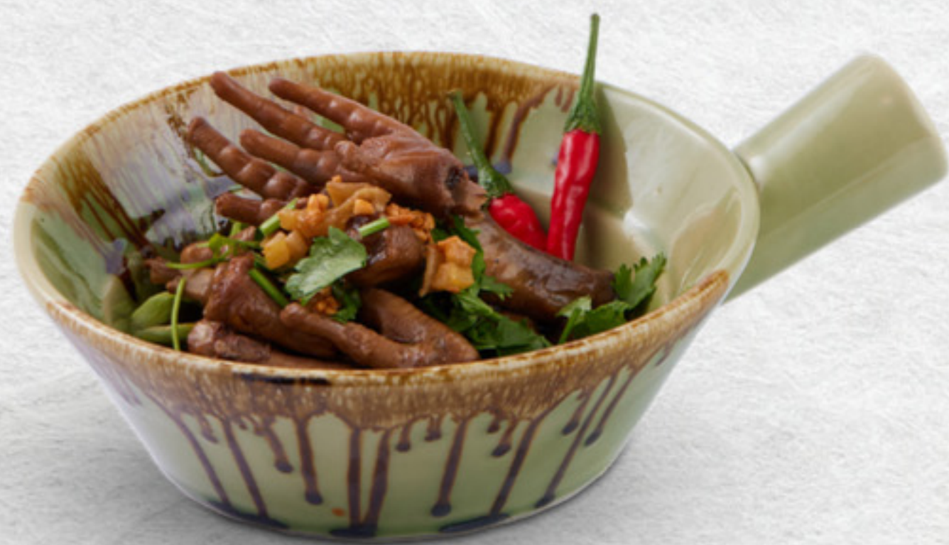
Chân gà tiêm Braised chicken feet VND 125,000