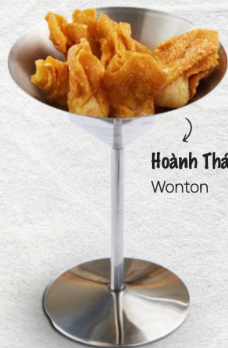
Hoành Thánh Wonton