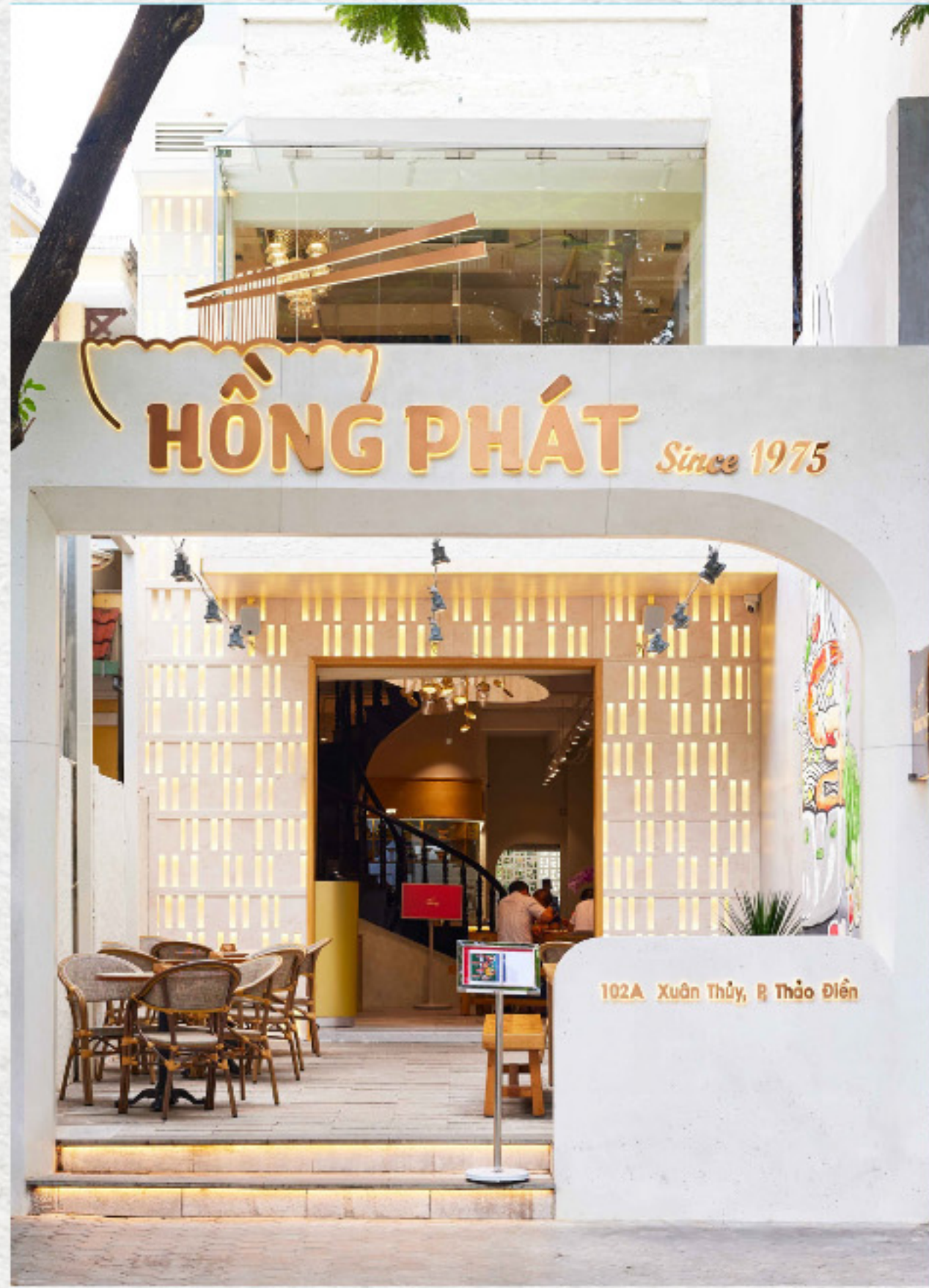
Chi Nhánh Thảo Điền