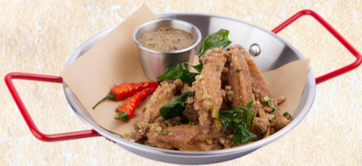
Cánh gà xóc tỏi Garlic tossed chicken wings