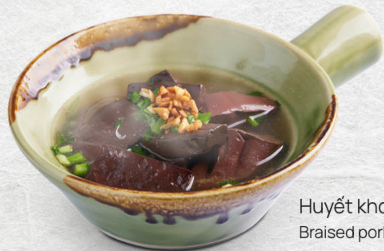
Huyết kho Braised pork blood VND 50,000