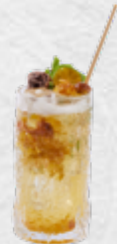
Soda tắc xí muội Salted lime with soda