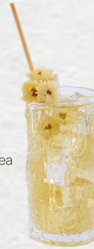
Trà bông cúc nha đam Chrysanthemum tea with aloe vera