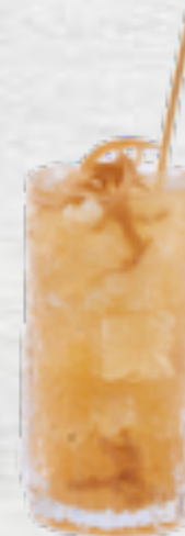
Soda chanh muối Dried plum & kumquat with soda