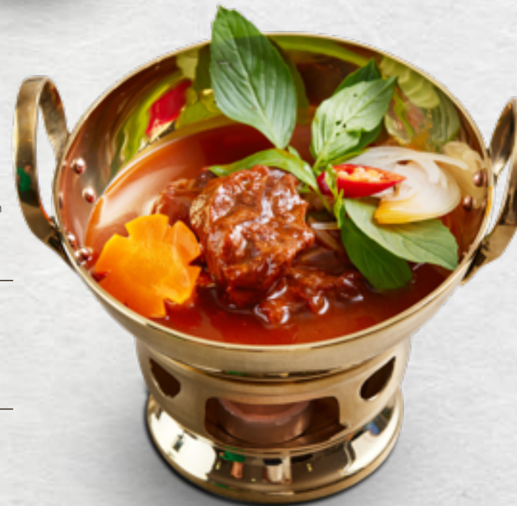
Hủ tiếu/ Mi bò kho Beef shanks stewed with rice noodle