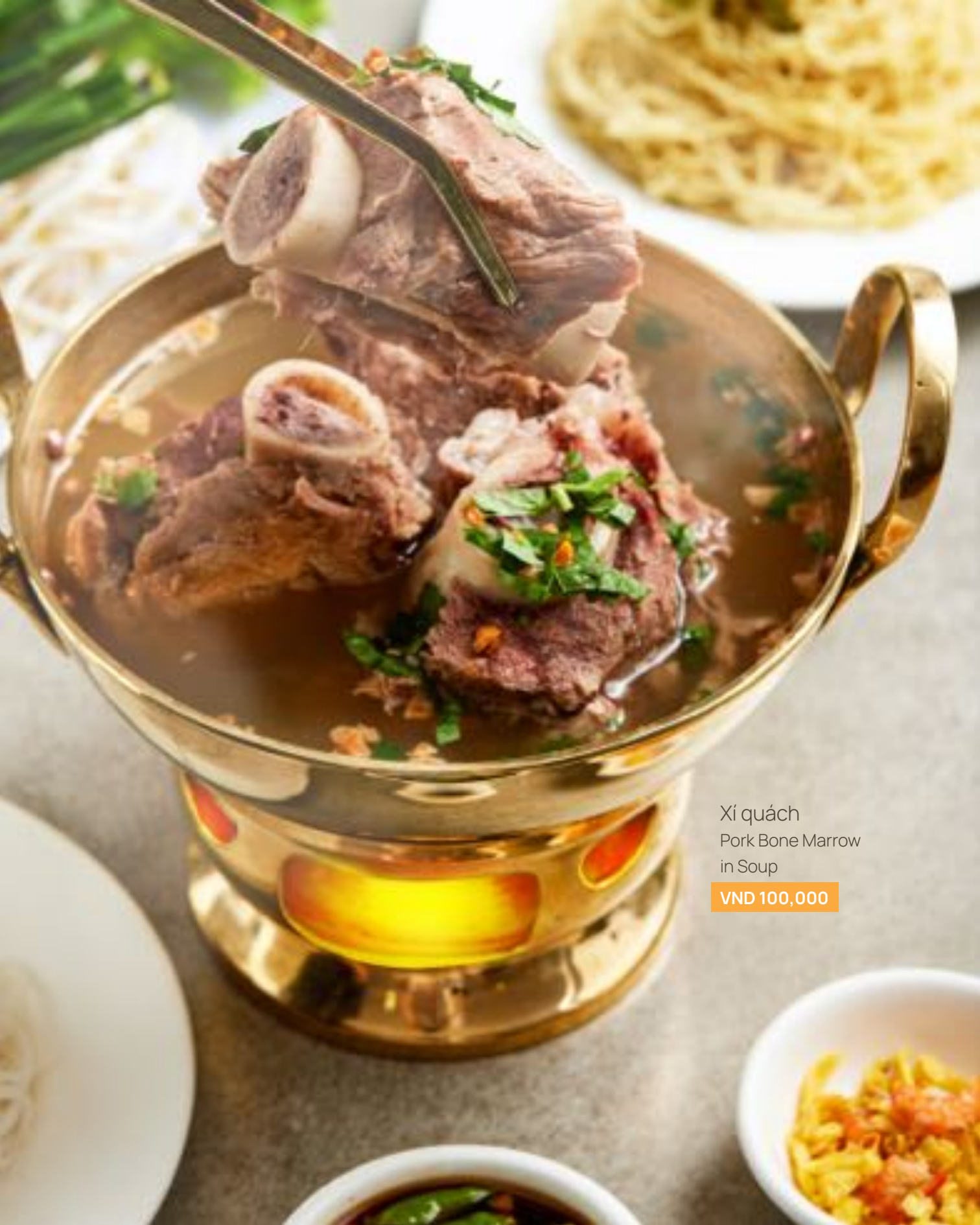
Xí quách Pork Bone Marrow in Soup