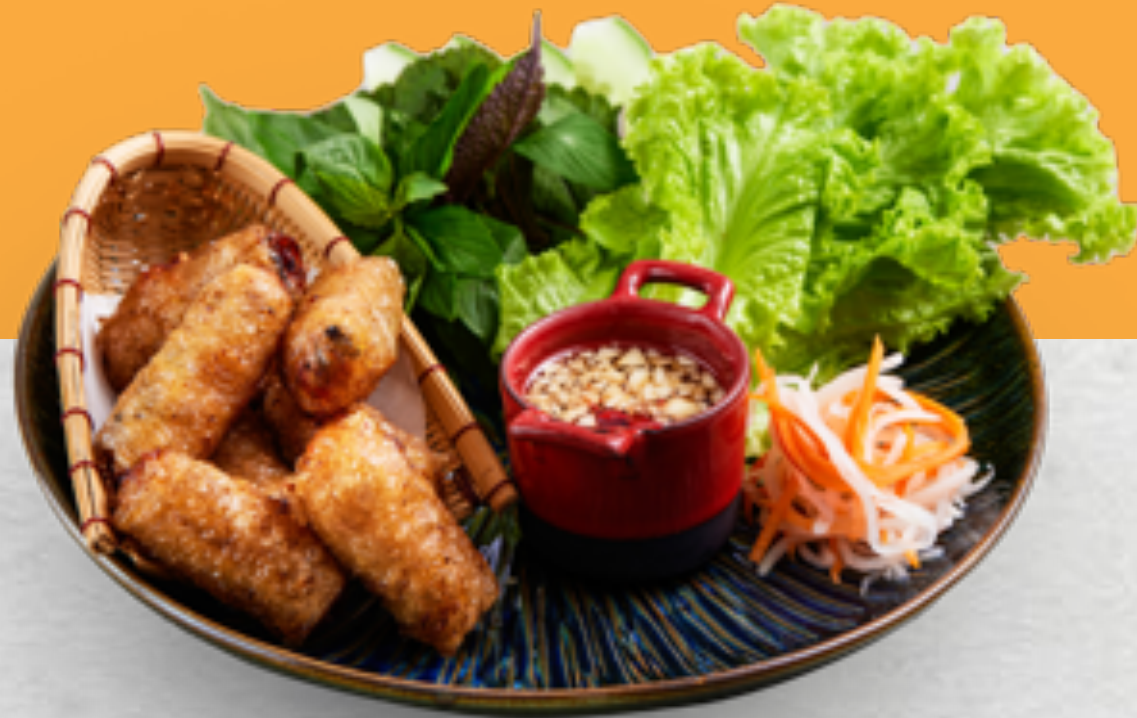
CHẢ GIÒ TÔM CUA Shrimp & Crab Spring rolls VND 130.000