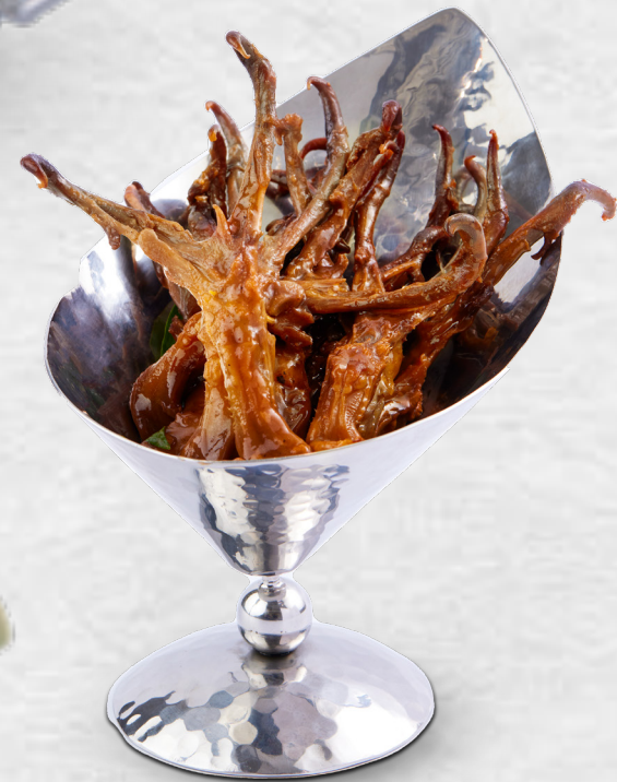
Lưỡi Vịt phá lấu Braised duck tongue VND 130,000