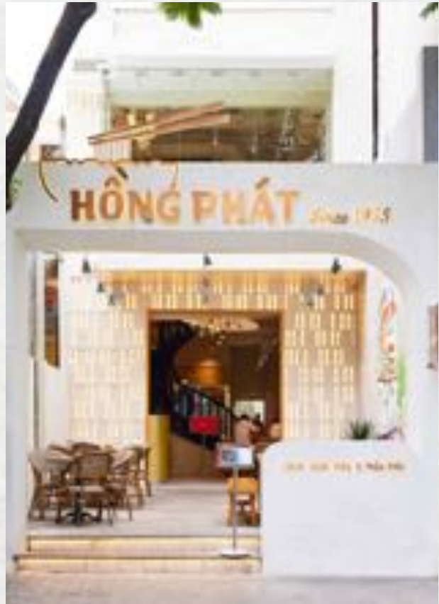
Chi Nhánh Thảo Điền