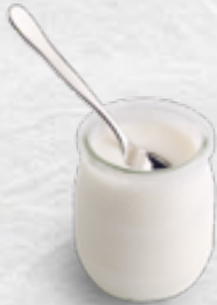
Yaourt nhà làm Homemade Yogurt VND 22,000