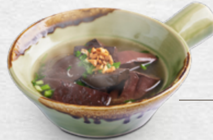
Huyết kho Braised pork blood