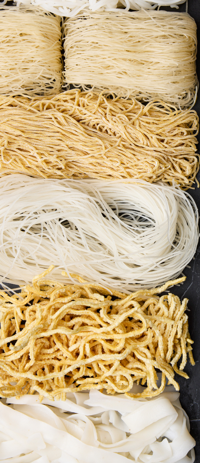
Hủ tiếu mềm Thick Rice noodles