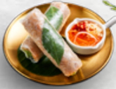
Bì cuốn (2 cuốn) Shredded pork salad rolls(2 pcs)