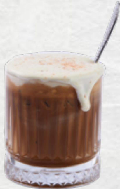
Cà phê muối Huế's style salted ice coffee