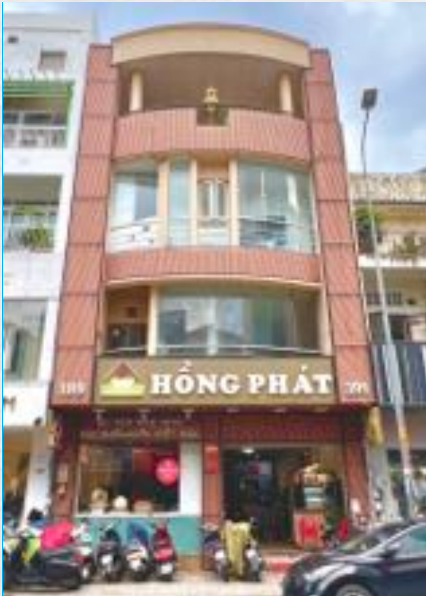
Chi Nhánh Quận 3