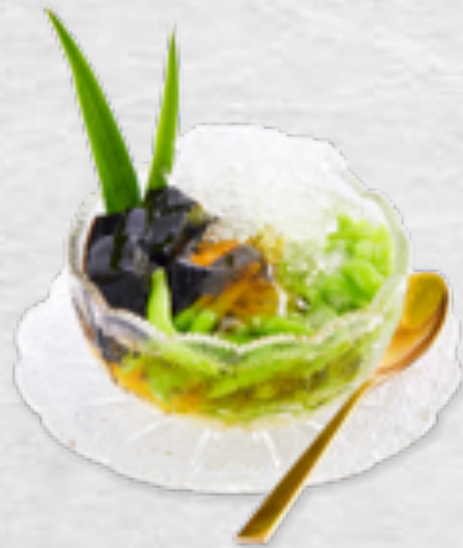
Bánh lọt đường thốt nốt Hồng Phát Pandan tapioca with Hong Phat palm sugar syrup VND 45,000