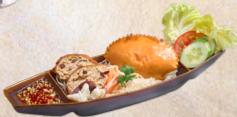
Chả cua chiên Fried crab cakes VND 149,000