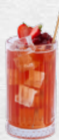
Trà dâu Strawberry tea