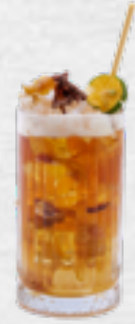
Trà tắc xí muội Dried plum & kumquat tea