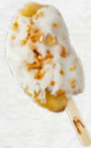
Kem chuối nhà làm Vietnamese style frozen banana popsicle VND 22,000