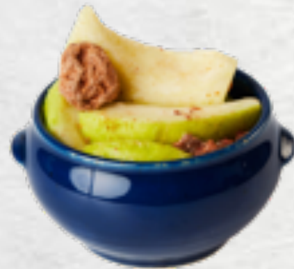
Ổi xí muối Guava mixed with dried plum VND 20,000