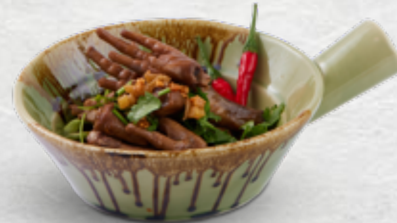
Chân gà tiềm Braised chicken feet VND 110,000