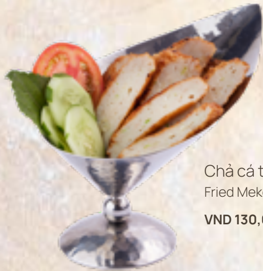
Chả cá thác lác chiên Fried Mekong fish cakes VND 130,000