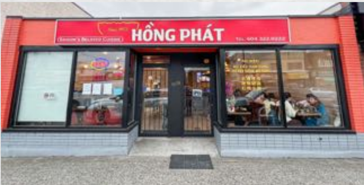
Chi Nhánh Vancouver, BC, Canada