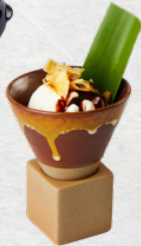
Kem dừa cà phê Coconut icecream with coffee VND 39,000