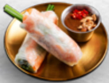
Gỏi cuốn (2 cuốn) Shrimp salad rolls (2 pcs)