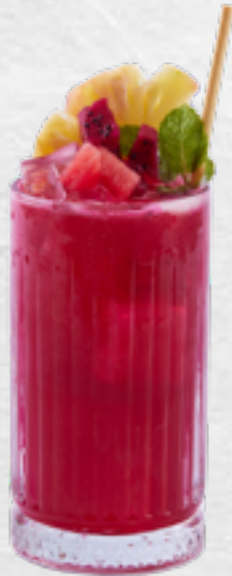
Nước ép Hồng Phát Signature Fruits pressed juice