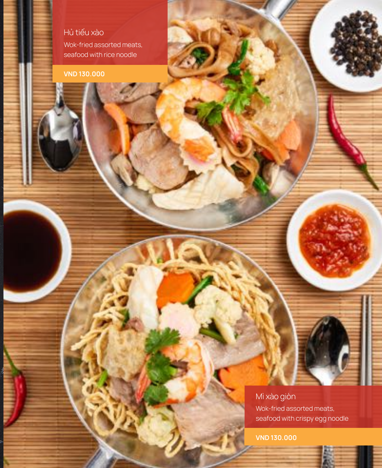
Hủ tiếu xào Wok-fried assorted meats, seafood with rice noodle VND 130.000