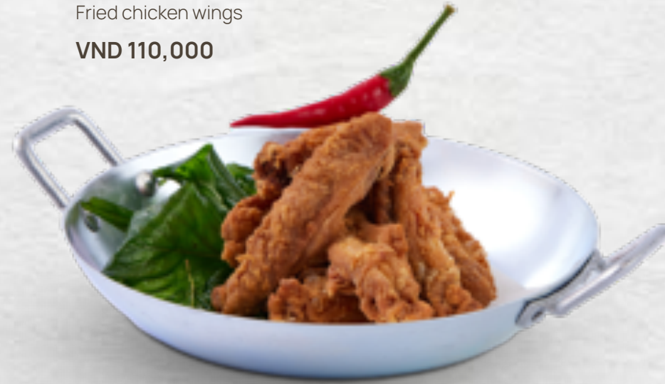
Cánh gà chiên Fried chicken wings VND 110,000