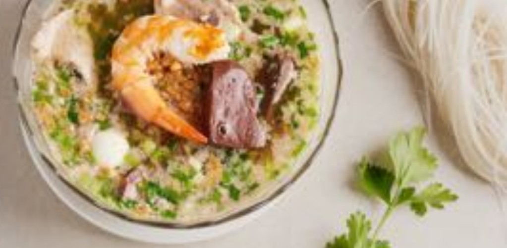
Hủ Tiếu Nam Vang Phnom Penh style rice noodle