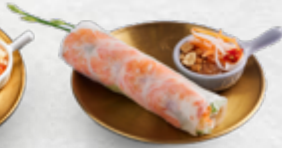
Gỏi cuốn Jumbo (1 cuốn) Jumbo size salad roll