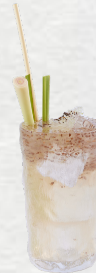
Chanh sả hạt chia Lemongrass, lime with aloe vera & chia seed