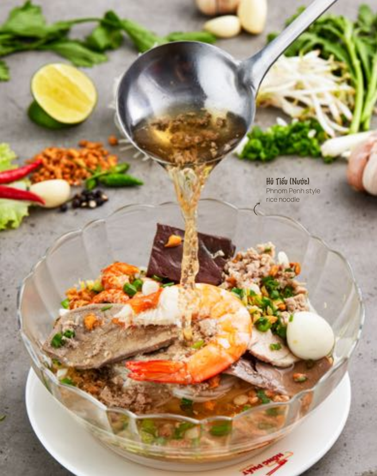
Hủ Tiếu (Nước) Phnom Penh style rice noodle