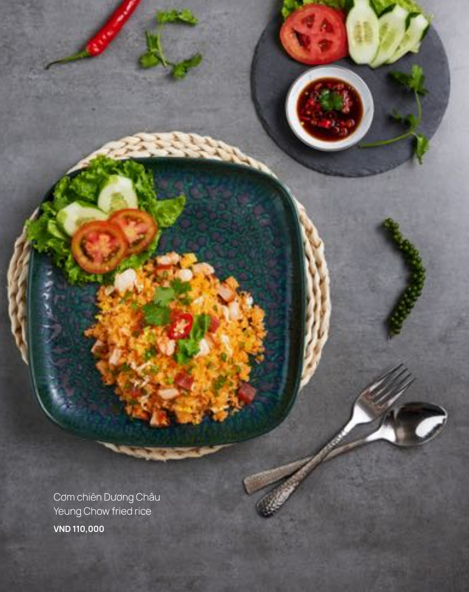
Cơm chiên Dương Châu Yeung Chow fried rice