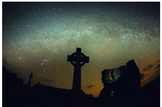
Ynys Enlli - Abaty Santes Fair a'r Llwybr Llaethog