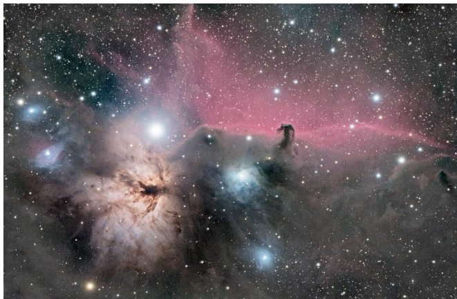
Nifwl Pen Ceffyl