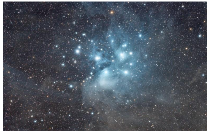
Y Saith Chwaer (Pleiades)