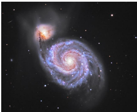
Nifwl Trobwll M51