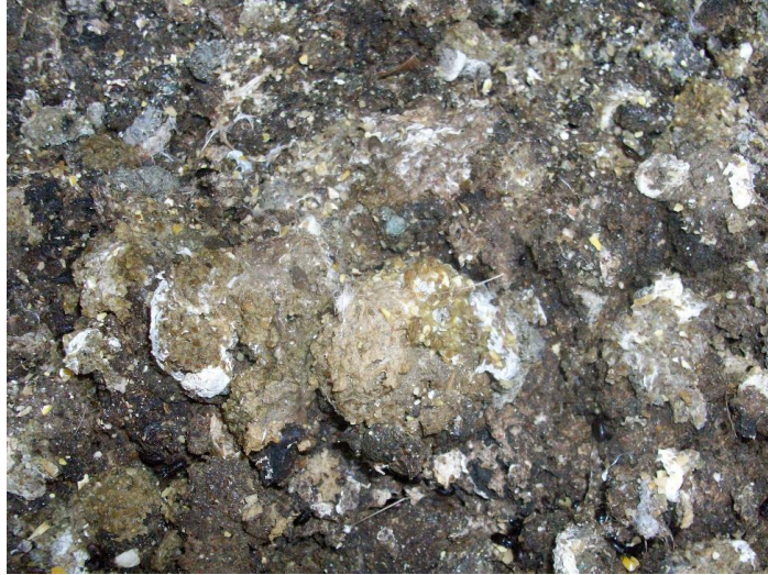
Ilustración 8. Estiércol avícola.