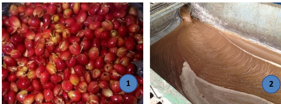
Ilustración 2. Broza de café (1) y mucilago de café (2).