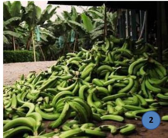
Ilustración 4. (1) Pinzote de banano, (2) banano de descarte