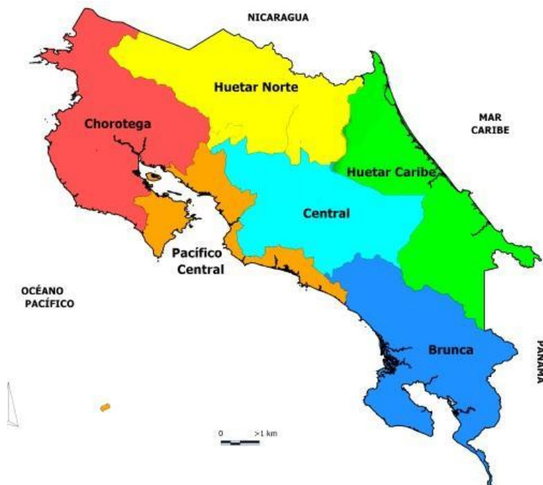
Ilustración 1. Zonificación utilizada para el potencial de metano.