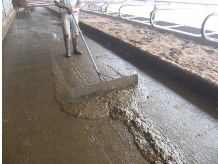
Ilustración 7. Estiércol barrido en finca lechera.