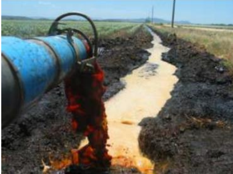
Ilustración 9. Aplicación de vinaza en cultivo de caña