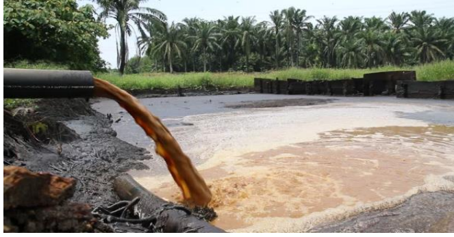
Ilustración 3. Agua residual generada de la industria de la palma aceitera.