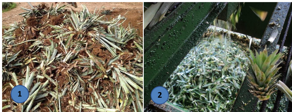
Ilustración 5. (1) Rastrojo de piña y (2) corona de piña

✓ Características físicas: La corona se estima contiene ST de 14,1% y de 83,8% SV_{bs} , con un potencial de metano de 0,263 \text{ m}^3 \text{ CH}_4/\text{kg SV} (Viquez, Joaquin (Viogaz), 2013).