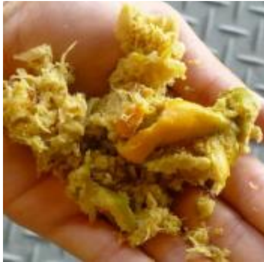
Ilustración 10. Ejemplo de la broza o cáscara de naranja.