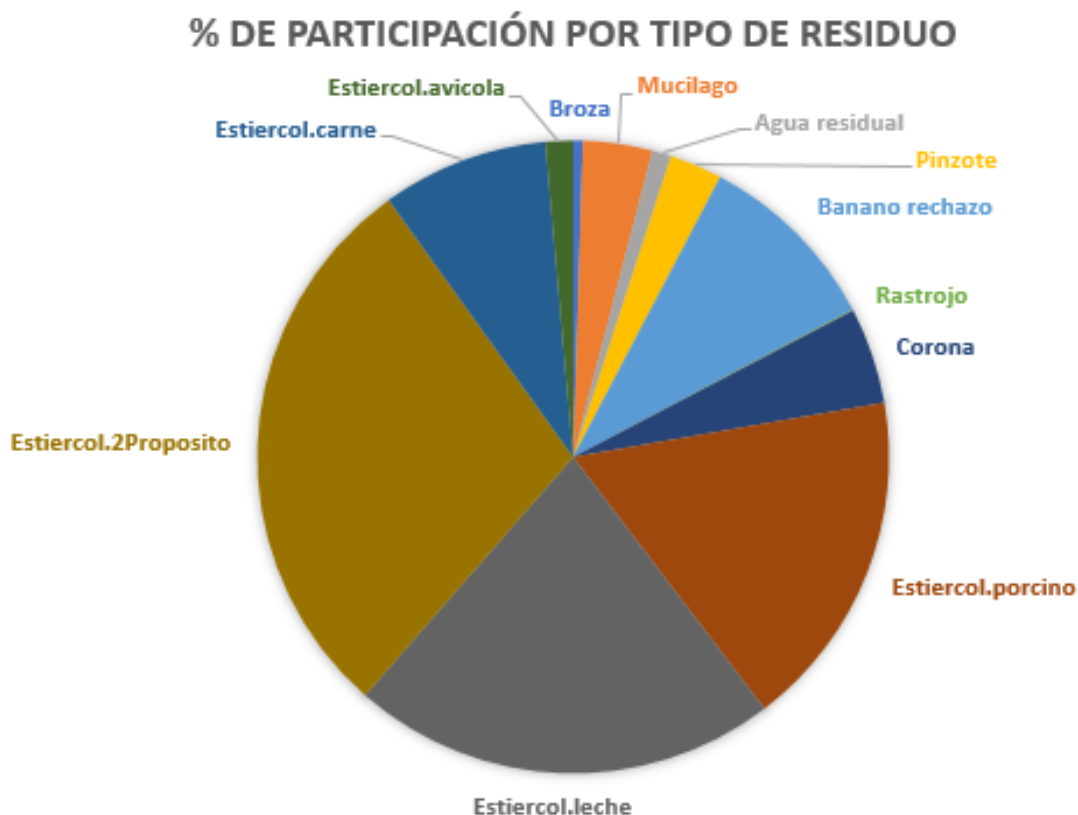
Ilustración 13. Participación porcentual en el potencial de metano por tipo de residuo en Costa Rica.