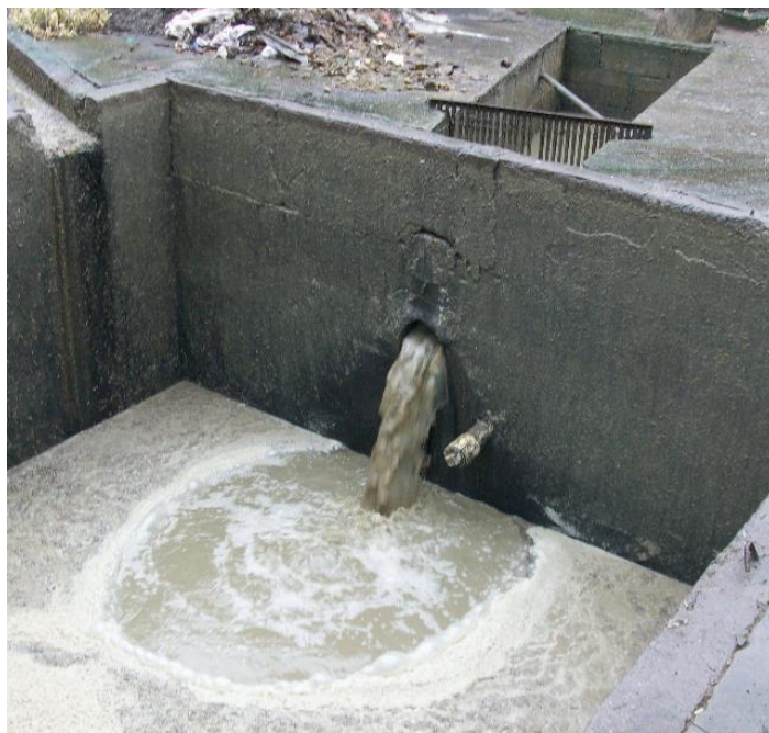
Ilustración 6. Aguas residuales de la industria porcina