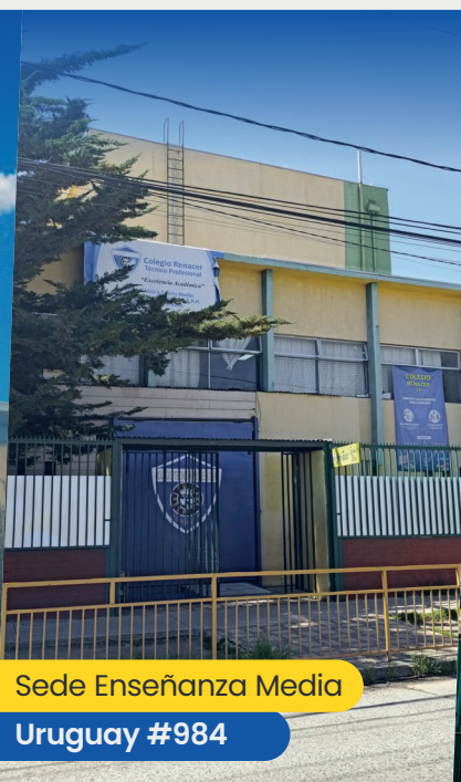
Sede Enseñanza Media Uruguay #984