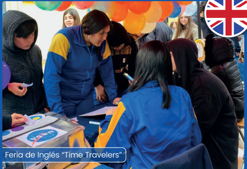
Feria de Inglés "Time Travelers"