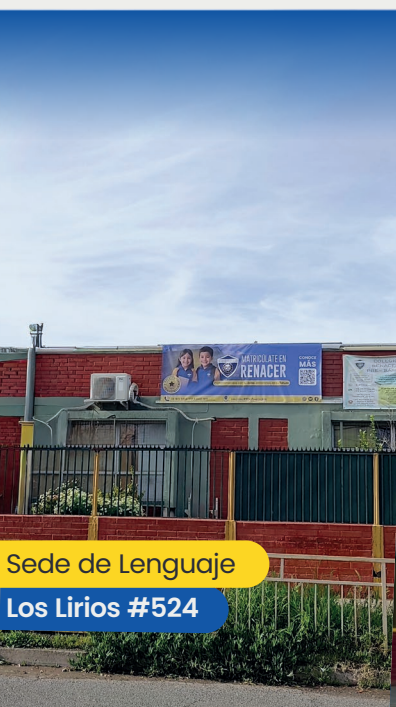
Sede de Lenguaje Los Lirios #524

Los invitamos a recorrer esta edición con la certeza de que cada actividad aquí presentada es parte del camino formativo que impulsa a nuestros estudiantes a crecer, aprender y proyectarse con confianza hacia el futuro.