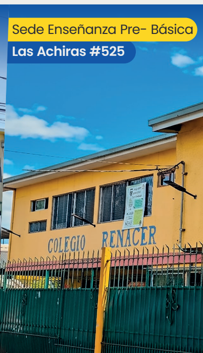
Sede Enseñanza Pre- Básica Las Achiras #525