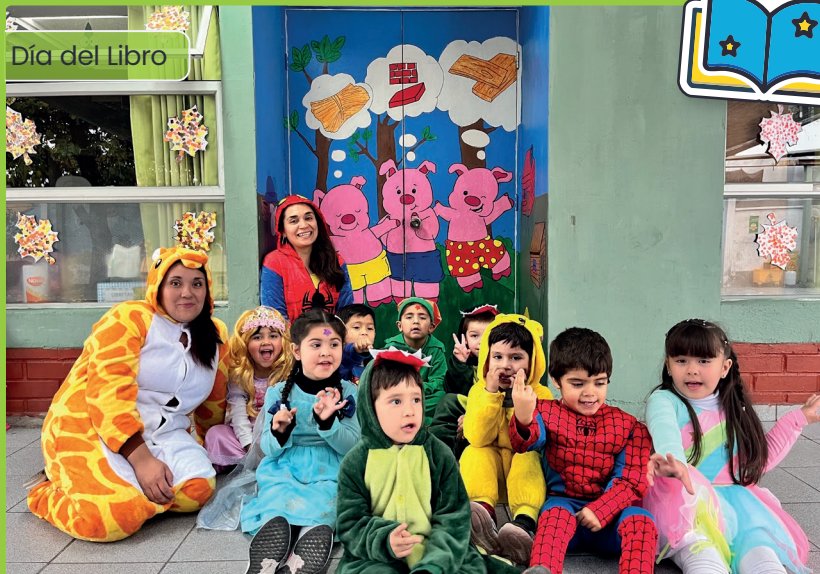
Día del Libro

En el área de Pre-Básica común y de Lenguaje del Colegio Renacer, cada actividad pedagógica está pensada para acompañar a los niños y niñas en sus primeros aprendizajes, respetando sus ritmos y potenciando su curiosidad natural. A través del juego, la exploración y experiencias significativas, se fortalecen habilidades sociales, emocionales y cognitivas fundamentales para su desarrollo integral, siempre en un entorno seguro, afectivo y estimulante, construido en conjunto con las familias.