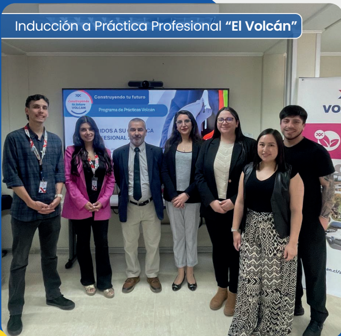
Inducción a Práctica Profesional "El Volcán"