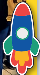
Feria de Ciencias y Tecnología