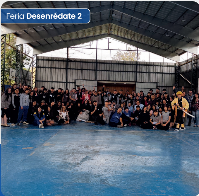
Feria Desenrédate 2