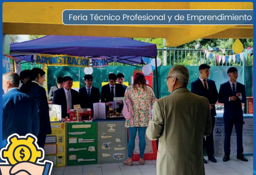
Feria Técnico Profesional y de Emprendimiento