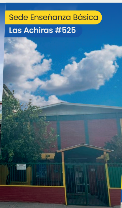
Sede Enseñanza Básica Las Achiras #525