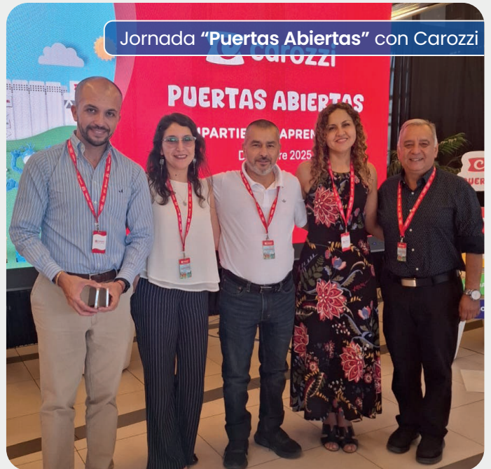
Jornada "Puertas Abiertas" con Carozzi