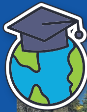
Gira de Estudios Cabrero - Los Ángeles