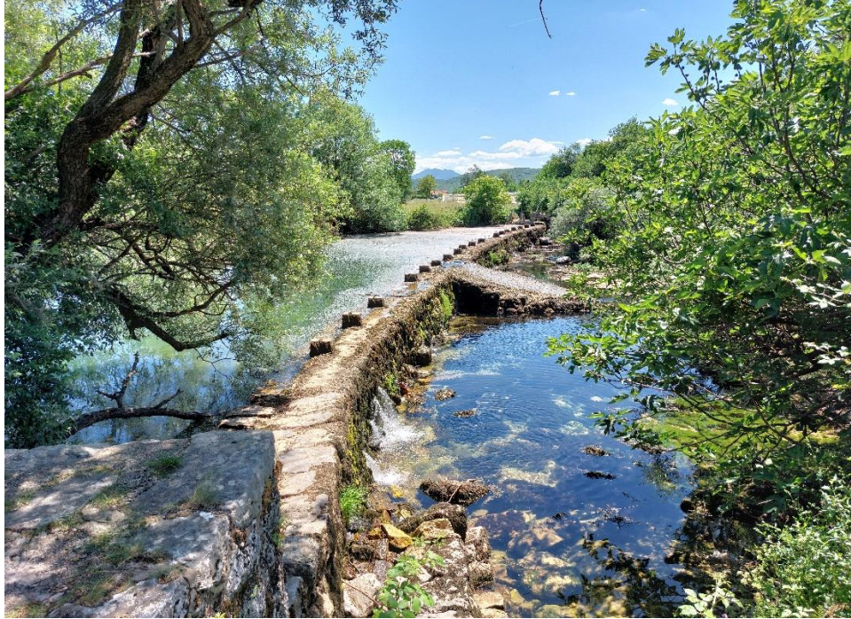
Jedna od barijera na rijeci Zeti, Nikšić, 2022. Godine