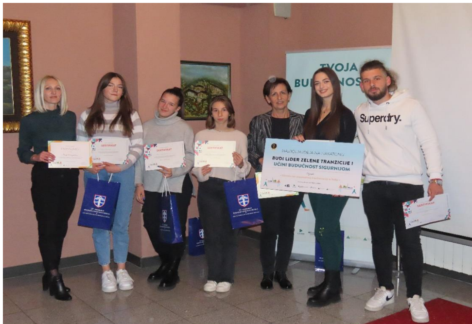
Hakaton "Budi lider zelene tranzicije i učini budućnost sigurnijom", Novembar 2022, Pljevlja