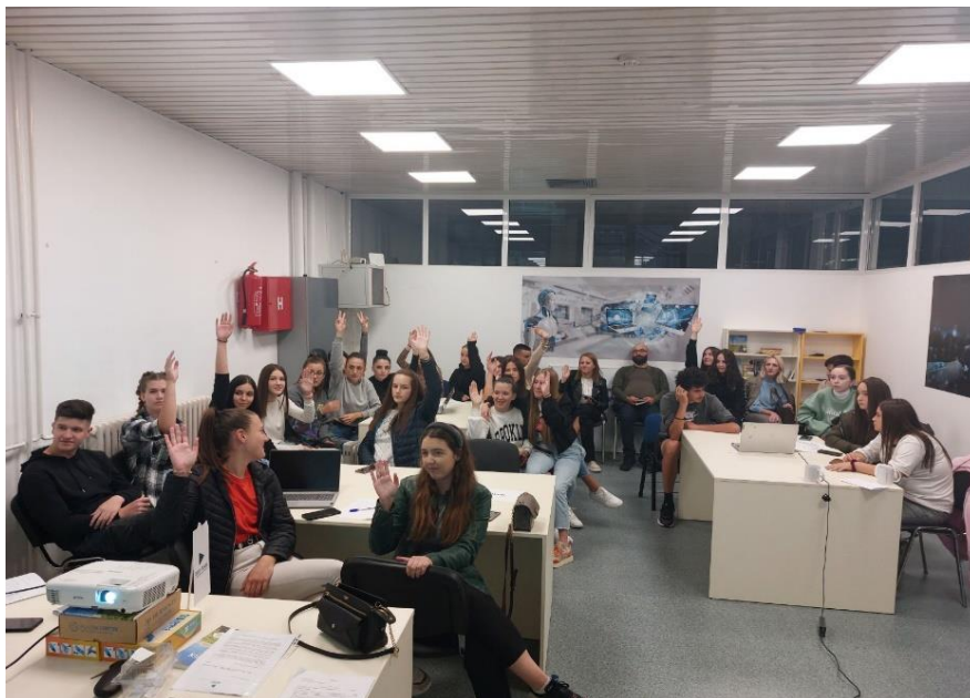
Simulacija socio-ekonomskog savjeta (ECOSOC), Pljevlja, septembar 2022. godine