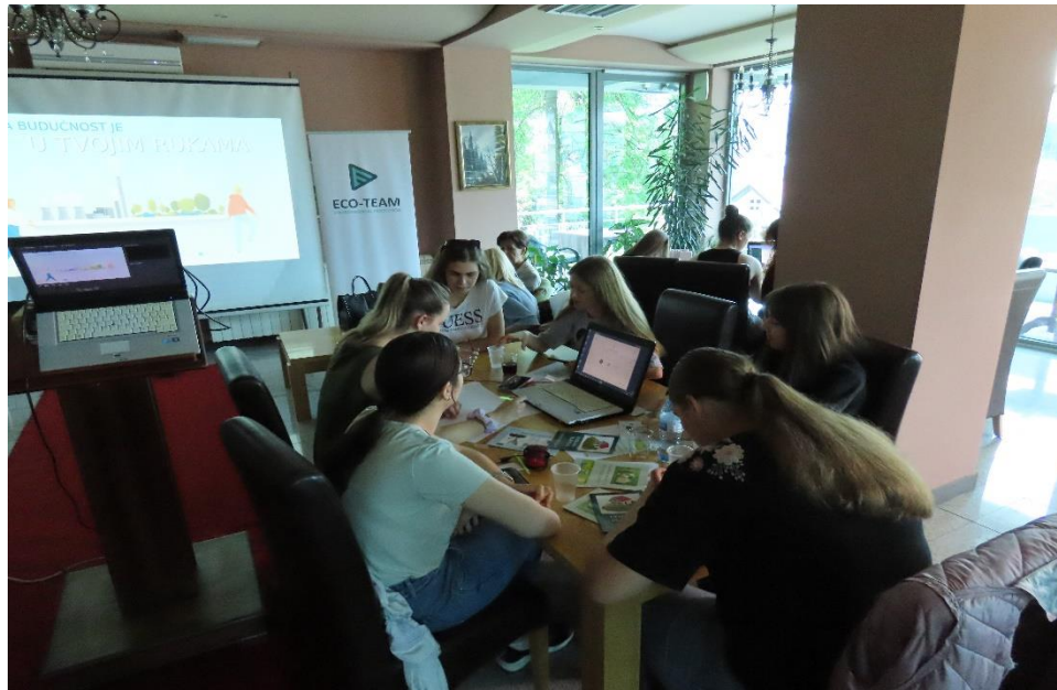
Hakaton "Tvoja budućnost je u tvojim rukama", Jun 2022, Pljevlja

rješavanje ekoloških problema. Mladi su koristili prethodno stečena znanja kroz edukativne programe, a ideje su prezentovali pred stručnim žirijem;