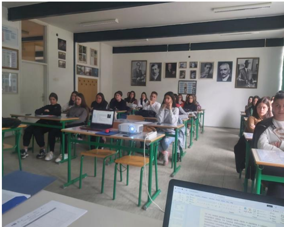
Realizacija edukativnog programa u “Srednjoj stručnoj školi”, april – maj, 2022, Pljevlja