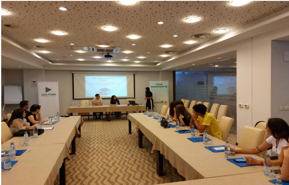
Okrugli sto “Mladi, nosioci zelene tranzicije”, Jun 2022. Pljevlja

dodatno, događaj je ujedno imao i svrhu započinjanja dijaloga između mladih i relevantnih zainteresovanih strana iz oblasti Pravedne tranzicije.