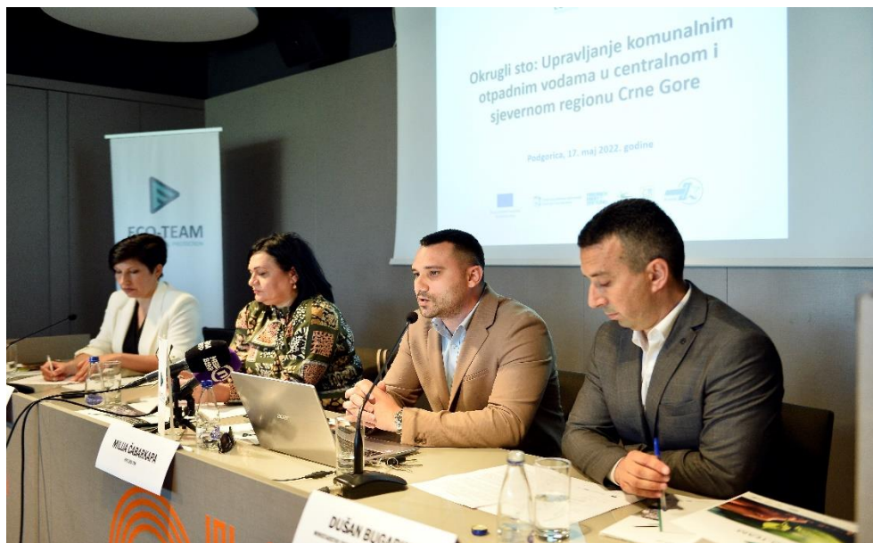
Okrugli sto, Podgorica, maj 2022. godine