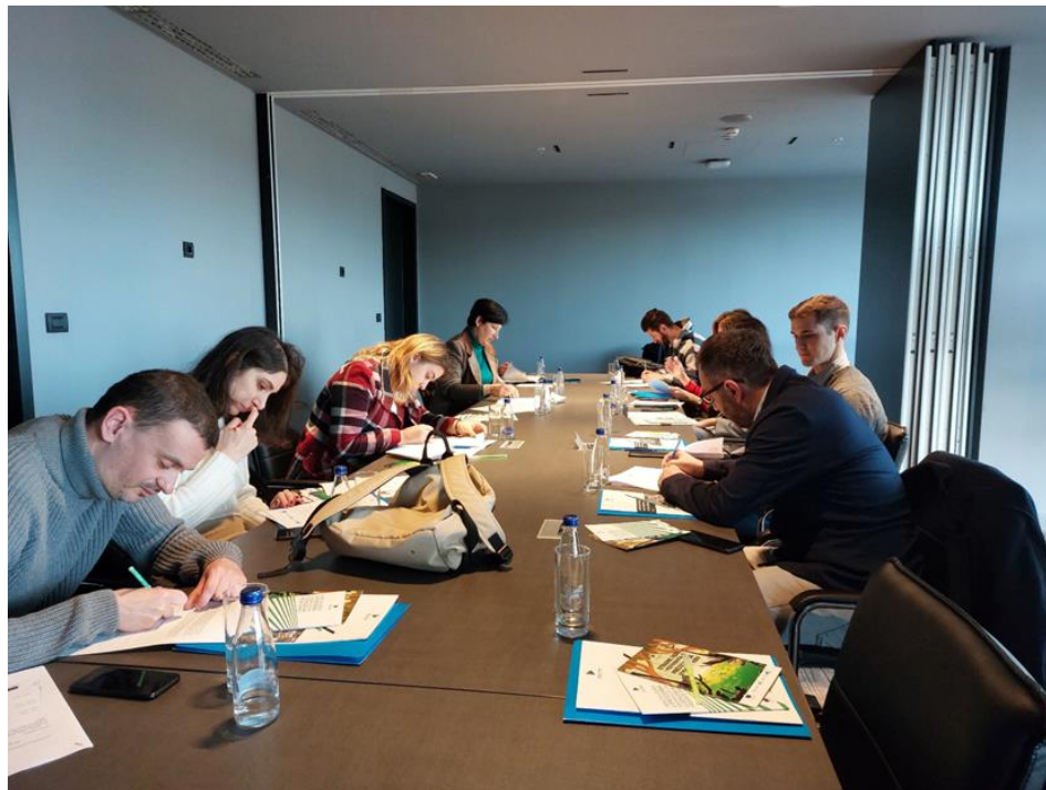
Trening za medije, Podgorica, februar 2022. godine