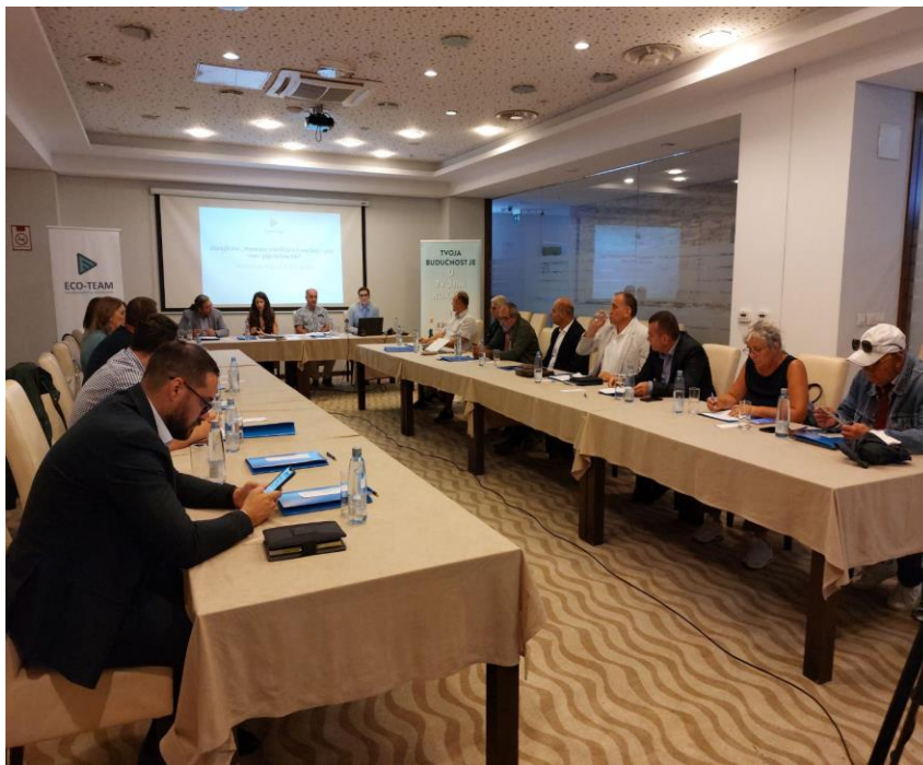
Okrugli sto "Pravedna tranzicija u Crnoj Gori, gdje smo sada i gdje želimo biti", Pljevlja, jun 2022. godine