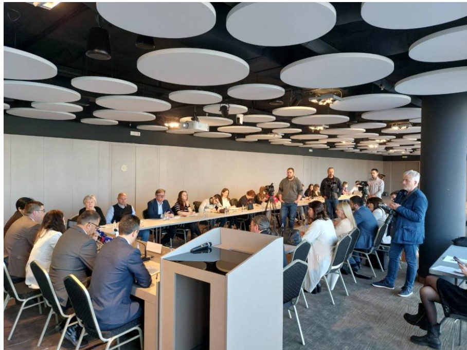
Okrugli sto „Implikacije politike EU i uticaj izazova na energetsom tržištu na energetske sektor u Crnoj Gori“, mart 2022.