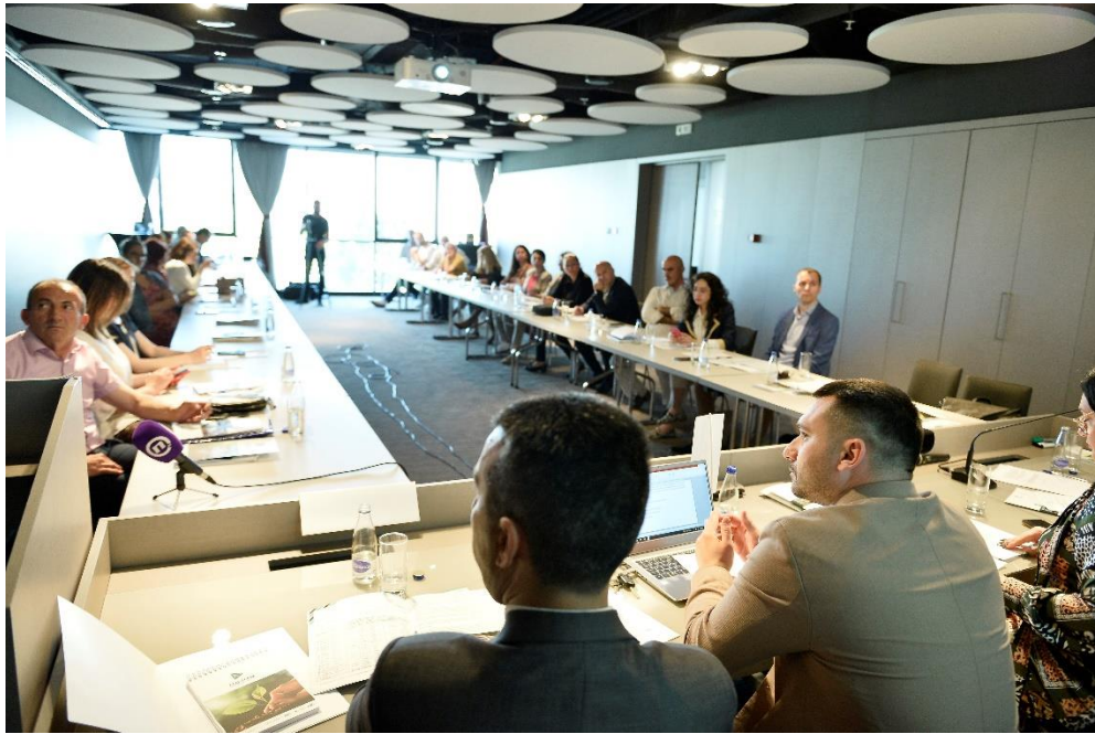
Okrugli sto, Podgorica, maj 2022. godine