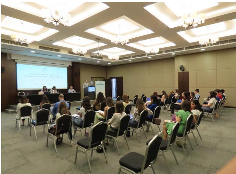
Edukativna konferencija za studente, maj 2022, Podgorica