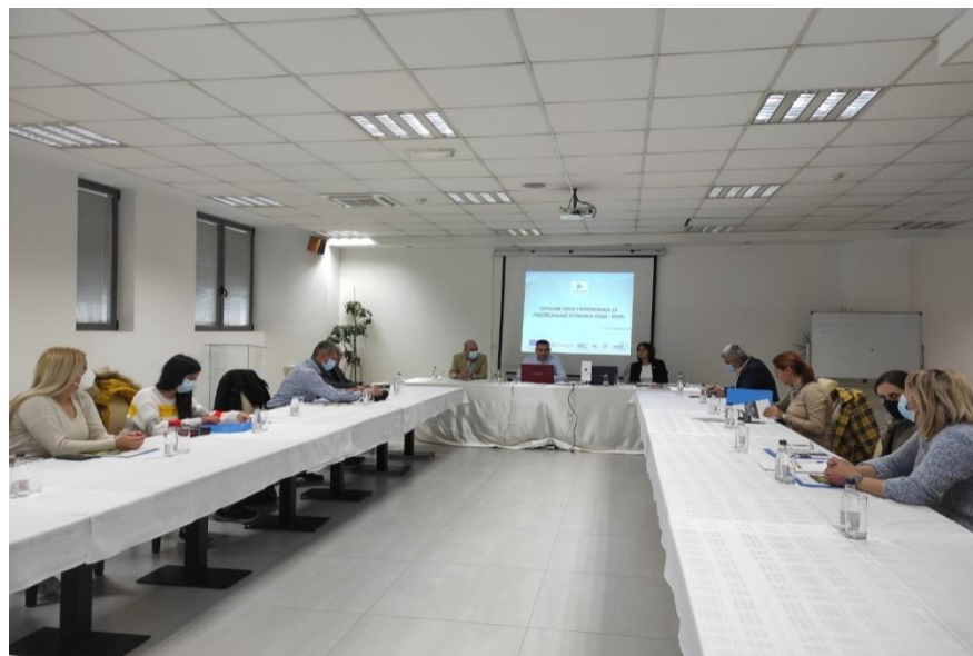
Trening za OCD, novembar 2021, Bijelo Polje