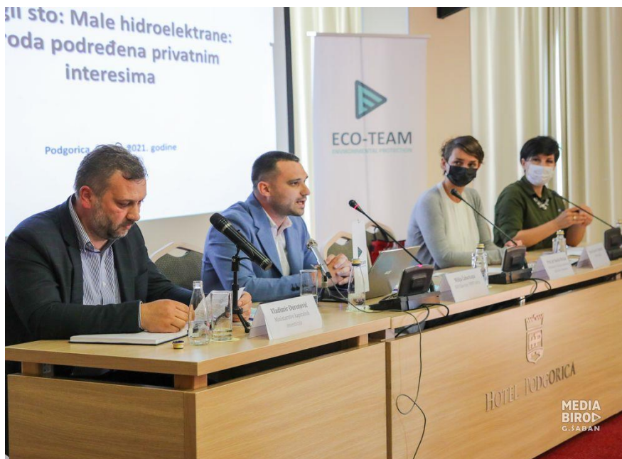
Okrugli sto "Male hidroelektrane: priroda podređena privatnim interesima", jun 2021, Podgorica

projekte malih hidroelektrana (mHE) koja je sprovedena od strane WWF Adrije, te su donosiocima odluka poslate jasne poruke da su projekti mHE štetni projekti sa ekološkog, ekonomskog i socijalnog aspekta. Takođe, okrugli sto je bio prilika da se čuje glas lokalnih zajednica koje su se borile za očuvanje rijeka u svojim selima koje su bile ugrožene planiranim projektima mHE.