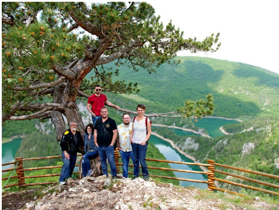
Meandri rijeke Čehotine, jun 2021, opština Pljevlja