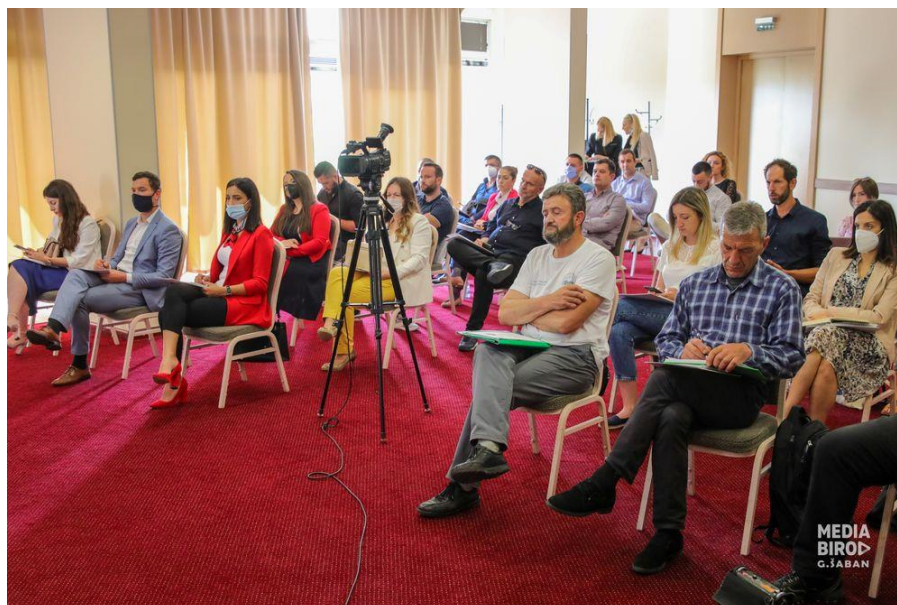
Okrugli sto "Male hidroelektrane: priroda podređena privatnim interesima", jun 2021, Podgorica