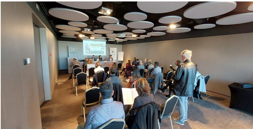
Okrugli sto "Pravci daljeg razvoja elektroenergetskog sistema Crne Gore", oktobar 2021