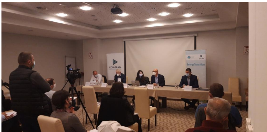
Sastanak Platforme za Pravednu tranziciju, mart 2021