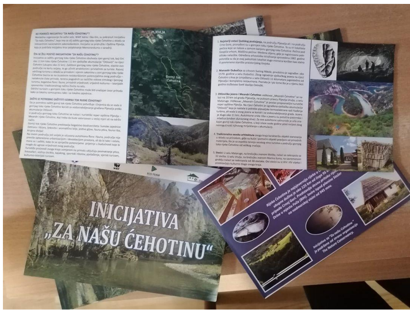
Brošura o vrijednostima gornjeg toka rijeke Čehotine