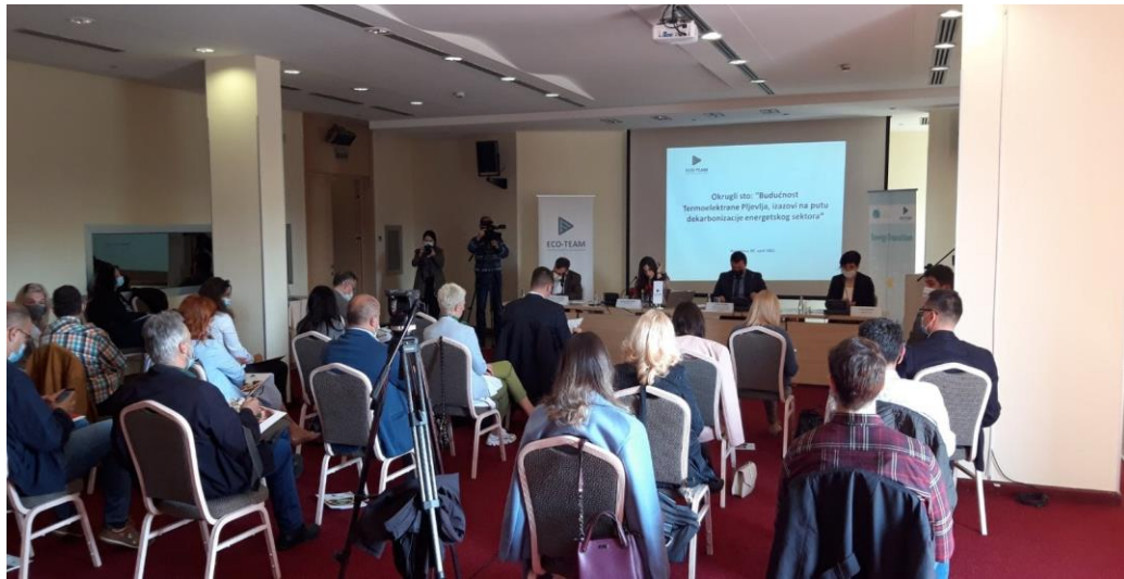
Okrugli sto „Budućnost Termoelektrane Pljevlja, izazovi na putu dekarbonizacije energetskeg sektora“, april 2021.