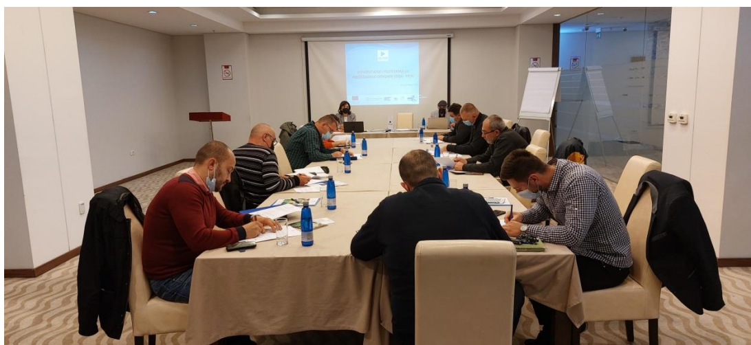
Trening za OCD, novembar 2021, Pljevlja