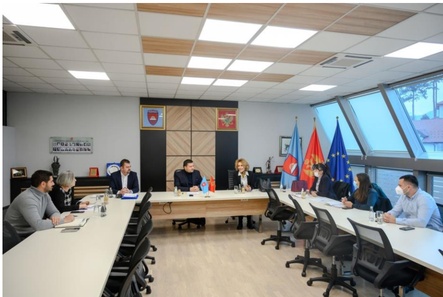
Sastanak sa predsjednikom Opštine Bijelo Polje, novembar 2021, Bijelo Polje