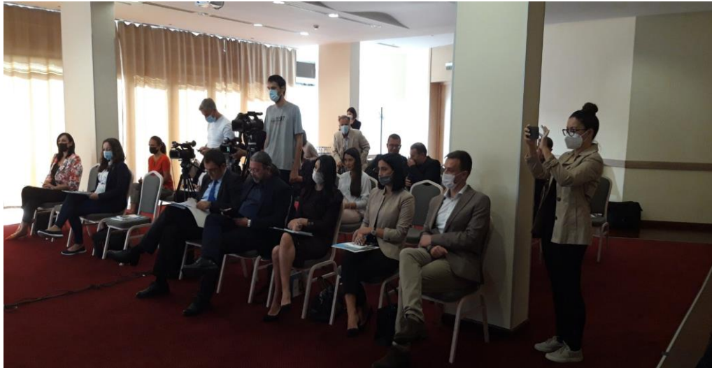
Nacionalna konferencija o pravednoj tranziciji, septembar 2021.

razvoja, stručnjaci i kolege iz drugih evropskih organizacija govorili su na konferenciji o pravednoj tranziciji ;