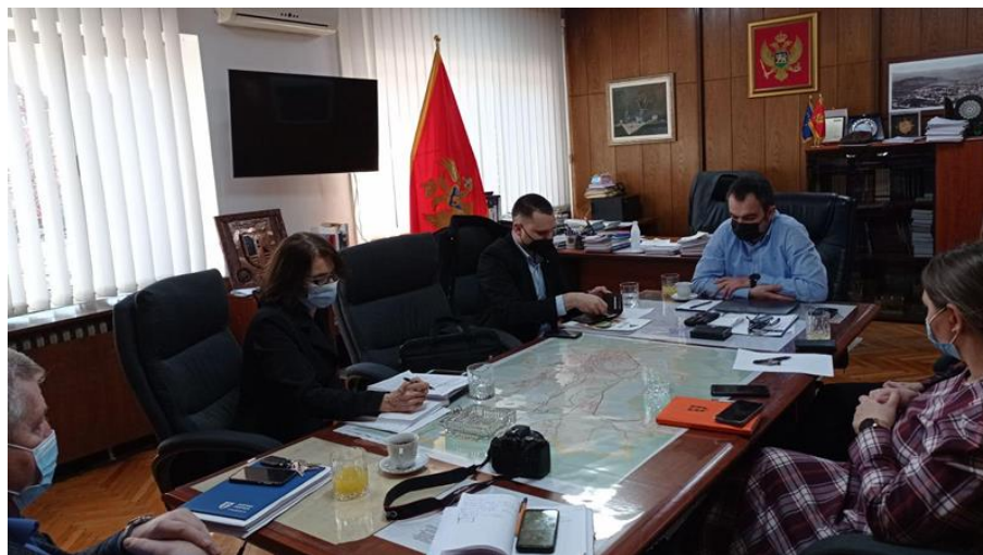
Sastanak sa predsjednikom Opštine Pljevlja, februar 2021, Pljevlja