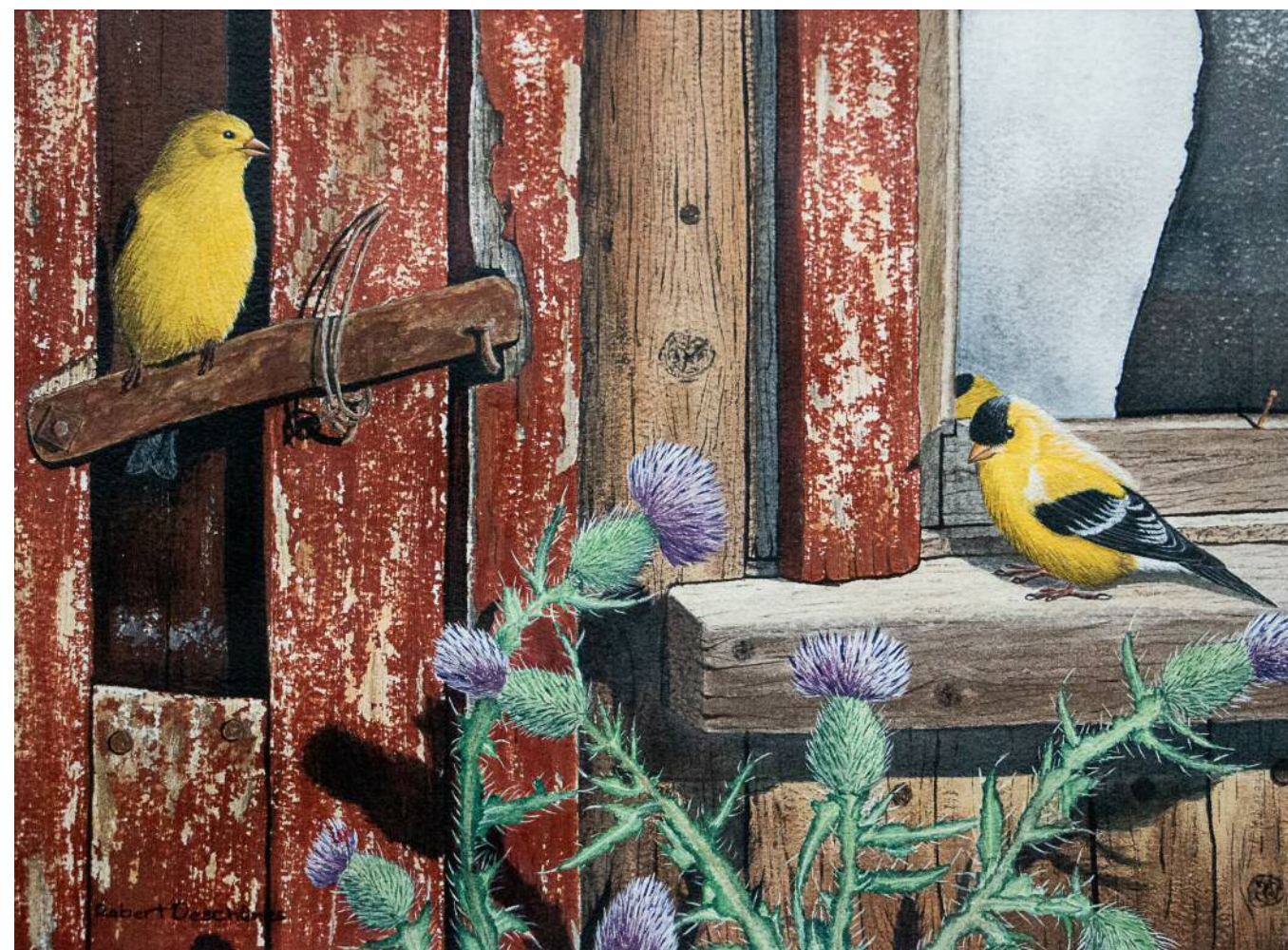
Chardonnerets Acrylique 13" x 14"