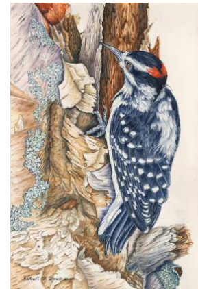
TITLE: HAIRY WOODPECKER

OPEN THEME 2022 INTERNATIONAL JURIED PAINTING COMPETITION