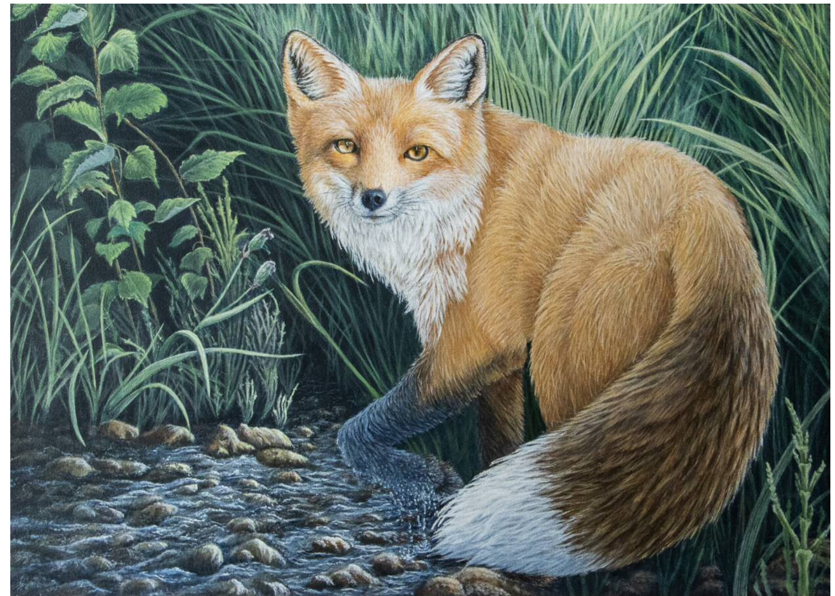
Renard Roux Acrylique 13" x 18"