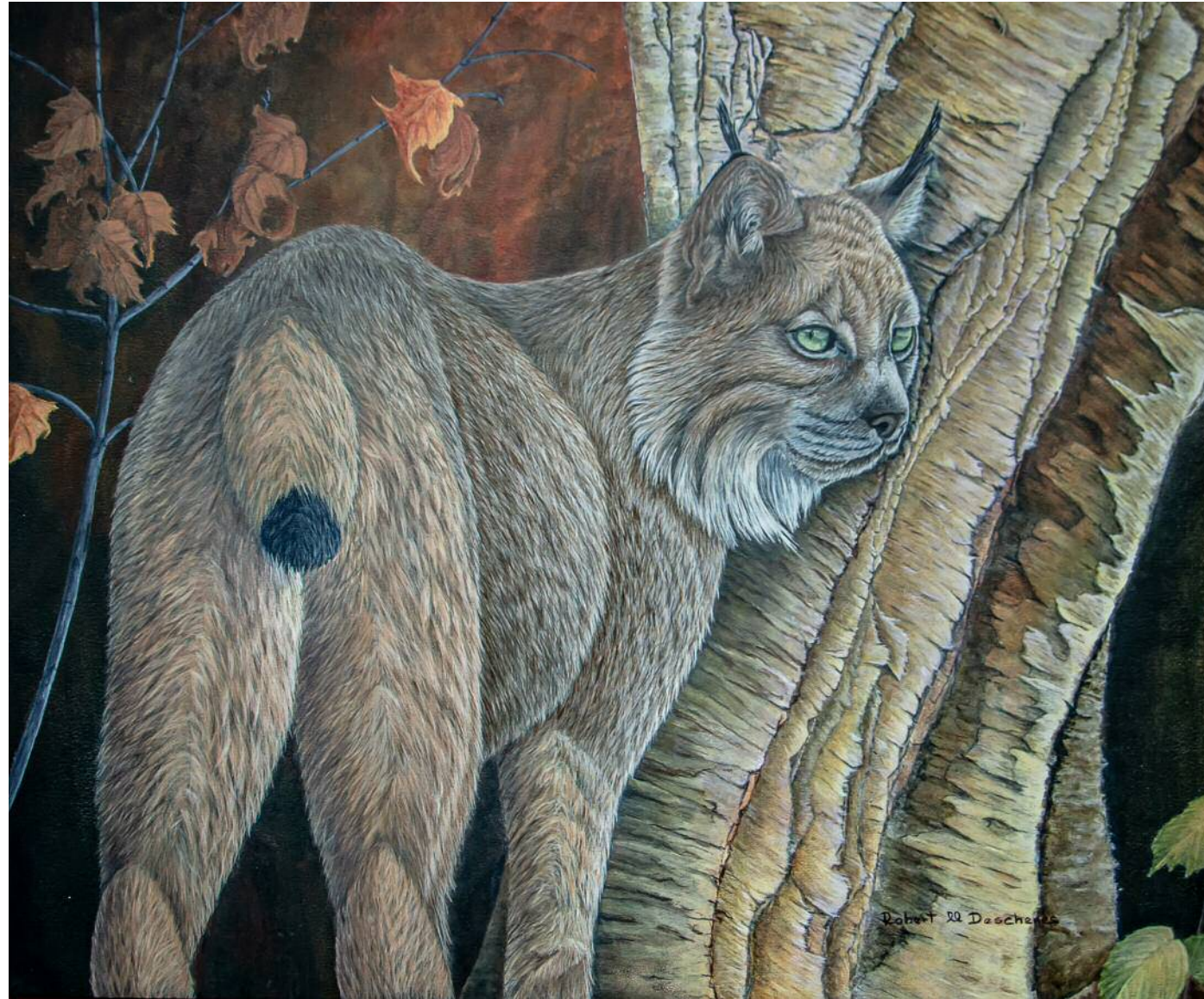
Lynx duC Canada Robe d'été Acrylique 20" x 24"