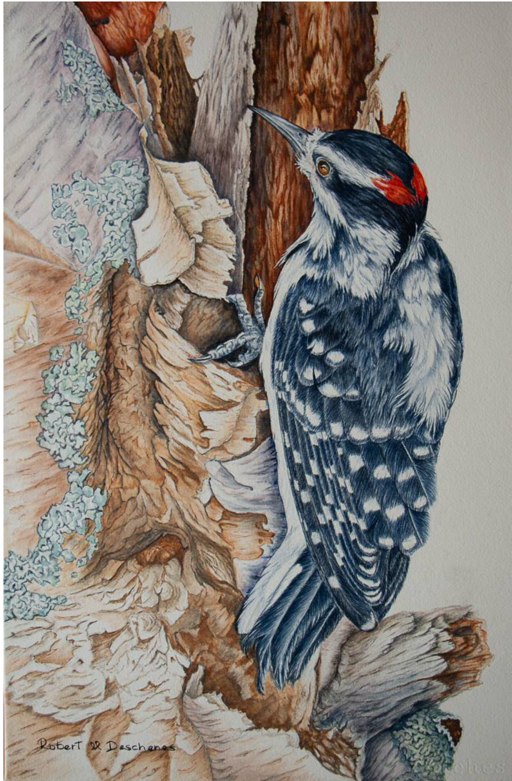
Pic Chevelu Aquarelle 13" x 20"