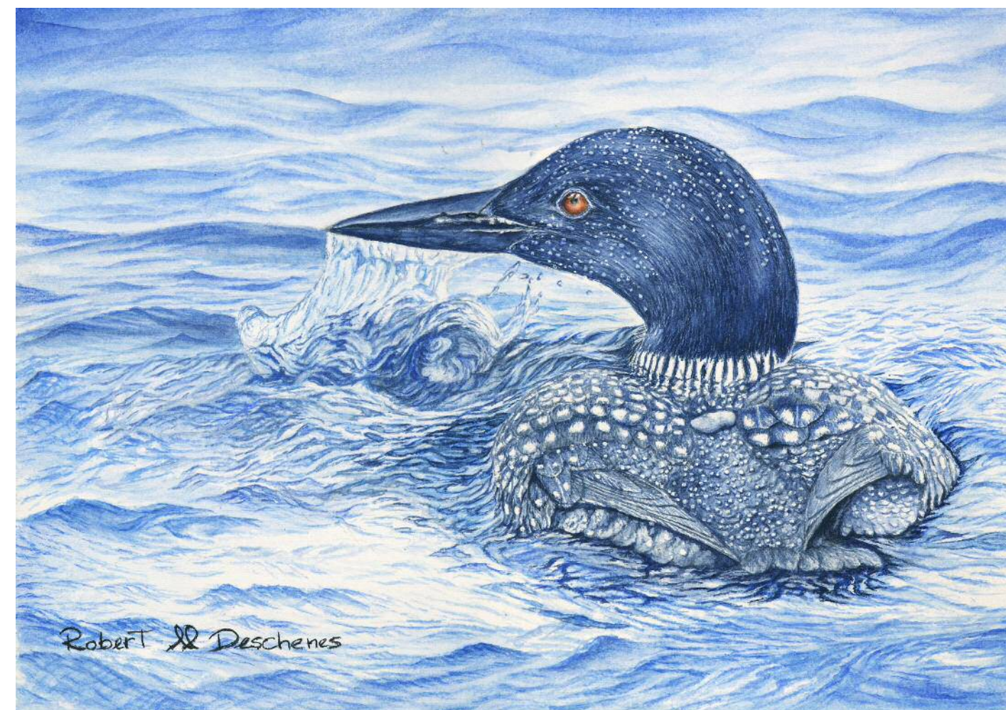
Plongeon Huart Aquarelle 9,5" x 13,5 "