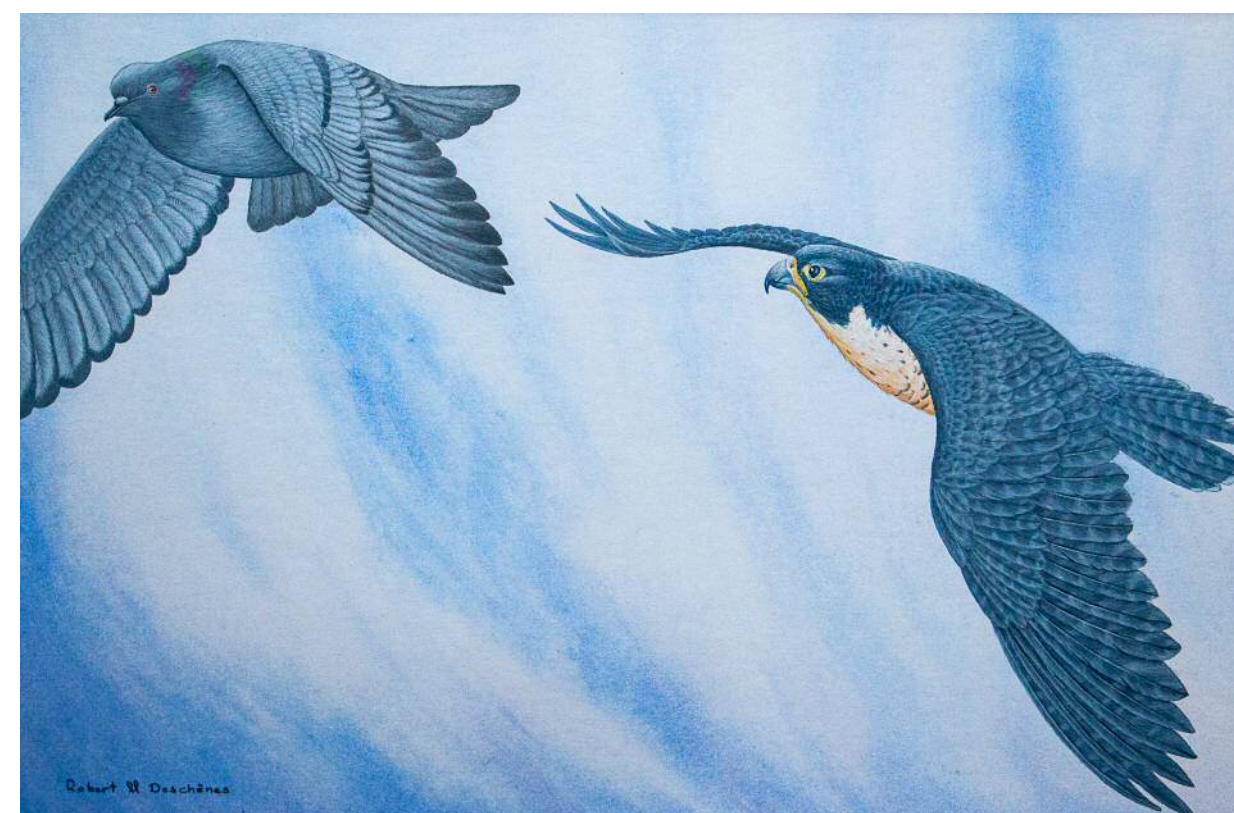
Faucon Pélerin et Pigeon Acrylique 16" x 24"