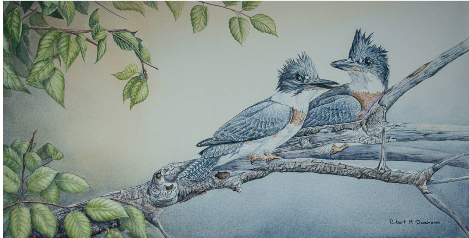
Martins Pêcheurs Juvéniles Aquarelle 28" x 14"