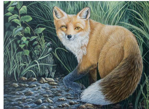
TITLE: RED FOX

INTO THE WILD 2022 INTERNATIONAL JURIED VISUAL ARTS COMPETITION