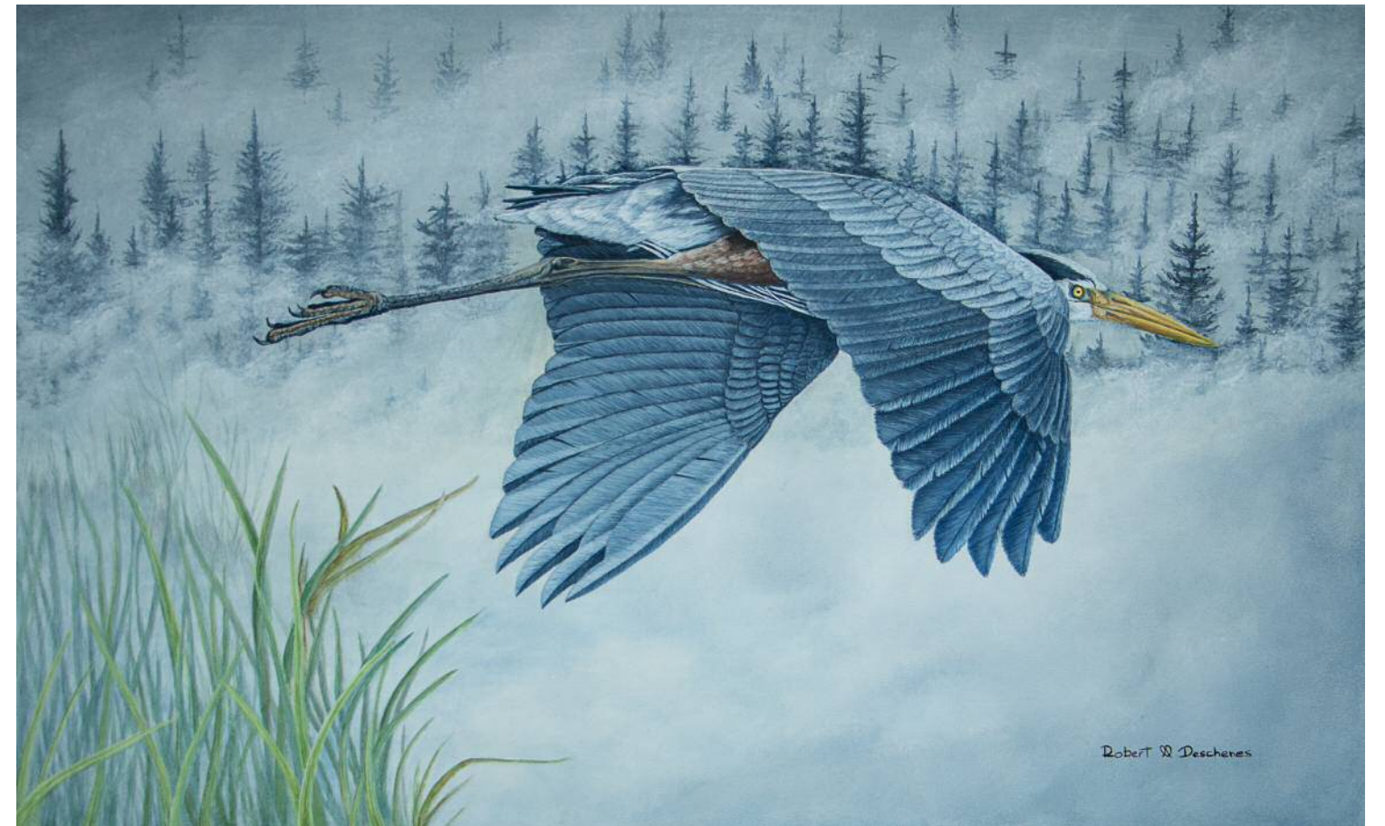
Grand Héron Acrylique 30" x 18"