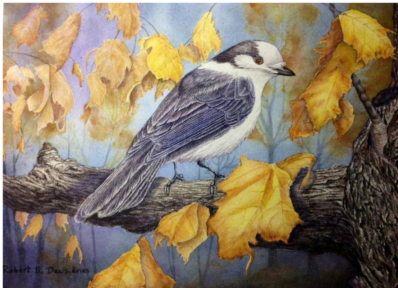
Geai du Canada Aquarelle 10,5" x 14,5"