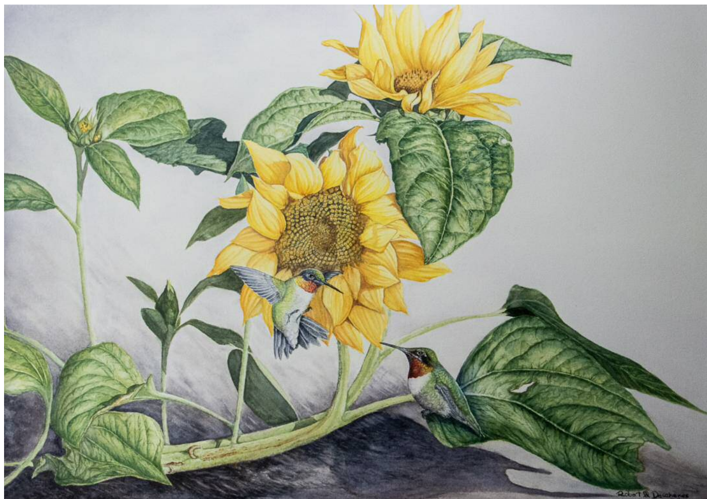
Colibris et Tournesols Aquarelle 20" x 28"