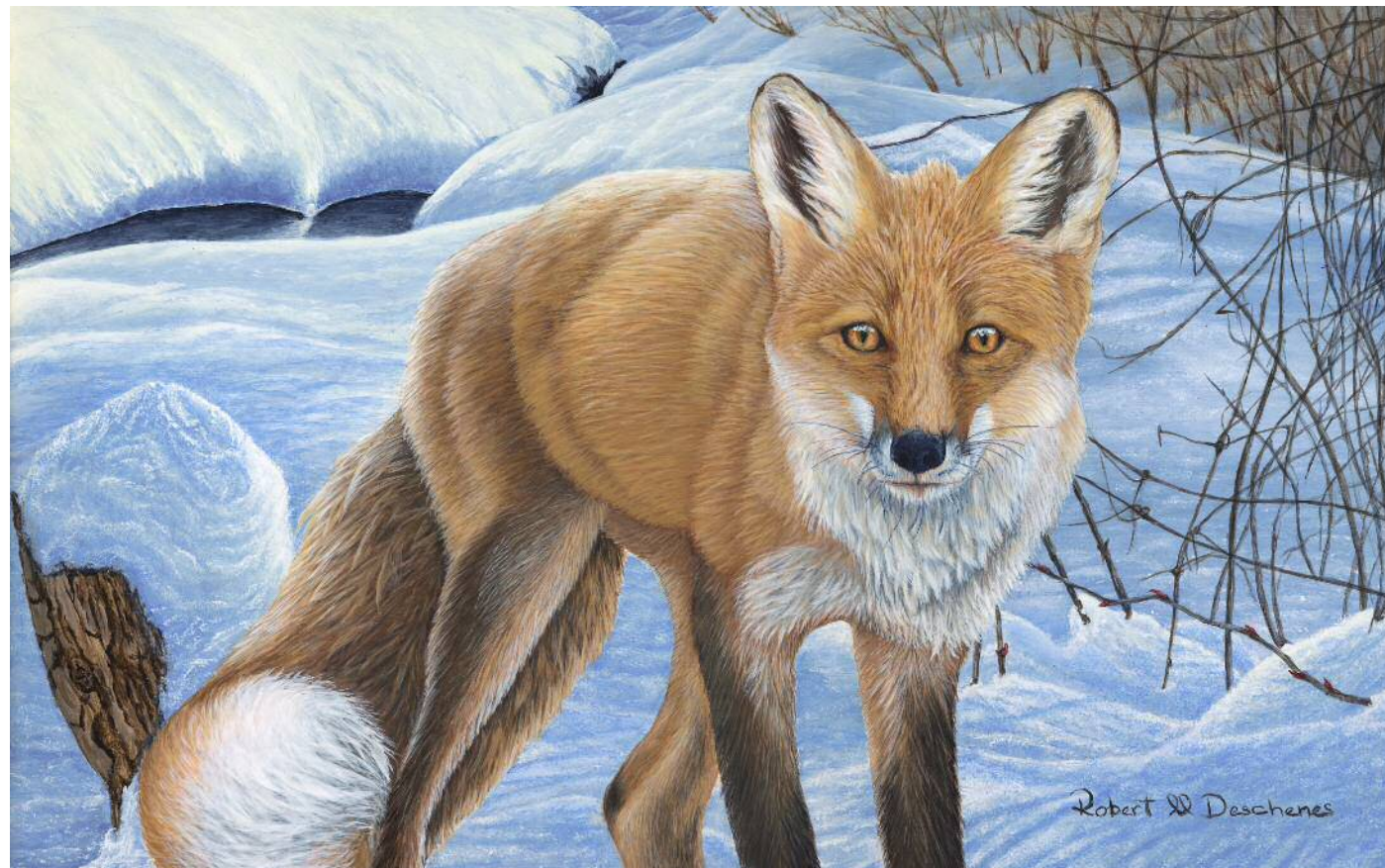
Renard Roux Acryllique 12,5" x 20"