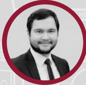
aęlayan etin ING İnovasyon Merkezi Eęitim Koordinatörü