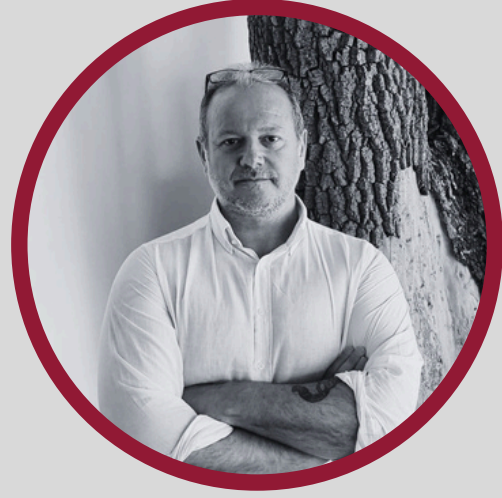
Av. Gürkan Akın EVG Attorney Partnership Ortaęı