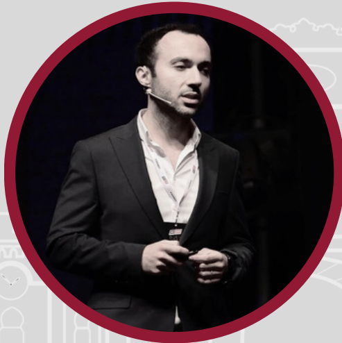
Av. Akif Çimen De Jure Kurucu Ortaęı