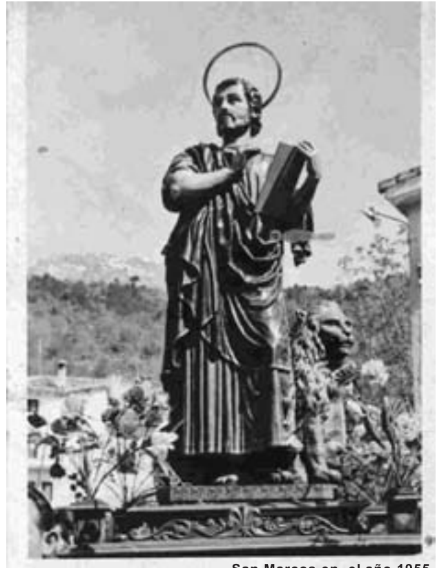
San Marcos en el año 1955.

Decimos que es nuestro Guía Espiritual. Yo no soy nadie para escribir de teología. De mi experiencia espiritual y de haber leído mucho el evangelio de S. Marcos, saco en conclusión la frescura, primavera y libertad de su doctrina. Empieza su Evangelio invitándonos a que cambiemos nuestro corazón, porque de él salen todas las maldades. Leer los capítulos 7 y 8 para que recordéis lo que dice o pone en boca de Cristo: "Este pueblo me honra con los labios, pero su corazón está lejos de mí." Que esta frase no se nos pueda ser aplicada. A pesar de que seamos y pensemos de forma diferente, tenemos que ayudarnos y queremos todos. Mi teología se basa siempre en el compañerismo y en el amor.