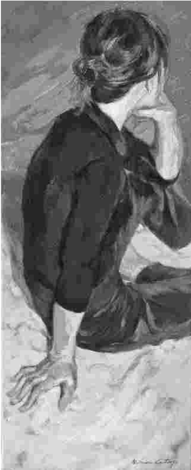
Ilustración: Mónica Castanys