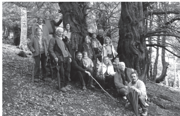
El grupo en la Tejada de Tosande.

una altitud de 1300 m. El recorrido es de 10 kilómetros, invirtiendo unas 3 o 4 horas y teniendo un desnivel de 500 m. La dificultad es escasa y si es un andador normal es fácil hacerla.