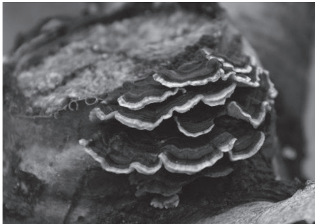
Árboles atacados por hongos.

de tiempo; los síntomas más notables serían escaso o nulo desarrollo, seca de ramas y hojas raquílicas.