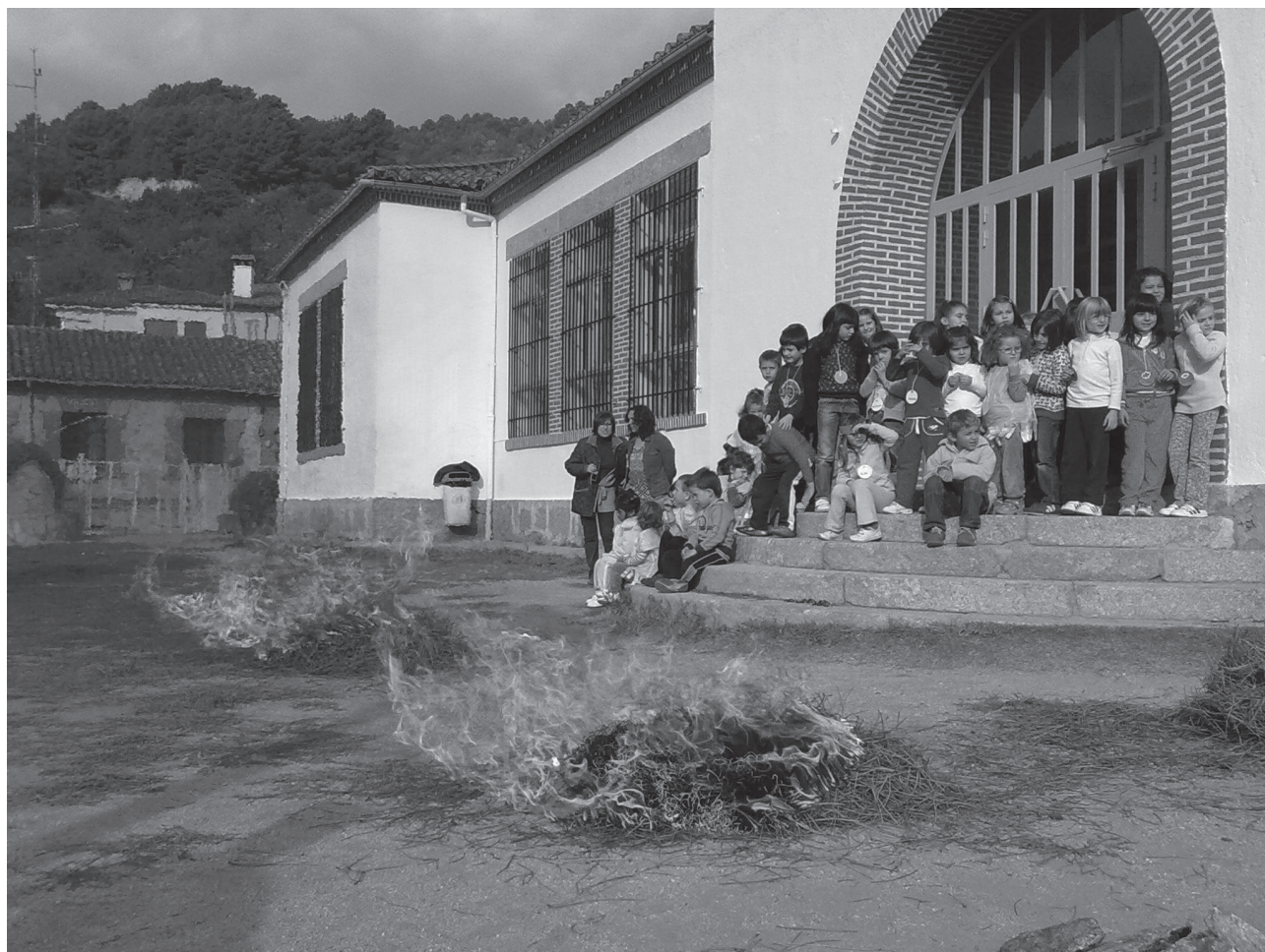
Los niños de 3 a 7 años de Guisando, El Arenal y El Hornillo.