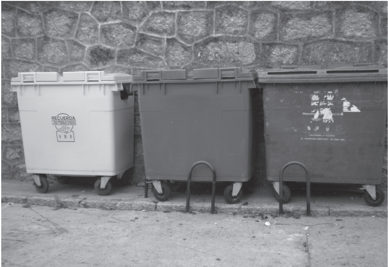
Contenedores de basura y de reciclaje.

Una figura que entró en vigor en nuestra Comunidad Autónoma es el de “Coto de Setas”, a través del Decreto 130/1999, de 17 de junio, por el que se ordenan y regulan los aprovechamientos micológicos en los montes ubicados en la Comunidad de Castilla-León (BOCyL nº 119 de 23/6/99).