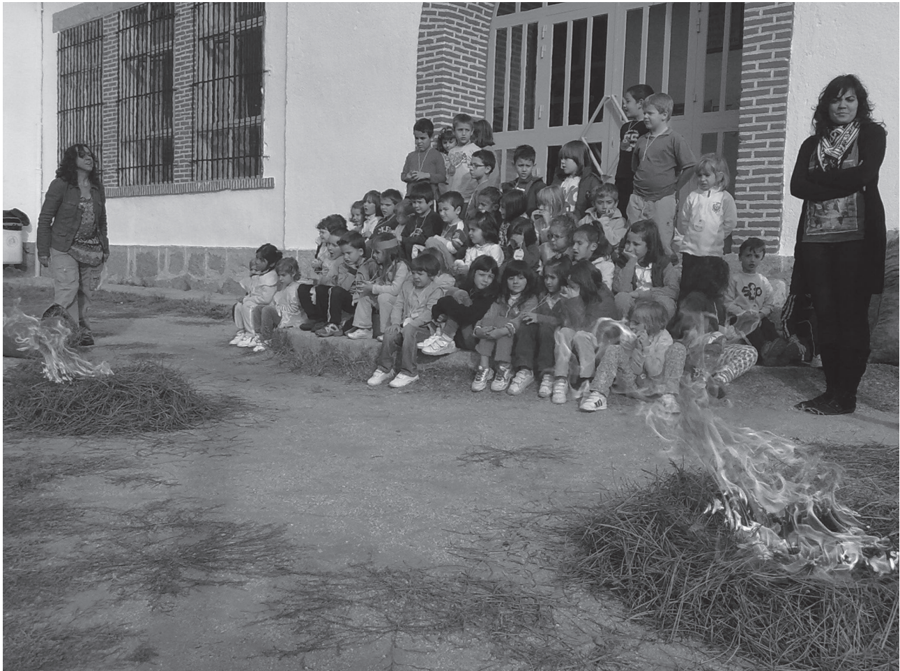
Los niños observan como se asan las castañas.