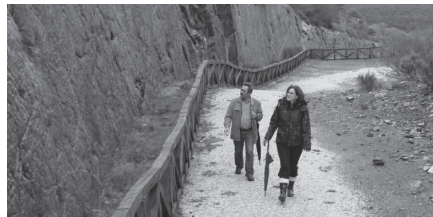
Senderistas recorriendo el Parque Natural.

Por estar de franja entre las regiones naturales atlántica y mediterránea le permite poseer una flora y fauna de gran riqueza. Junto a praderas conviven formaciones vegetales de gran singularidad como La Tejera de Tosande, una de las más notable de Europa, el “Pinar de Velilla” que es de los pocos pinares naturales existentes en España, el Enebral de Peñas Lampas y posee endemismos vegetales