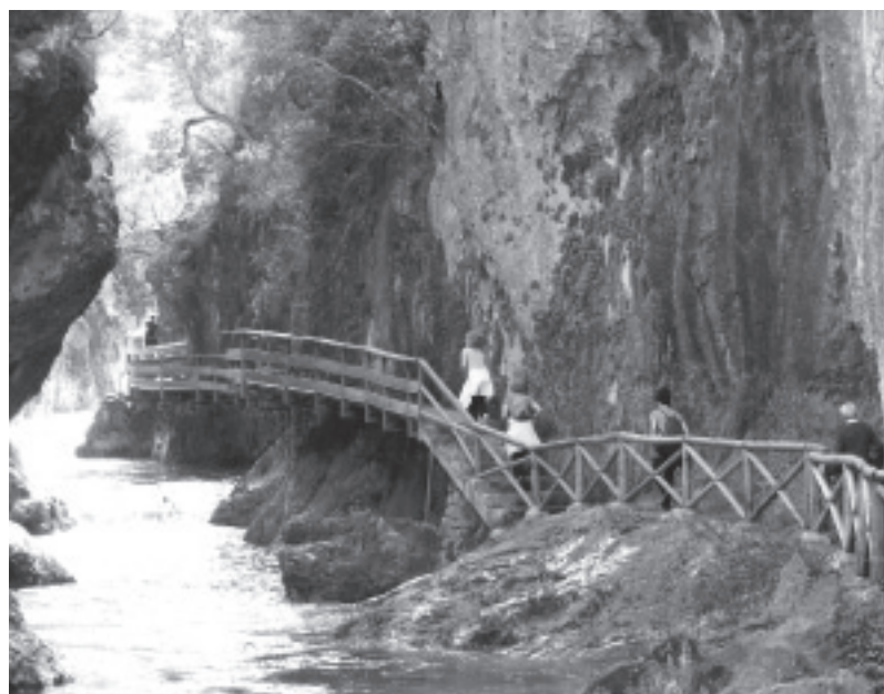
Ruta del Río Borosa.

Queremos mencionar que antes de iniciar la marcha hagamos una parada, como a unos diez kilómetros, en el Museo de Caza Centro de Interpretación Torre del Vinagre, antes de comenzar la marcha, para acercarse y por medio de la información que muestran sus paneles hacernos una idea de lo que podéis encontrar dentro de este inmenso mosaico de ecosistemas de aprox. 214.336 hectáreas que ofrecen a visitante una visión general de la naturaleza de las sierras que componen el Parque Natural.