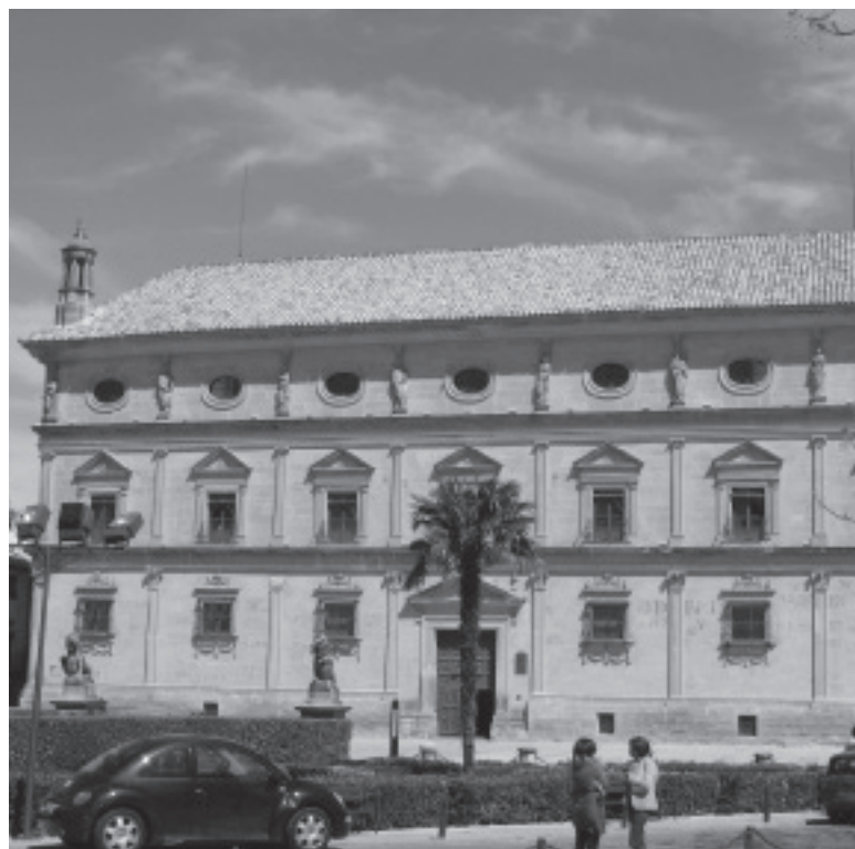
Palacio del Deán Ortega.