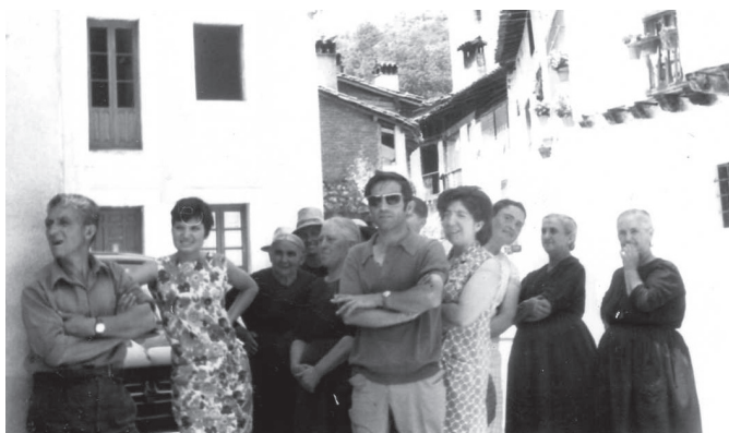
Vecinos viendo el paso de una boda.