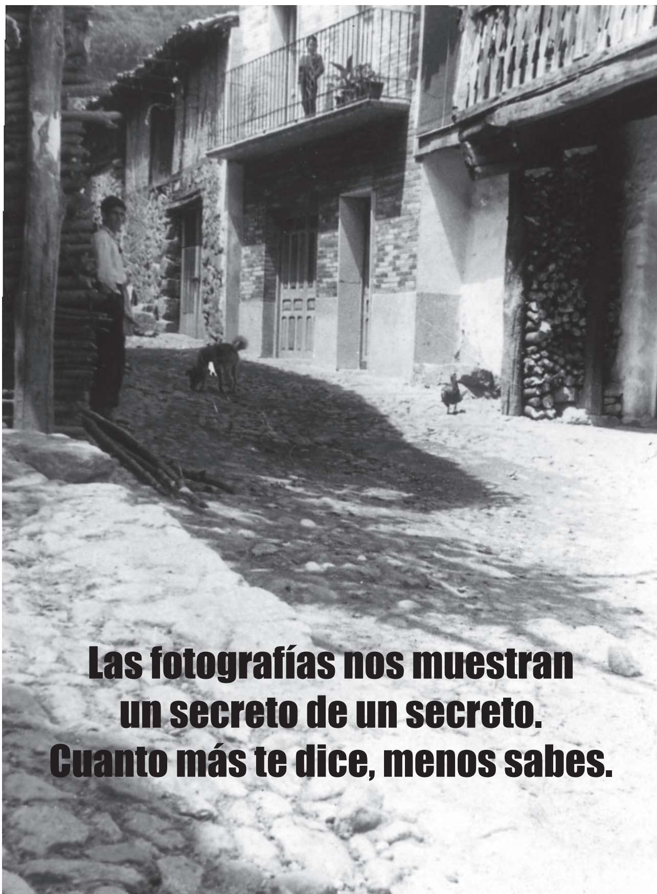
Barrio Abajo. Año 1956

Las fotografías nos muestran un secreto de un secreto. Cuanto más te dice, menos sabes.