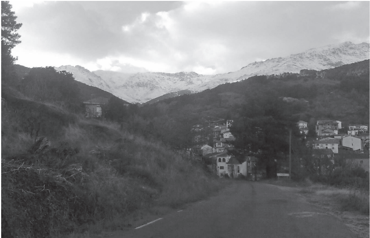
Vista de El Hornillo con la sierra nevada.

época de alto riesgo de incendios forestales desde el 1 de julio hasta el 30 de septiembre, pudiéndose prolongar según la climatología. Esta orden detalla una serie de prohibiciones, entre las que resalto las siguientes: la utilización de maquinaria y equipos en los montes y en áreas rústicas situadas en una franja de 400 metros alrededor de aquellos cuyo funcionamiento genere fuego, deflagración, chispas o descargas eléctricas. También prohíbe el uso de asadores, barbacoas, hornillos o cualquier otro elemento que pueda causar fuego en el monte.