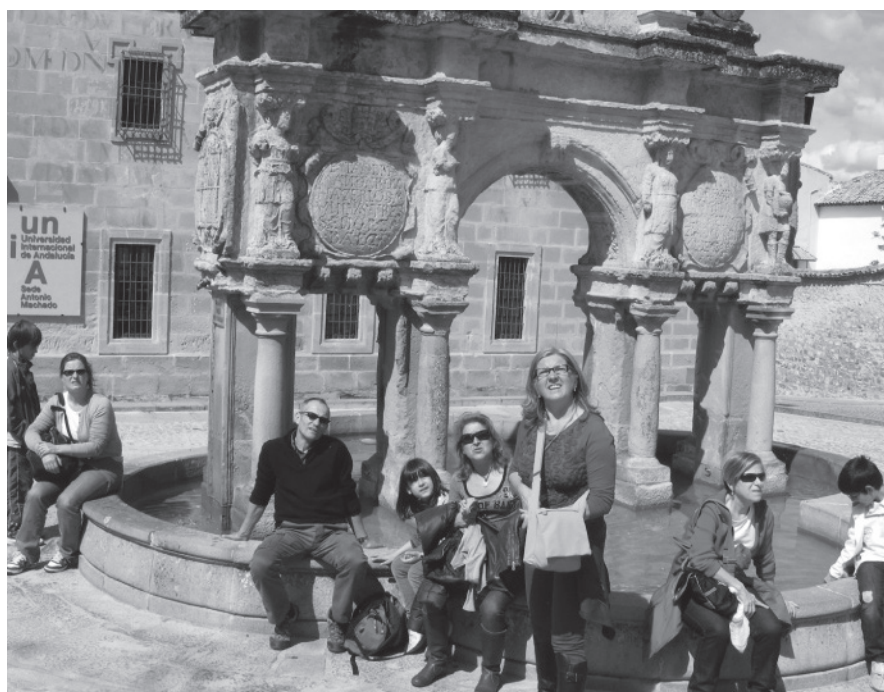
Grupo en la Fuente de Sta. María-Baeza

Destaca por ser una de las ciudades más bellas del Renacimiento español, goza de un casco histórico de trazado árabe una mezcla de castellano-andaluz. Su recorrido es recomendable hacerlo en compañía de una guía (las agencias están en la Plaza del Populo, lugar de comienzo de las visitas guiadas a ser posible local o de la zona). Nos llevará en su recorrido por múltiples plazas monumentales como la Plaza de los Leones que comprende las carnicerías, Audiencia civil, arco de Villalar y Puerta de Jaén o la plaza de Sta. María, centro y seña de identidad de la ciudad, con la fuente del mismo nombre, seminario de San Felipe Neri, Casas Consistoriales y la Santa Iglesia Catedral (curiosamente decir que es la catedral más antigua de Andalucía). Seguiremos por el Paseo de las Muralla donde se aprecia unas privilegiadas vistas del valle del Guadalquivir pasando por callejuelas angostas y llenas de tipismo como la calle Alta escenario del