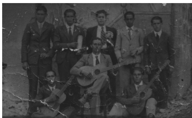
Quintos del año 1945.