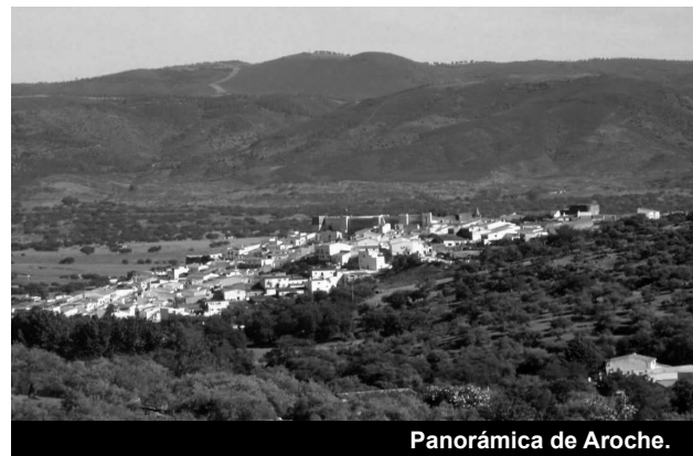
Panorámica de Aroche.

Declarado conjunto histórico en 1980. Sobresaliendo como elementos más singulares su castillo islámico (siglo XI, principios del XII), la iglesia de Ntra. Señora de la Asunción (1483. Intervienen en su construcción varios maestros provenientes de la catedral de Sevilla), su museo arqueológico, la muralla artillera del siglo XVII y numerosas casas señoriales que la convierten al pasear por sus calles en todo un espectáculo cultural. Nuestra programación del viaje contemplaba en este municipio; por la mañana, ruta de senderismo (Las Canteras del Mármol); y por la tarde, visita guiada por el conjunto monumental.