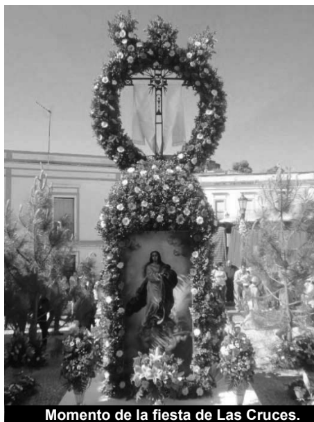
Momento de la fiesta de Las Cruces.

Fiestas que están declaradas de Interés Etnológico e incluidas en el Catálogo de Bienes Patrimoniales de Andalucía. Manifestación cultural compuesta por unos ritos ancestrales. De fondo se trasluce una rivalidad entre dos hermandades, el Llano y la