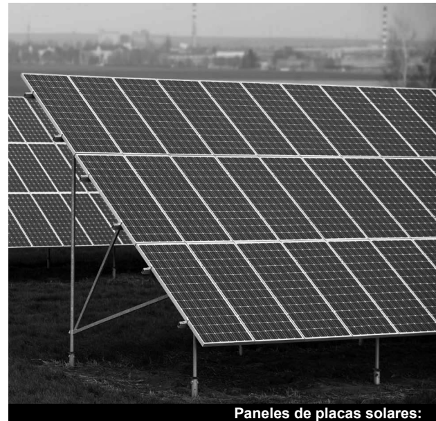
Paneles de placas solares:

-Energía solar. Es la energía del sol que se recoge mediante paneles y se transforma en energía térmica (para obtener agua caliente para hogares, calefacciones, etc.), o en energía lumínica o eléctrica. Todos sabemos que el sol es el rey de casi toda nuestra geografía nacional.