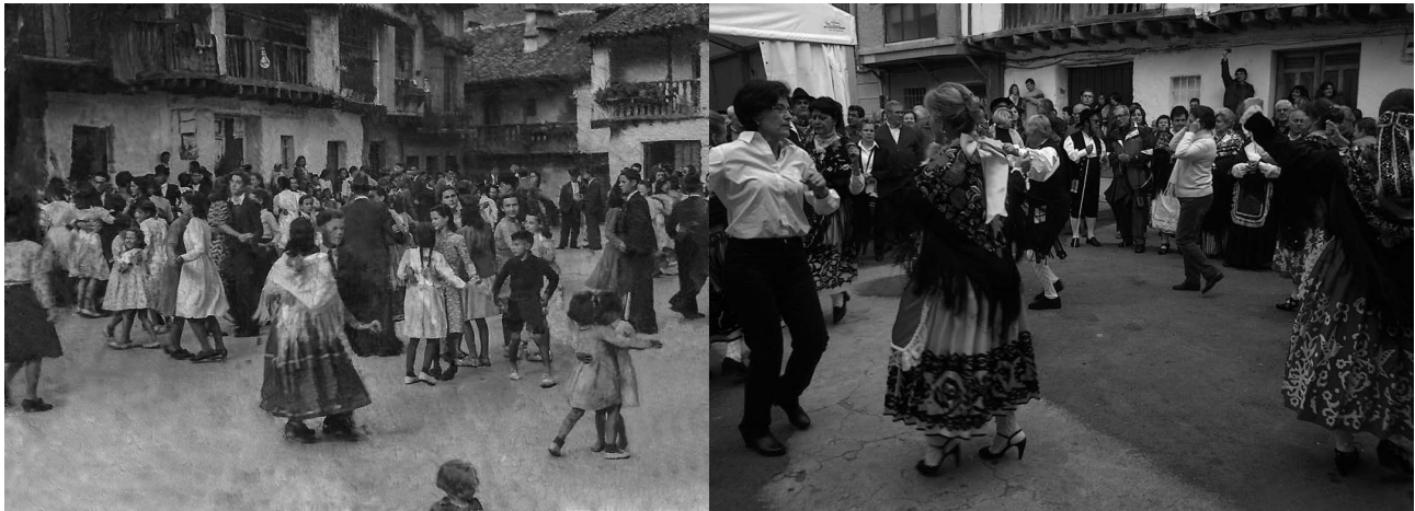
Baile en la plaza. Años 50.