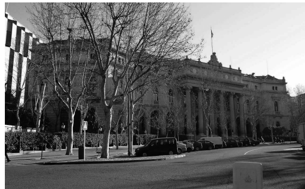
Fachada del edificio de la Bolsa de Madrid.

La mayoría de nuestros políticos instalados en el sistema están impregnados del credo del capitalismo salvaje cuyos postulados son los siguientes: la solución del mercado es siempre preferible a la regulación y la intervención del Estado; es normal y aconsejables que actividades como la atención médica y la educación