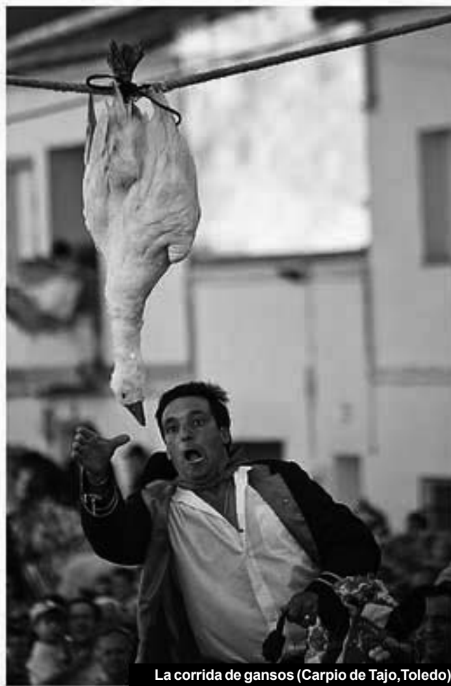
La corrida de gansos (Carpio de Tajo, Toledo)

— ¿Pero por qué tienen que mantenerse unas tradiciones y otras no? ¿Acaso se corren los gallos en la actualidad? Además, digo yo: ¿por qué no se toca el Himno Nacional en las escuelas, como se hacía antes; o al empezar