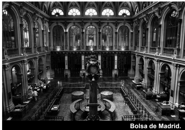
Bolsa de Madrid.

En las emisoras estatales de radio, hay más pluralismo. Una de las más extremistas es la COPE, donde la Conferencia Episcopal detenta el 50% de las acciones, seguida de Íntereconomía. En cuanto a los canales de televisión en abierto, tampoco hay mucho donde elegir. La TVE,