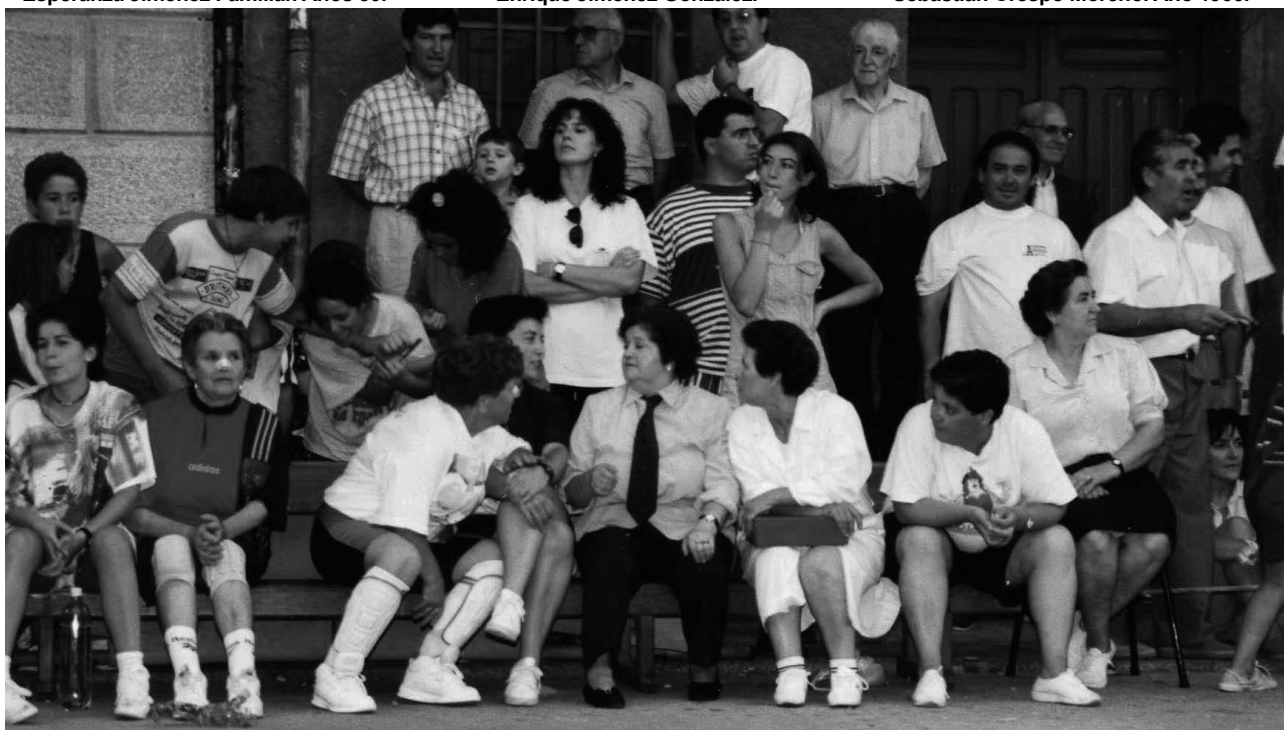
Equipo fútbol de la Asociación de Mujeres Río Cantos. Agosto 1995.