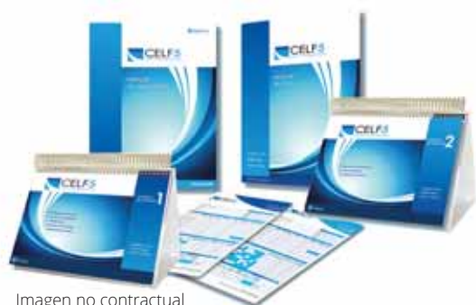
Imagen no contractual