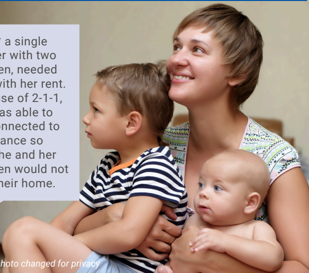
*name and photo changed for privacy