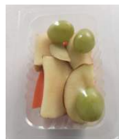
120 g Wild Mix