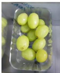
120 g Wild Grapes