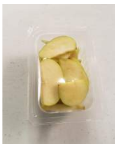
120 g Wild Apples