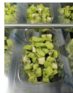
120 g Wild Kiwis