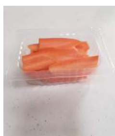
120 g Wild Carrots