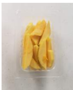
120 g Wild Mangos