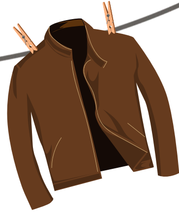
Veste en cuir/daim portée 1 an