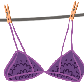
Soutien-gorge porté 7 fois