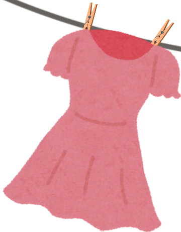
Robe portée 4 à 6 fois