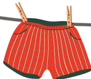
Sous-vêtements portés 1 fois