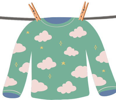
Pyjama porté 1 semaine