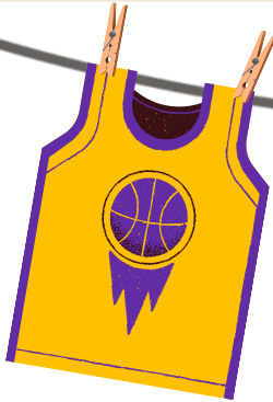
Vêtement de sport porté 1 à 3 fois