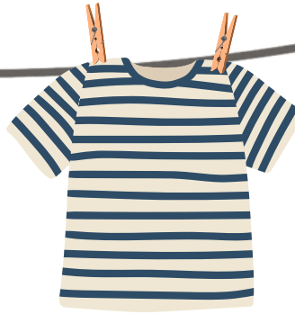
Top en coton porté 4 à 5 fois