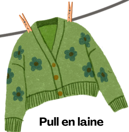
Pull en laine porté 10 à 15 fois