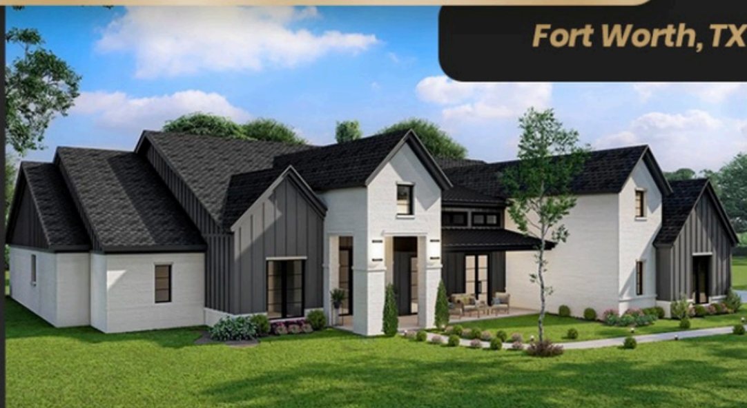
Fort Worth, TX