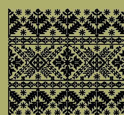
Artesanías y diseños