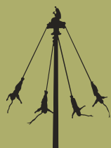
Festividades y ritualidades