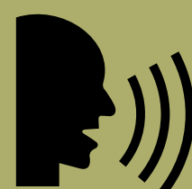
Literatura y lengua