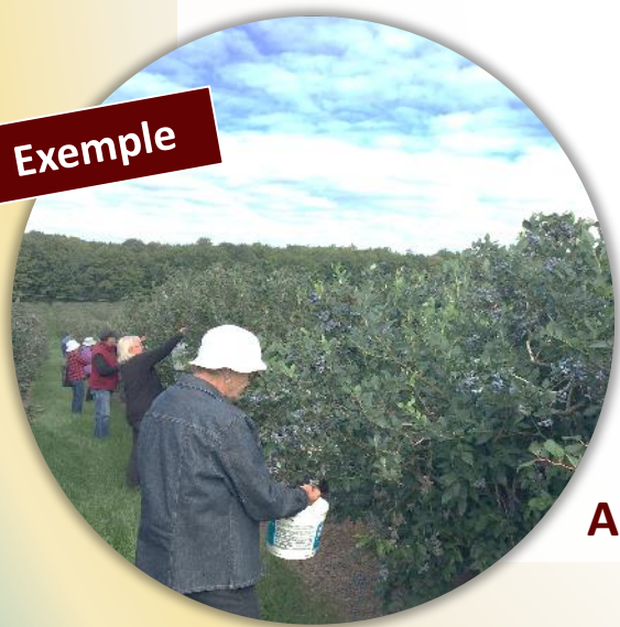
Activité de glanage

Dates variables selon les aliments reçus