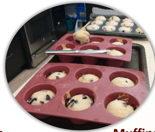
Muffins santé pour nos petits déjeuners!