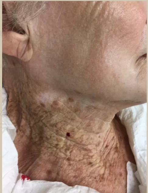
Mulher de 92 anos que usou protetor solar no rosto, mas não no pescoço

Mesmo com inúmeras campanhas, muitos, até hoje acham que o uso do protetor solar não faz diferença. Na imagem ao lado é possível mostrar sua relevância. >>>