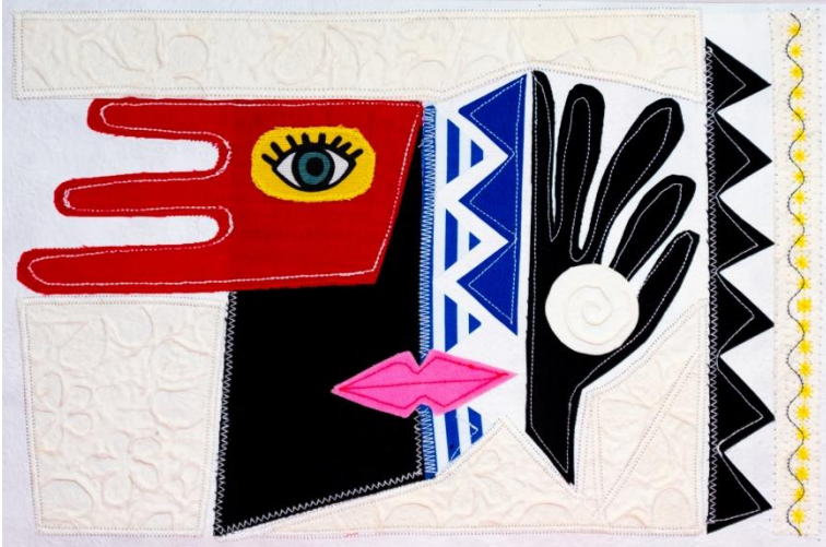
FLECHADO AL SOL Collage Papel gofrado, textil, hilo 50 x 40 cm (con paspartú) 2024 $ 200.000