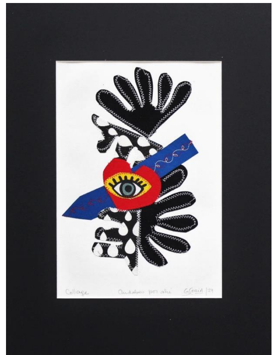
ANDABAS POR AHI Collage Papel gofrado, textil, hilo 40 X 30 cm (con paspartú) 2024 $ 160.000