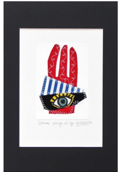
DONDE PONGO EL OJO Collage Papel gofrado, textil, hilo 30 X 20 cm (con paspartú) 2024 $ 100.000