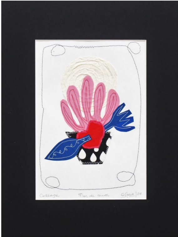
FLOR DE AMOR Collage Papel gofrado, textil, hilo 40 X 30 cm (con paspartú) 2024 $ 160.000