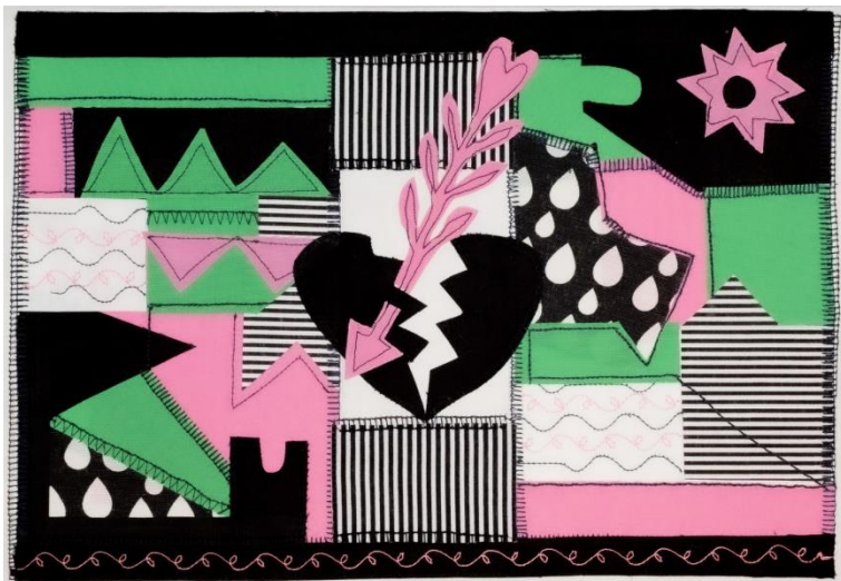
FLECHADO Collage Papel gofrado, textil, hilo 50 x 40 cm (con paspartú) 2024 $ 200.000