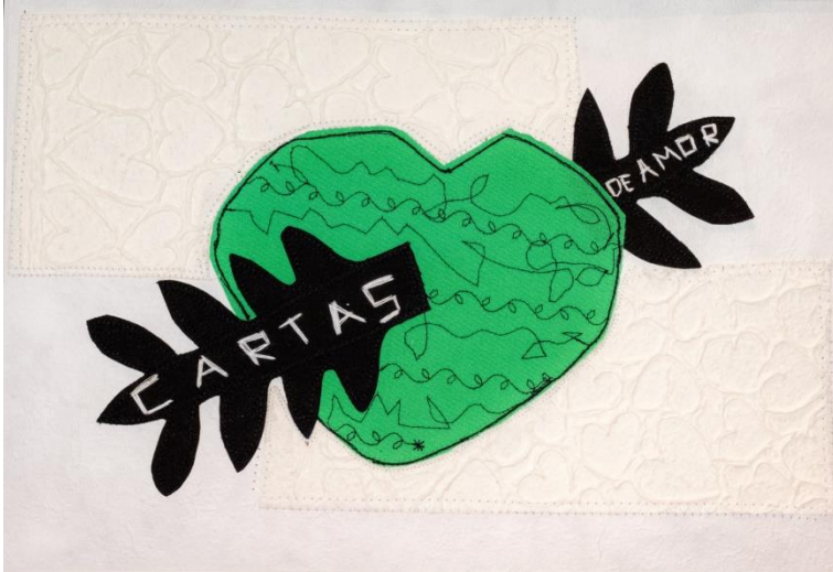
CARTAS DE AMOR Collage Papel gofrado, textil, hilo 50 x 40 cm (con paspartú) 2024 $ 200.000