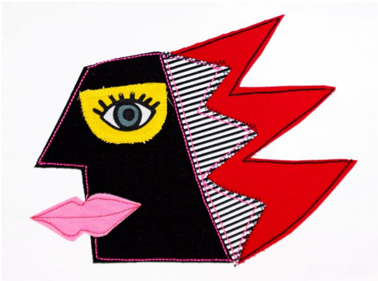
UNO DE NOSOTROS I Collage Papel gofrado, textil, hilo 40 x 30 cm (con paspartú) 2024 $ 160.000