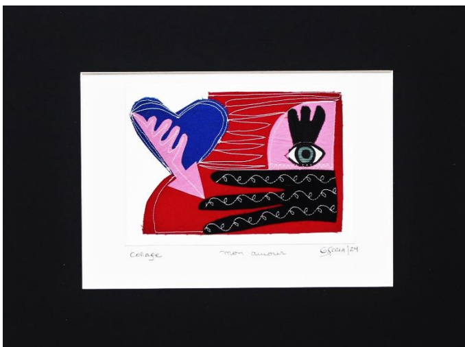
MON AMOUR Collage Papel gofrado, textil, hilo 40 X 30 cm (con paspartú) 2024 $ 160.000