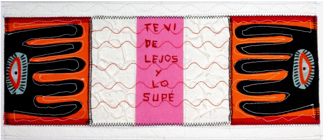
MARGARITAS SOBRE EL MANTEL Collage Papel gofrado, textil, hilo 50 x 40 cm (con paspartú) 2024 $ 200.000