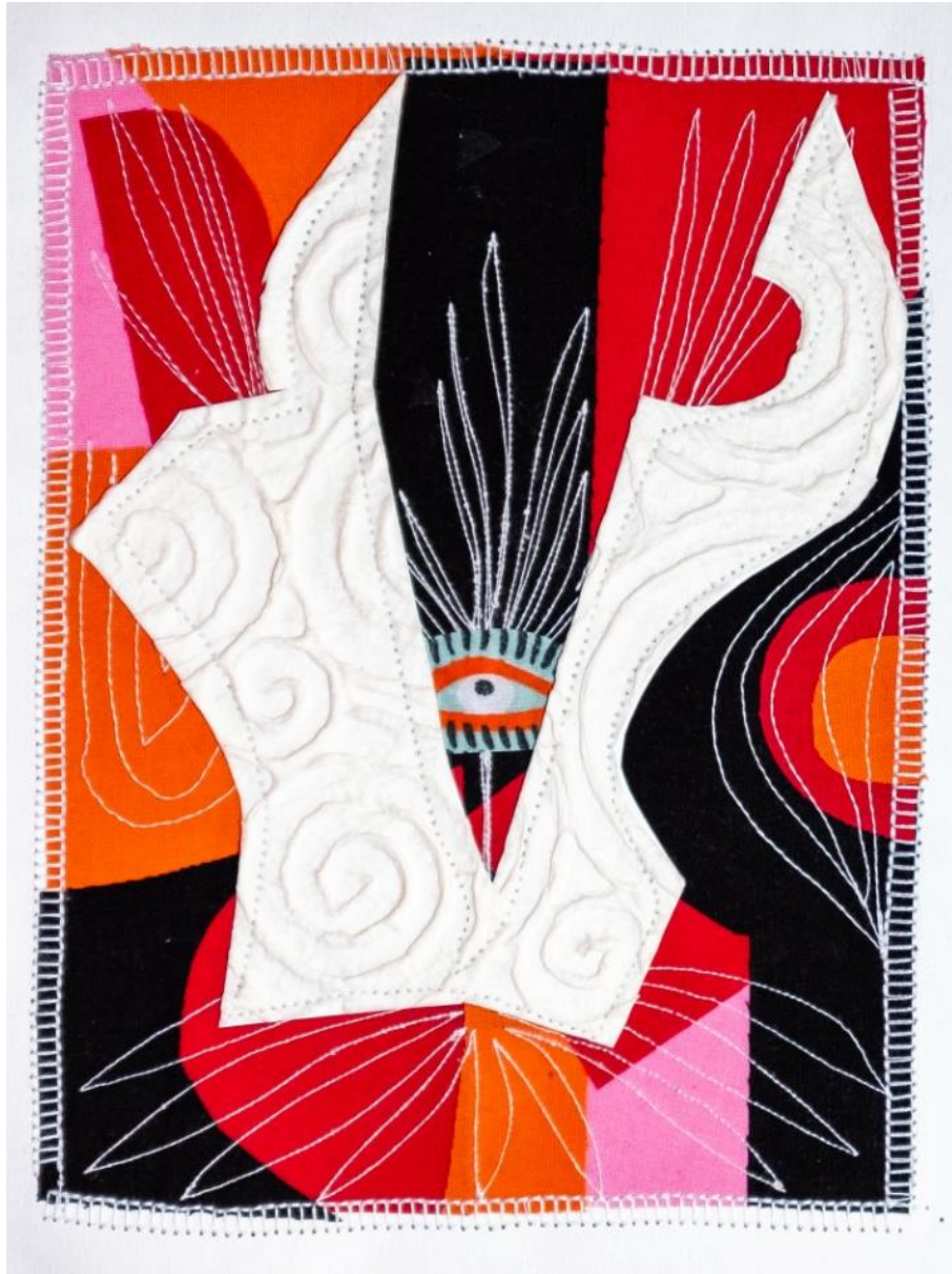
SALIENDO DE MI Collage Papel gofrado, textil, hilo 40 X 30 cm (con paspartú) 2024 $ 160.000