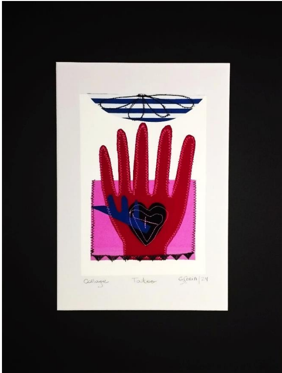
TATOO Collage Papel gofrado, textil, hilo 40 x 30 cm (con paspartú) 2024 $ 160.000