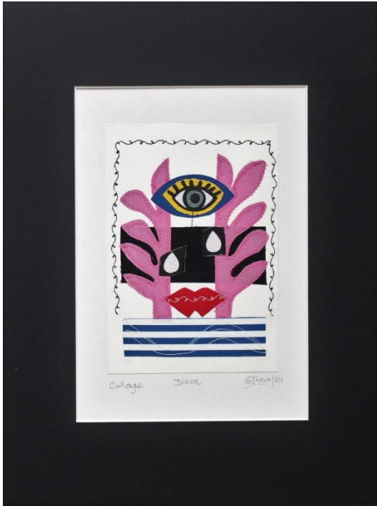
DIOSA Collage Papel gofrado, textil, hilo 40 X 30 cm (con paspartú) 2024 $ 160.000