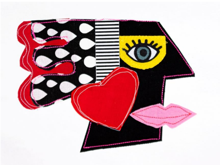
UNO DE NOSOTROS II Collage Papel gofrado, textil, hilo 40 x 30 cm (con paspartú) 2024 $ 160.000