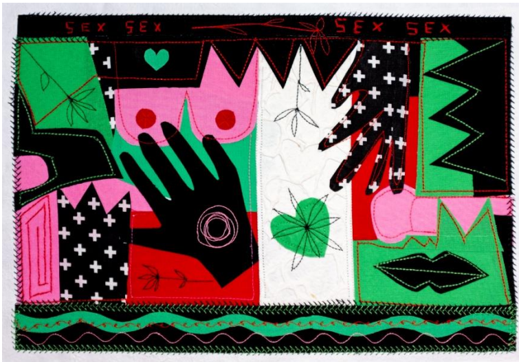
SEX & ROCK AND ROLL Collage Papel gofrado, textil, hilo 50 x 40 cm (con paspartú) 2024 $ 200.000