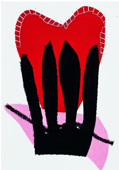
UN AMOR ESCONDÍ Collage Papel gofrado, textil, hilo 30 X 40 cm (con paspartú) 2024 $ 100.000