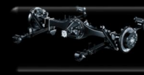
Suspensión trasera con ballestas