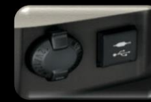
Conector de 110V