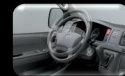
Ajuste del volante