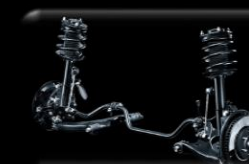
Suspensión Delantera McPherson + Barra estabilizadora