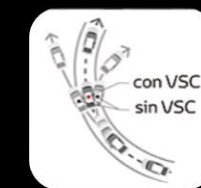
Control de estabilidad del vehículo VSC