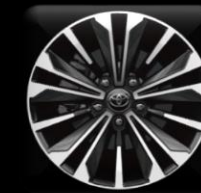
Rines de aleación de 17"