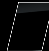
Negro mica (209)