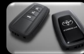
Control de entrada inteligente