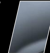
Gris azulado (1K3)