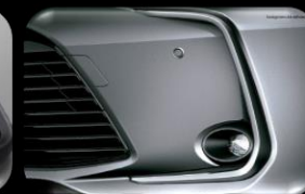
Luces anti-neblina LED