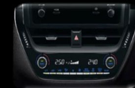
Aire acondicionado Bi-zona