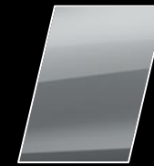
Plata Metalizado (1E7)