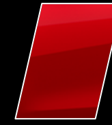
Rojo Mica Metálico (3R3)