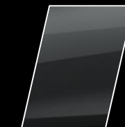
Gris Metálico (1G3)

Toyota de Venezuela, C.A se reserva el derecho de efectuar cambios sobre los materiales, equipos y especificaciones de sus vehículos sin previo aviso ni ninguna otra obligación. Las imágenes que se puedan mostrar son estrictamente referenciales.