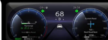
Pantalla multifuncional 12.3"