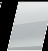
Super Blanco II (040)