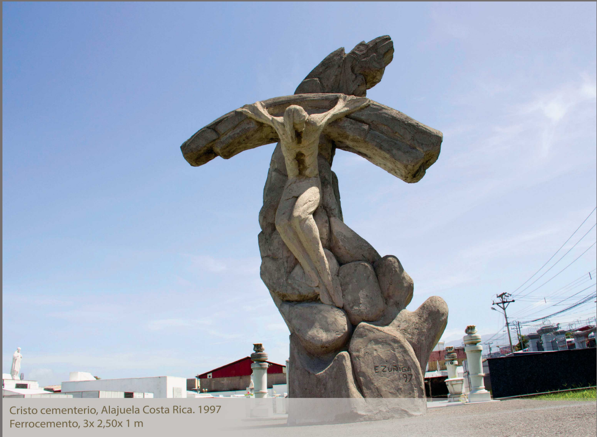
Cristo cementerio, Alajuela Costa Rica. 1997 Ferrocimiento, 3x 2,50x 1 m