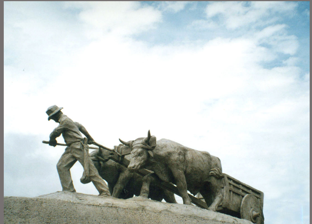
Monumento al Boyero, San Ramón- Costa Rica. 2002 Ferrocimiento, 5x 1,90x 1,80 m