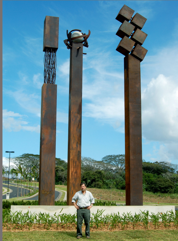
Monumento Cosmos Tecnología y Vida. Alajuela - Costa Rica, 2008 Acero cortén, Dimensiones 9 x 10 x 60 m