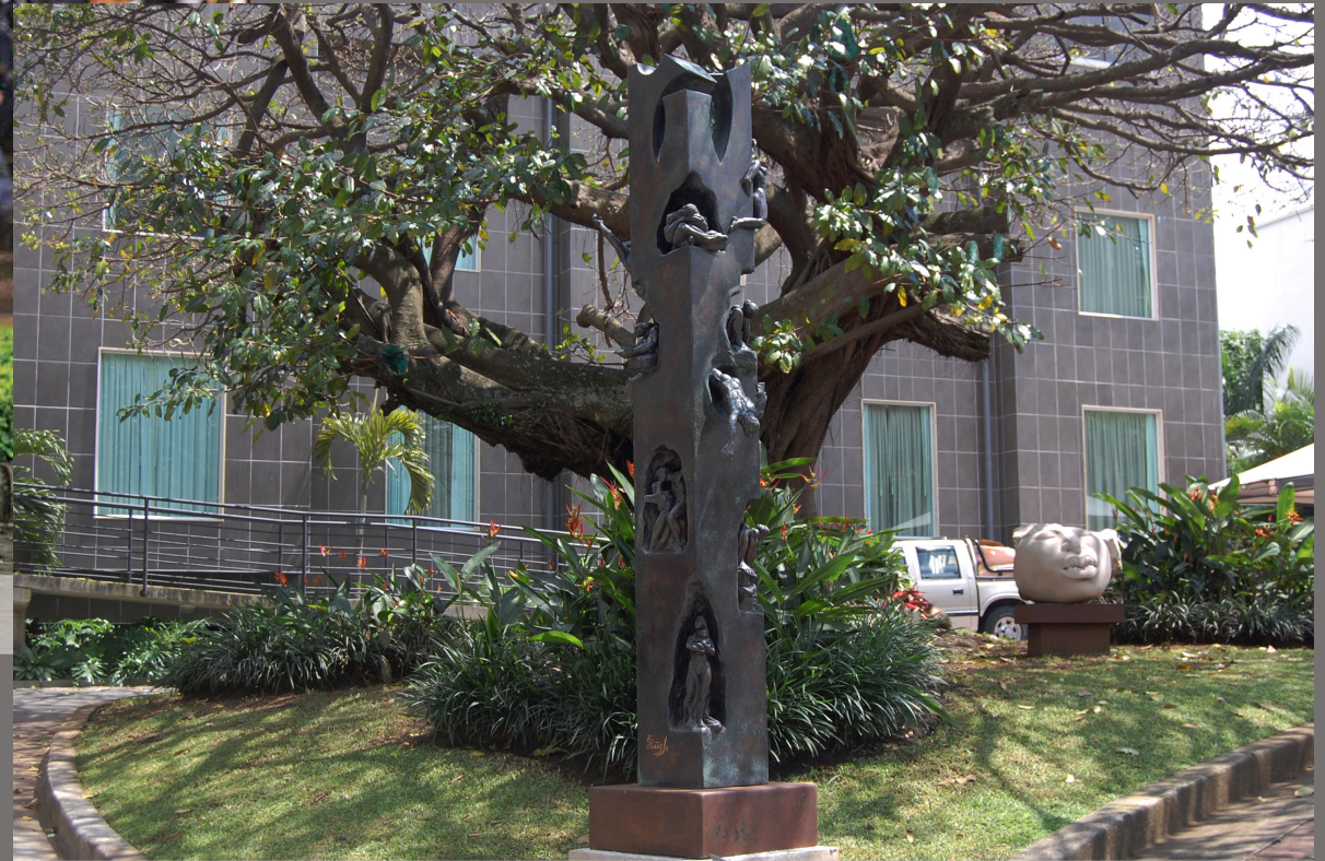
Columna de la Vida y la Muerte San José - Costa Rica, 2008 Acero corten - yeso, Dimensiones 250 x 66 x 66 cm