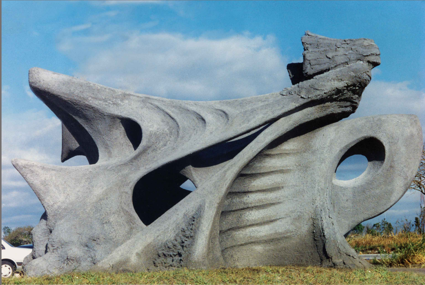
Éxtasis, San Antonio de Belén-Costa Rica, 1995 Ferrocemento, 5x 2,80x 2m