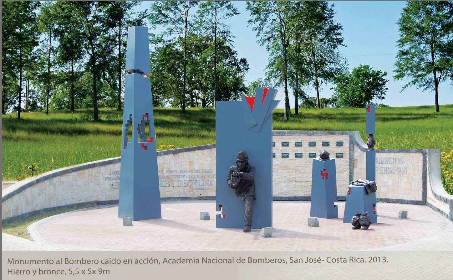
Monumento al Bombero caído en acción, Academia Nacional de Bomberos, San José- Costa Rica. 2013. Hierro y bronce, 5,5 x 5x 9m