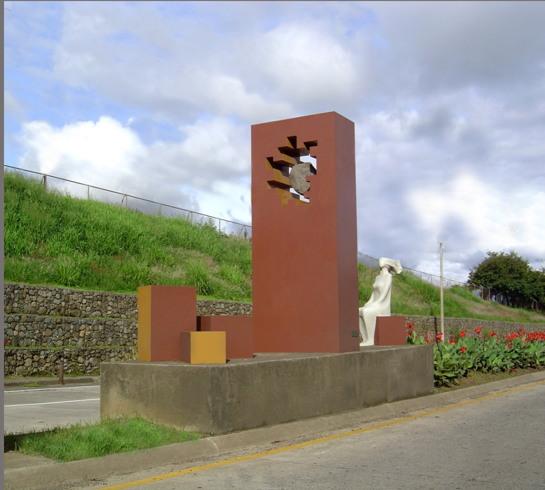
Civilización y vida 2001 Hierro, piedra y ferrocemento Alajuela- Costa Rica 600 cm x 300 cm x 140 cm