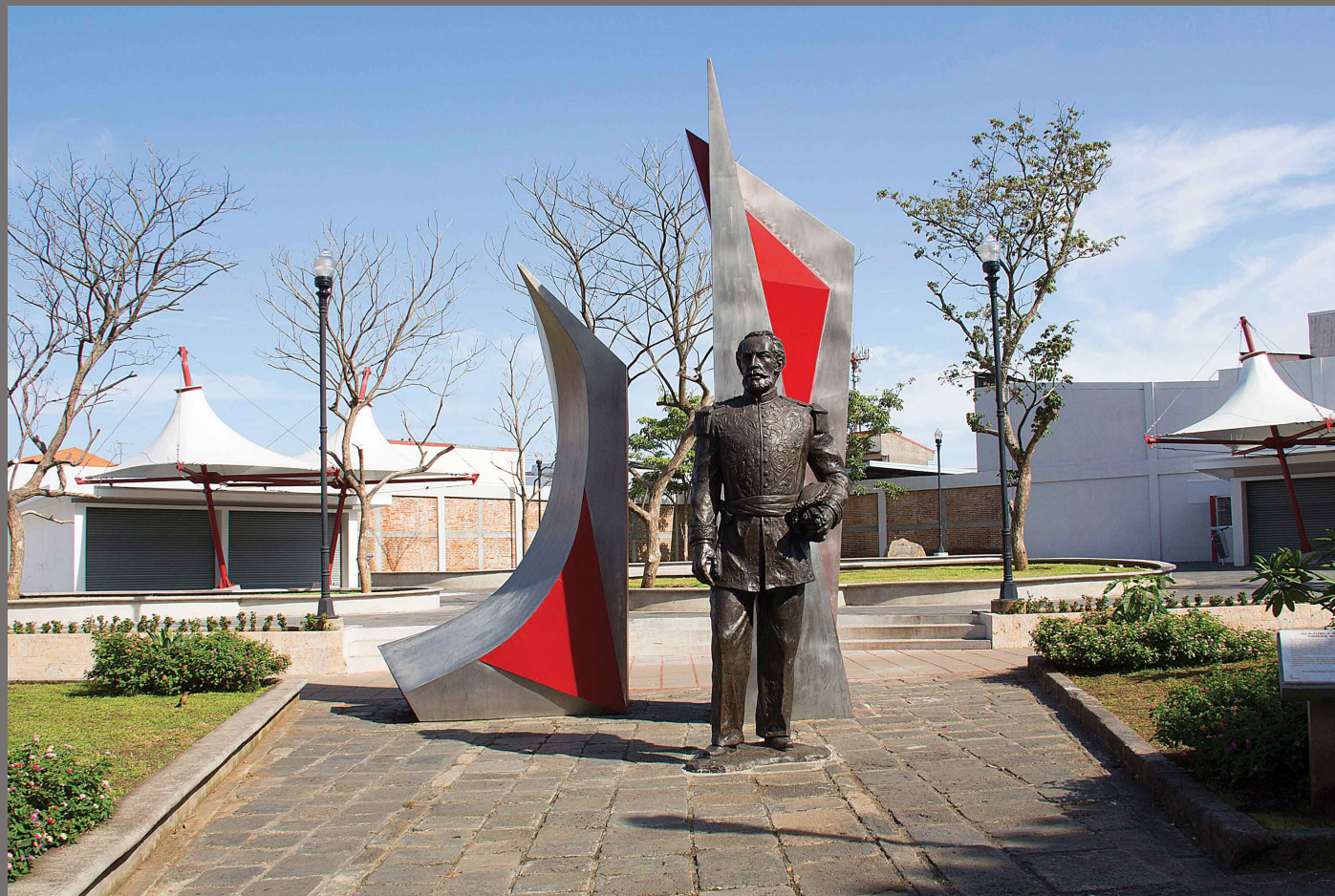
Monumento al Ex Presidente Tomas Guardia, Alajuela- Costa Rica, 2013 Bronce y acero inoxidable, 6x 4x 3 m