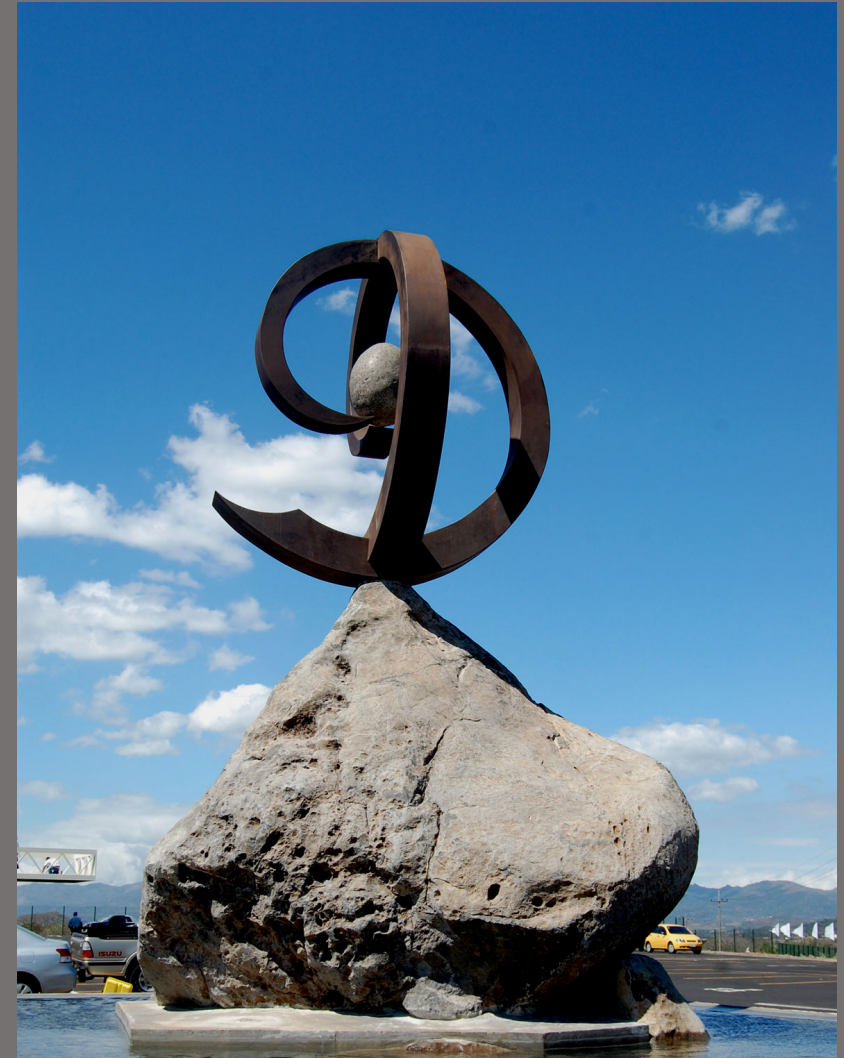
Monumento Construyendo el Futuro Alajuela - Costa Rica, 2010 Acero corten forjado y piedra virgen, Dimensiones 7 x 2,5 x 2,5 m