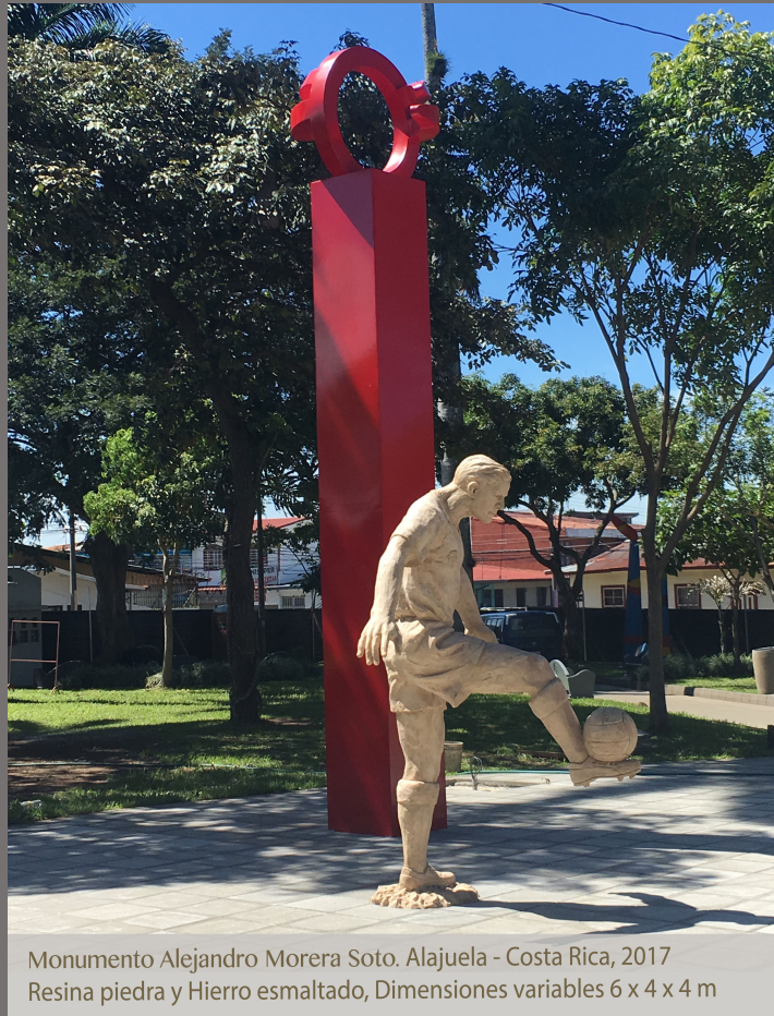
Monumento Alejandro Morera Soto. Alajuela - Costa Rica, 2017 Resina piedra y Hierro esmaltado, Dimensiones variables 6 x 4 x 4 m