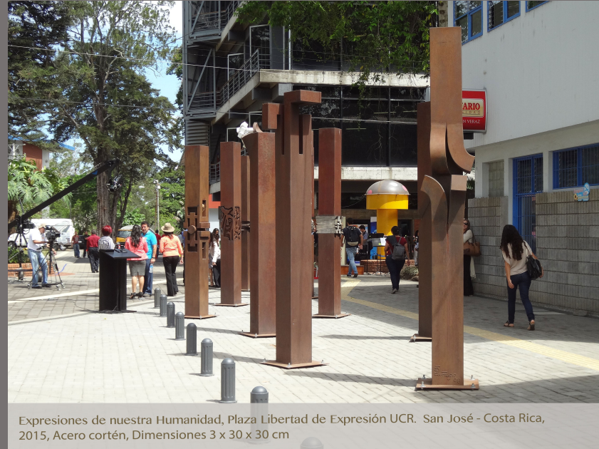
Expresiones de nuestra Humanidad, Plaza Libertad de Expresión UCR. San José - Costa Rica, 2015, Acero cortén, Dimensiones 3 x 30 x 30 cm