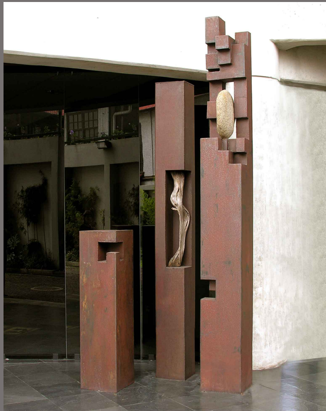
Homenaje a los Ancestros, Banco BCIE San José, Costa Rica 2004. Hierro forjado, piedra y madera. Dimensiones variables