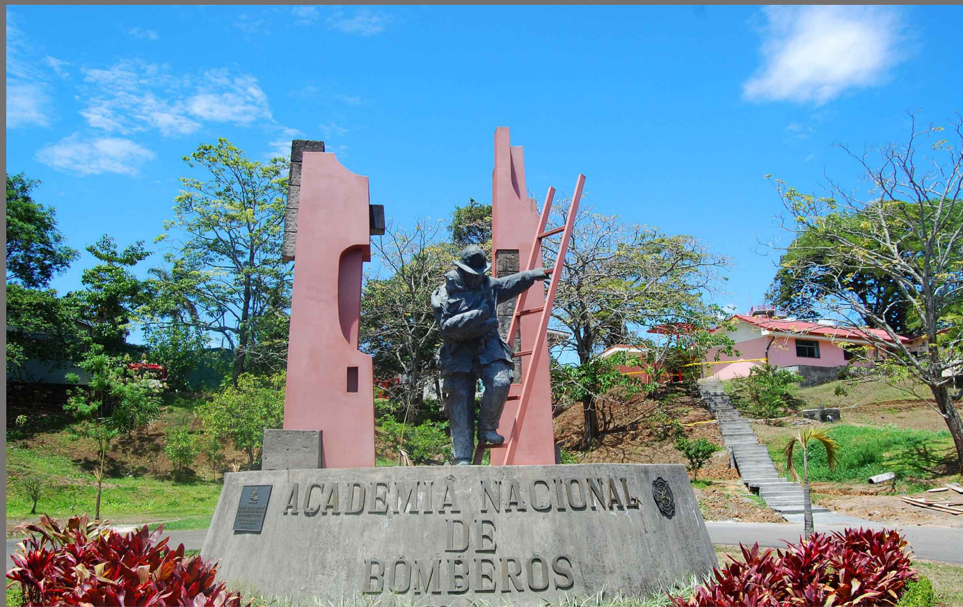
Monumento Academia Nacional de Bomberos, San José- Costa Rica, 2002 Bronce, hierro, ferrocemento, 5,60x 6x 5m