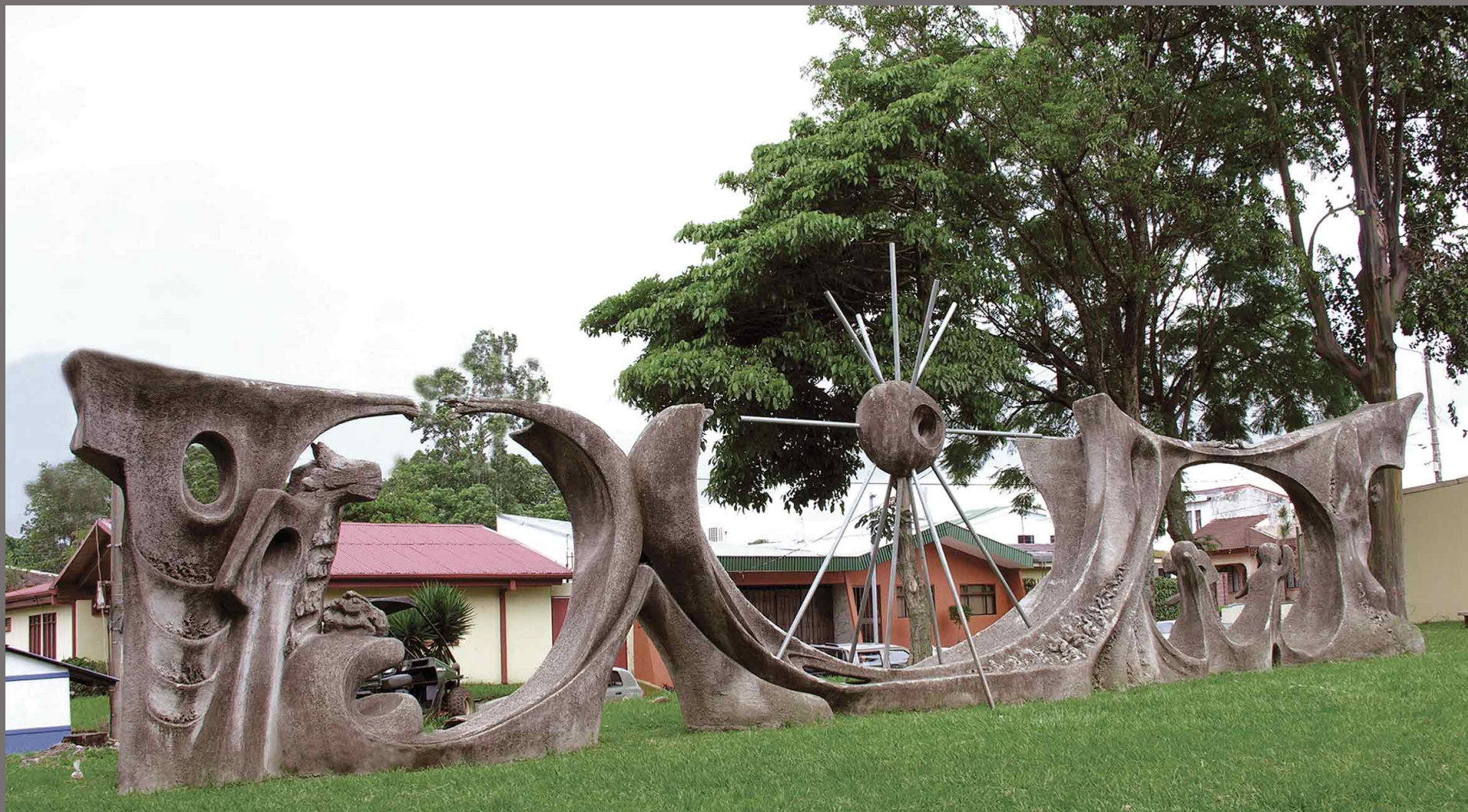
Vientos de esperanza, Rohrmoser-Costa Rica. 1993