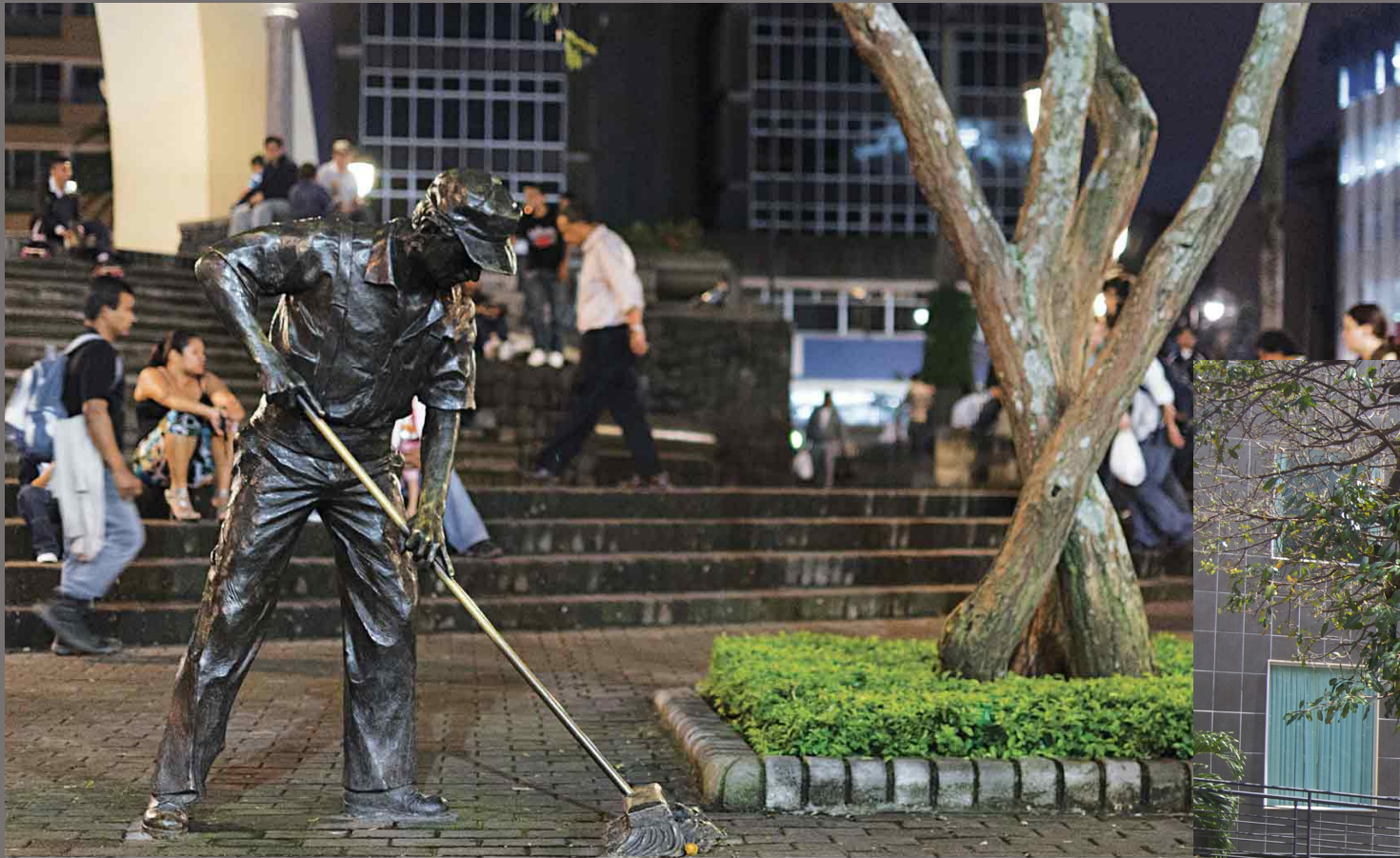
Monumento al Barrendero, Parque Central San José-Costa Rica Bronce, 175x 130x 80 cm