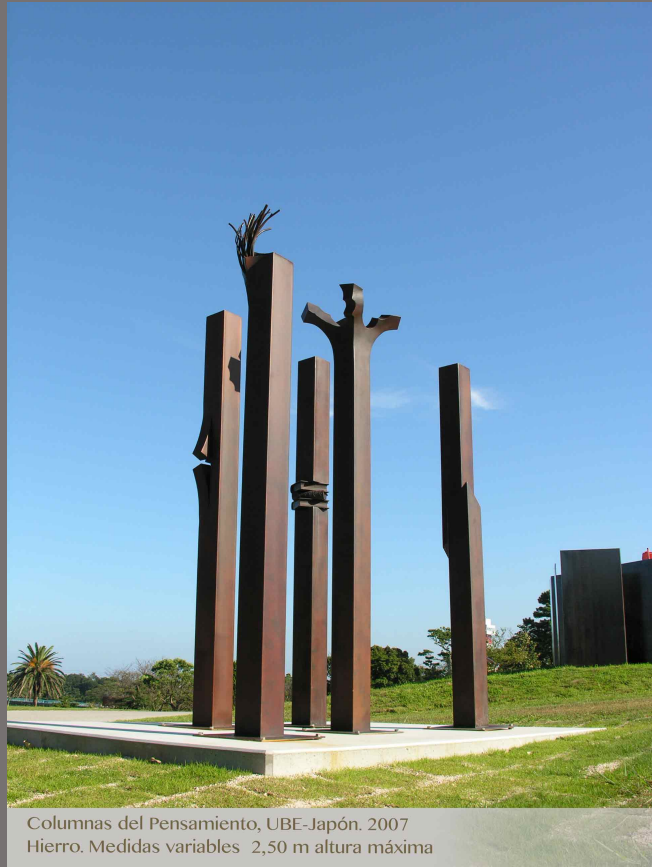
Columns del Pensamiento, UBE-Japón. 2007 Hierro. Medidas variables 2,50 m altura máxima