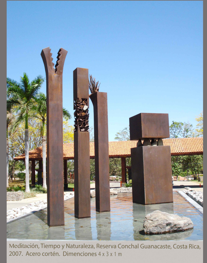
Meditación, Tiempo y Naturaleza, Reserva Conchal Guanacaste, Costa Rica, 2007. Acero cortén. Dimensiones 4 x 3 x 1 m