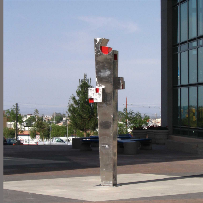
Fruto del desierto, Tecnológico de Monterrey-México. 2006 Acero inoxidable. 305x 70x 70 cm