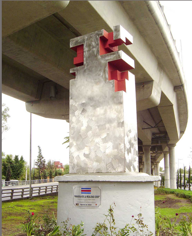
Paradoja de una realidad, Monterrey-México. 2000 Acero inoxidable y hierro. 305x 60x 20cm