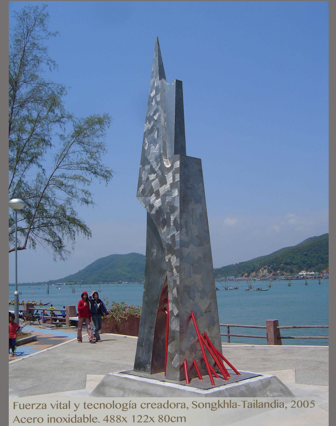
Fuerza vital y tecnología creadora, Songkhla-Tailandia, 2005 Acero inoxidable. 488x 122x 80cm