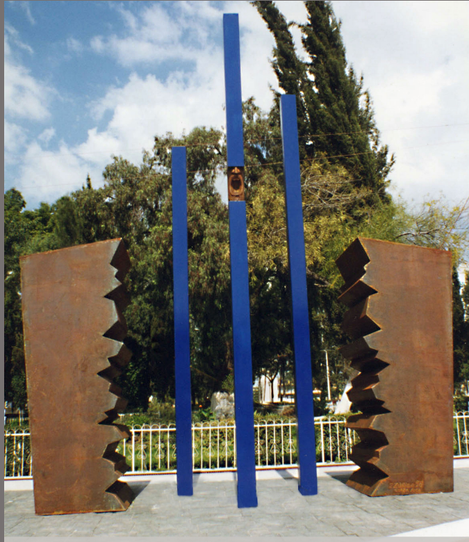
Monumento Homenaje a Morelos. Ecatepec - México, 1998 Hierro forjado, oxidado y esmaltado, Dimensiones 600 x 150 x 500 cm