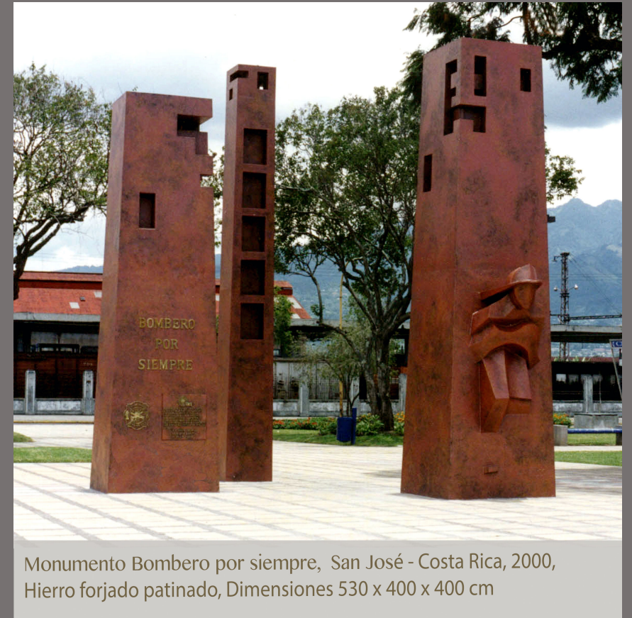
Monumento Bombero por siempre, San José - Costa Rica, 2000, Hierro forjado patinado, Dimensiones 530 x 400 x 400 cm