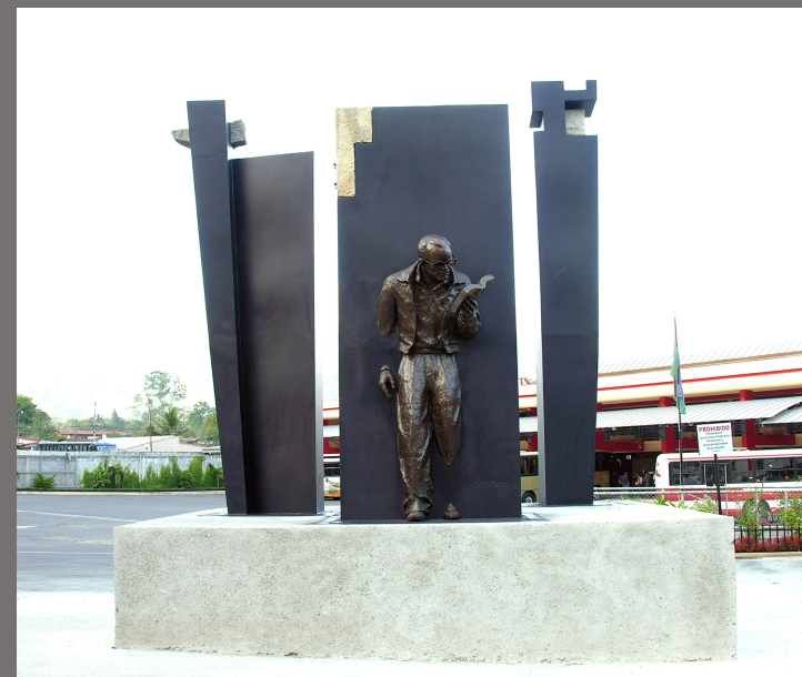
Monumento al Poeta Jorge de Bravo. Terminal de Buses Cartago - Costa Rica, 2005. Bronce hierro forjado y piedra, Dimensiones 400 x 350 x 300 cm