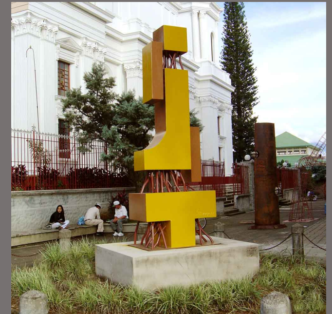
Constructivismo social 2004 Hierro Parque Central de Alajuela 4 mts x 1,4 mts x 1 mt