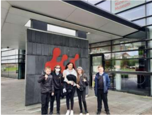
Aeth disgyblion y Ty i Amgueddfa'r Glannau yn ddiweddar.