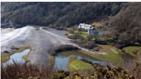
Bae Pwll Du

Dw i wedi sôn yn barod am Fae Pwll Du gan ganolbwyntio ar y chwarel calchfaen yno. Ond nid y chwarel oedd yr unig ddiwydiant ym Mhwll Du, achos roedd y lle yn berffaith ar gyfer smyglu! Mae rhai pobl wedi honni y cafodd mwy o nwyddau gwaharddedig eu glanio ym Mhwll Du nag unrhyw le arall ar arfordir Môr Hafren! Mae'r bae'n gysgodol ac yn ddiarffordd, a