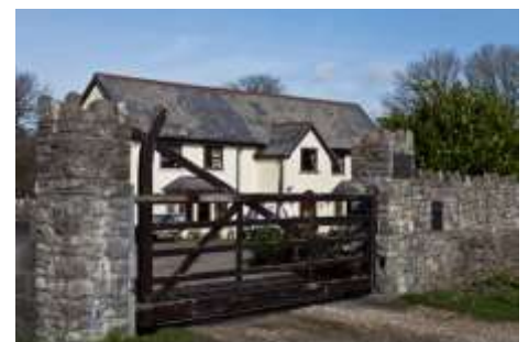
Fferm Great Highway