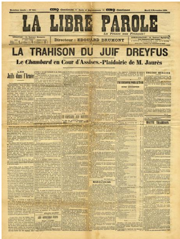
« La trahison du juif Dreyfus », La Libre parole, 06/11/1894

Principal propagateur de l'antisémitisme dans la France de la IIIe République et ardent antidreyfusard, Édouard Drumont fonde le quotidien antisémite La Libre Parole en 1892. Le 1er novembre 1894, son quotidien titre en première page sur l'arrestation d'un traître juif à l'état-major. Au lendemain de la première condamnation, La Libre Parole titre « Hors de France, les Juifs ! La France aux Français ! ».