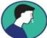
Écoulement nasal (sans lien avec les allergies saisonnières)