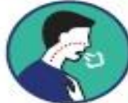
Essoufflement / difficulté à respirer