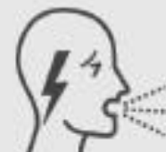
Difficulté à respirer