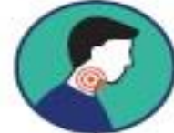
Mal de gorge / Difficulté à avaler