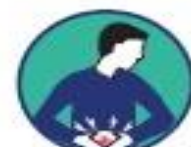
Nausée / vomissement / diarrhée / douleur abdominale