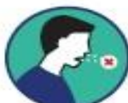
Perte du sens du goût ou de l'odorat