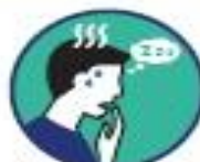
Malaise / mal de tête / fatigue Inexpliquée et douleurs musculaires