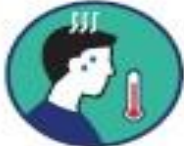
Fièvre / frissons

Présentez-vous l'un de ces nouveaux symptômes ou une aggravation de ceux-ci?