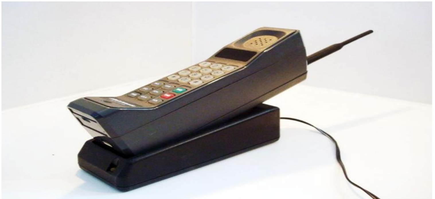
El primer teléfono móvil (celular)-Motorola Dyna TAC 8000X

El sistema celular fue creado para satisfacer la demanda de comunicación móvil dentro de un espectro de radiofrecuencia limitado.