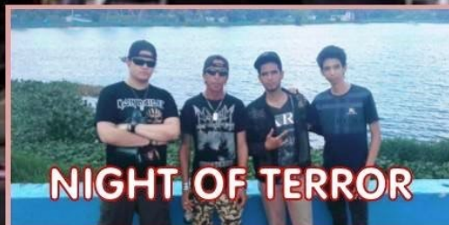
NIGHT OF TERROR