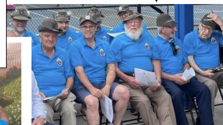
Coro Alpini Vaughan