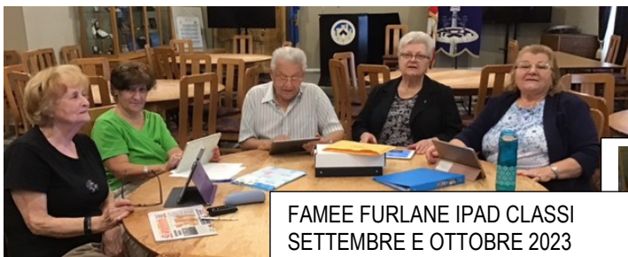
FAMEE FURLANE IPAD CLASSI SETTEMBRE E OTTOBRE 2023