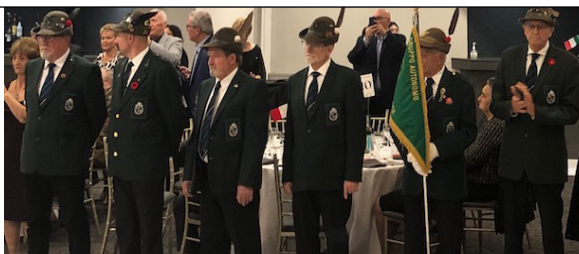
Bersaglieri Dinner Dance

SAVE THE DATE! FESTA DELLE PENNE NERE! GRUPPO AUTONOMO VAUGHAN DINNER DANCE - SATURDAY MARCH 2, 2024 ALLA BORGATA EVENT SPACE!