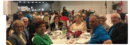
Famiglie Dussin e Taschin