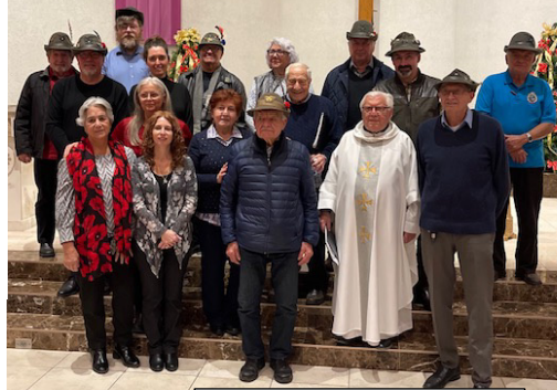
Foto Sotto: 30 luglio al Picnic e Festa di Gruppo Alpini North York 21 ottobre