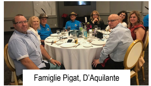
Famiglie Pigat, D'Aquilante