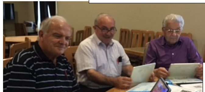
VILLA GIARDINO AM & PM IPAD CLASSI NOVEMBRE E DICEMBRE 2023