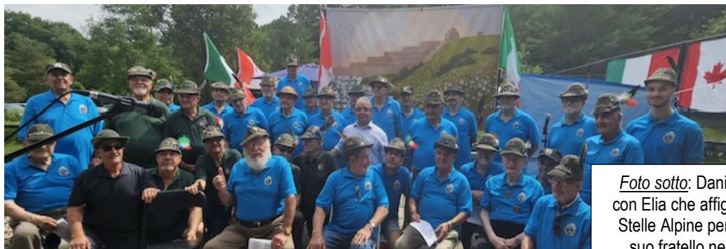
Il Gruppo Vaughan Con Il Gruppo North York - Amicizia e Frattellanza!