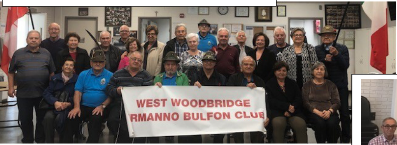
WEST WOODBRIDGE ERMANNO BULFON CLUB