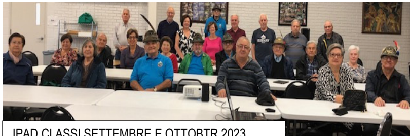
IPAD CLASSI SETTEMBRE E OTTOBRE 2023

Per noi alpini fare del volontariato a servizio della comunità è l'attività più onorevole e siamo fieri ed orgogliosi di poterlo esercitare anche all'estero. DC