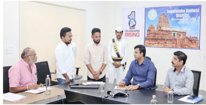
ర్యాండమైజేషన్ ద్వారా ఎంపిక చేయడం జరిగిందని తెలిపారు. ఒక్కో మండలానికి సంబంధించిన గ్రామపంచాయతీలలో సర్పంచ్, వార్డు సభ్యుల ఎన్నికల కోసం అవసరమైన పోలింగ్