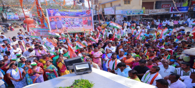
తెలపల్లి, డిసెంబర్ 08 (నిజాయితీ) :

అవసరాలకు అనుగుణంగా నూతన తహసీల్దార్ భవనం నిర్మించబోతున్నామని ఆయన జనాలను ఉద్దేశించి మాట్లాడటం జరిగింది. రాజీయే కాలంలో నాగర్ కర్నూల్ పట్టణానికి సమాంతరంగా తెలకపల్లి పట్టణాన్ని కూడా అభివృద్ధి చేయబోతున్నామని ఆ బాధ్యతను తాను తీసుకున్నానని ఆయన తెలియజేశారు. కాంగ్రెస్ ప్రజాప్రభుత్వం చేపడుతున్న