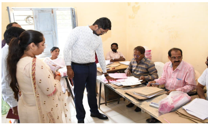
ఉండకూడదని, ప్రతి ఓటు ప్రజాస్వామ్య ప్రక్రియలో కీలకమని కలెక్టర్ సూచించారు. ఫారం 14 దరఖాస్తు చేసుకున్న వారందరూ ఓటు హక్కు వినియోగించుకోవాలని నిబంధించారు.