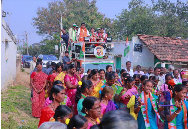
తెలపల్లి, డిసెంబర్ 08 (నిజాయితీ) :