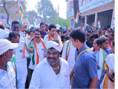
తెలపల్లి, డిసెంబర్ 08 (నిజాయితీ) :