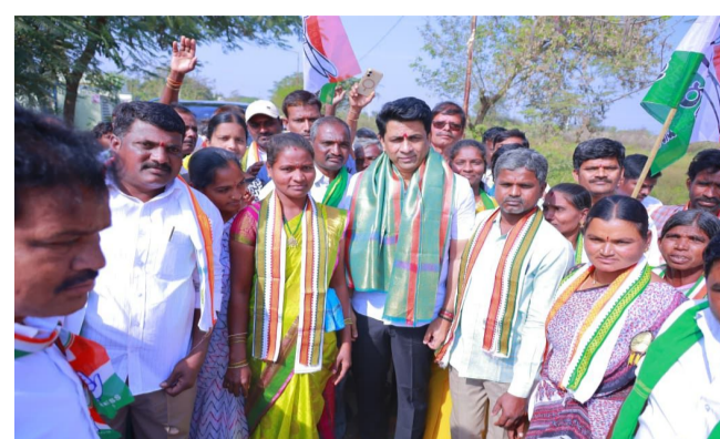
తెలపల్లి, డిసెంబర్ 08 (నిజాయితీ) :