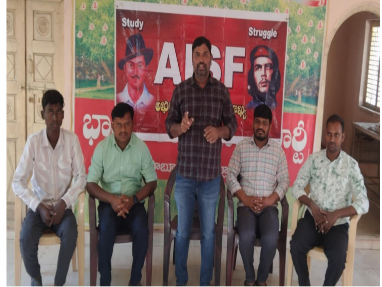
జడ్పీ డిసెంబర్ 08 (నిజాయితీ) :