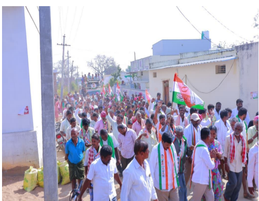
తెలపల్లి, డిసెంబర్ 08 (నిజాయితీ) :