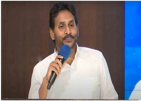
చేయడానికా మీరు అధికారంలోకి వచ్చిందా అంటూ