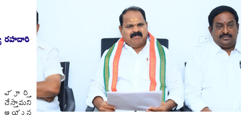
షాద్ నగర్, జనవరి 18 (నిజాయితీ) :

షాద్ నగర్ నియోజకవర్గంలోని మూడు మండలాలకు ముచ్చటగా అభివృద్ధి పనుల నిమిత్తం 10 కోట్ల రూపాయలు ఎమ్మెల్యే వీధిపల్లి శంకర్ మంజూరు చేశారు. ఆదివారం క్యాంపు కార్యాలయంలో ఏర్పాటు చేసిన మీడియా సమావేశంలో ఈ విషయాన్ని వెల్లడించారు. ఈ సందర్భంగా ఆయన మాట్లాడుతూ కొత్తూరు మండలంలో తిమ్మాపూర్ నుంచి నానాజీపూర్ మీదుగా గూడూరు వరకు బిటి రోడ్డు సు రూ. 5.75 కోట్లతో నిర్మాణం చేయనున్నట్లు వెల్లడించారు. అదేవిధంగా కేశంపేట మండలంలో గ్రామస్థులు ఎప్పటి నుంచి అడుగుతున్న వంతెన నిర్మాణాన్ని 2.25 కోట్లతో చేపడుతున్నట్లు వెల్లడించారు. ఇక కొండరుకు మండలంలో అగిర్యాల ఎస్సీ కాలనీ నుంచి కొల్లూరు వరకు రహదారి నిర్మాణానికి రెండు కోట్ల కేటాయించినట్లు వెల్లడించారు. ఎందుకు సంబంధించి టెండర్ల ప్రక్రియ కూడా పూర్తయిందని త్వరలోనే రహదారి నిర్మాణాలు