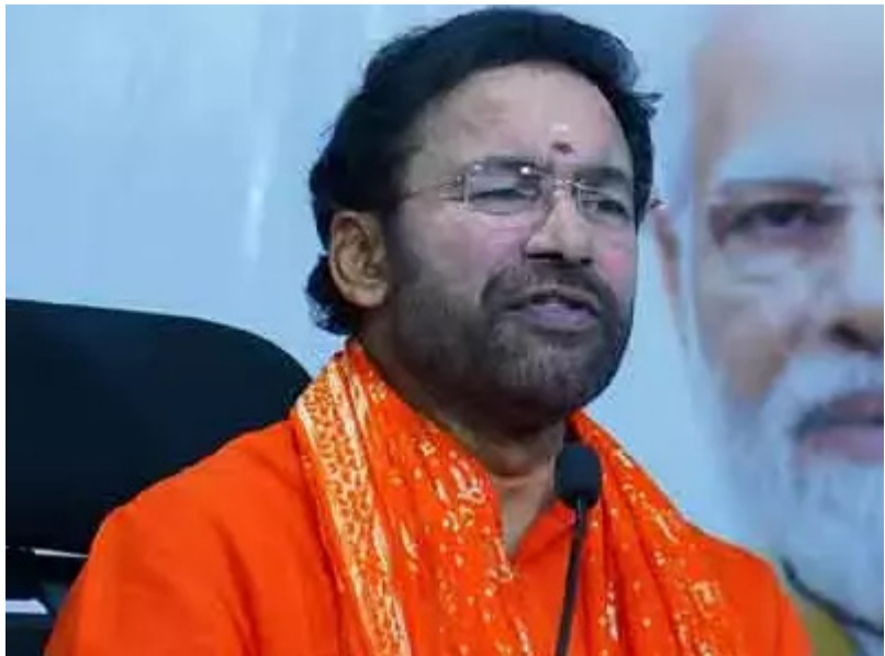
హైదరాబాద్, జనవరి 18 (నిజాయితీ) :

ఆరోగ్య భారత్ ప్రధాని మోడీ లక్ష్యం: కిషన్ రెడ్డి