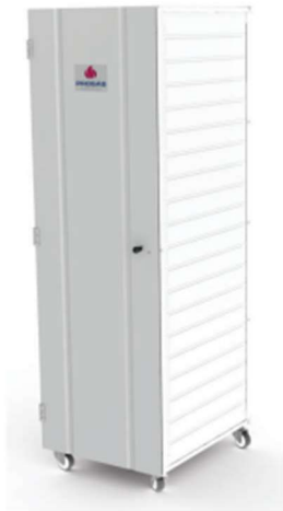
PCA-200 N Style