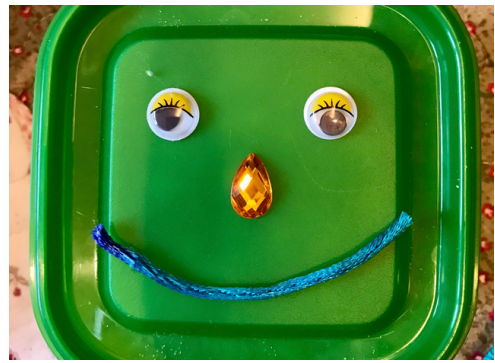
之後: 對父母之愛感到滿足和幸福