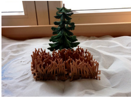
之前: 成長面臨許多障礙

通過治療，他能夠接受自己的局限性；學會尊重和遵守界限；認識和鍛鍊自己的自制力，並能夠與周圍的人互動和建立友誼。