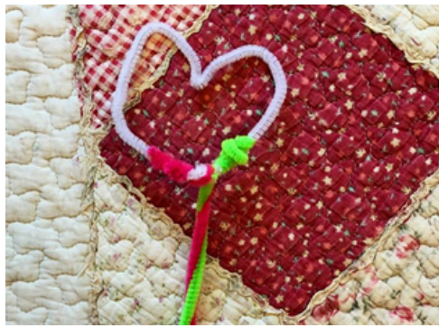
之前: 不安全感和對父母之愛的渴望

經過治療，她接受了自己獨特的身份，並明白父母對她的愛不會受到他們之間或與其他兄弟姐妹之間關係的影響。她與父母的關係變得更加親密，她能夠參與學校的學習。