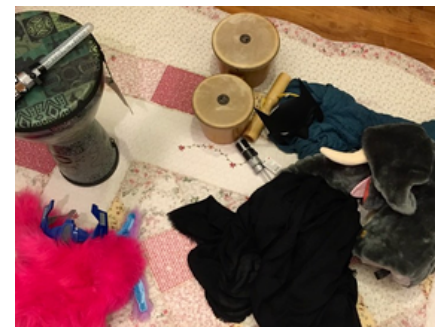
之後: 願意敞開心扉，喜歡玩更多公平的遊戲