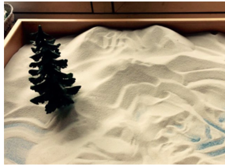
之後: 障礙被消除，孩子可以自由地成長