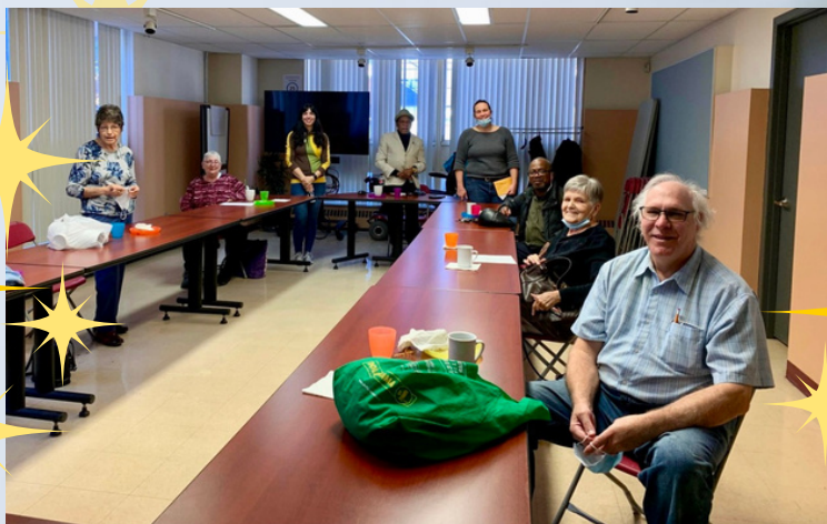
Photo du comité journal