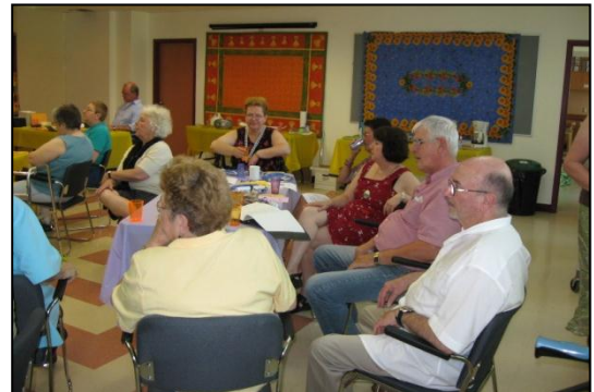
Chansonnettes d'ici d'ailleurs sur le thème de la Provence – Côte d'Azur