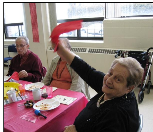
Chansonnettes d'ici et d'ailleurs sur le thème de l'Italie.