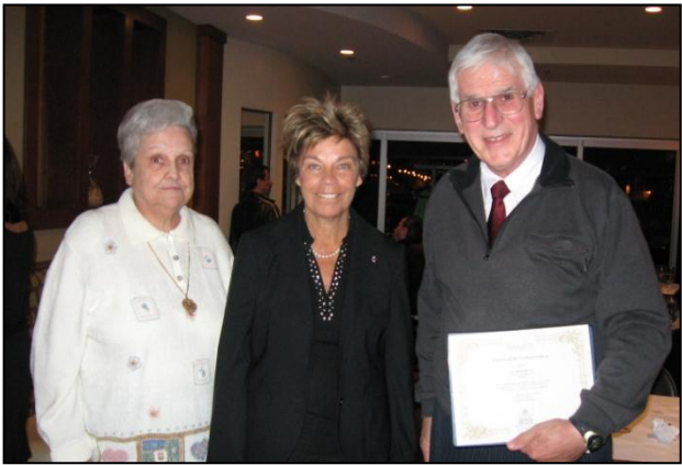
Hommage à M. Houle, bénévole de l'année.