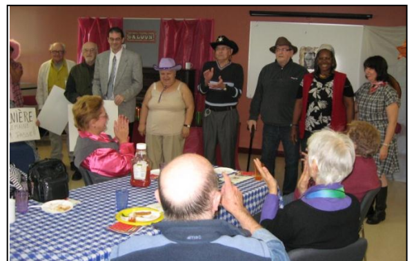
Chansonnettes et d'ici et d'ailleurs : St-Tite à Rosemont !