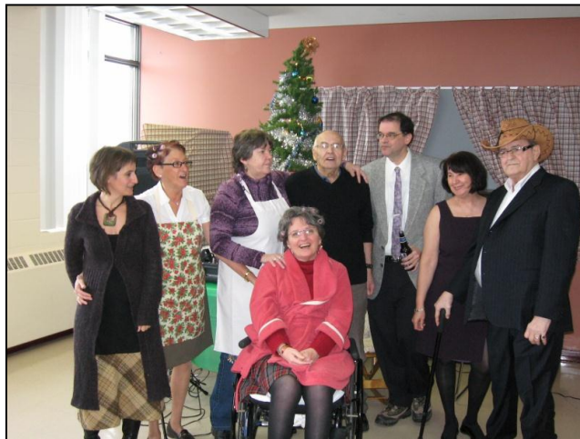
Le réveillon des Blanchette de Jocelyne Bergeron. Une prestation théâtrale réussie !