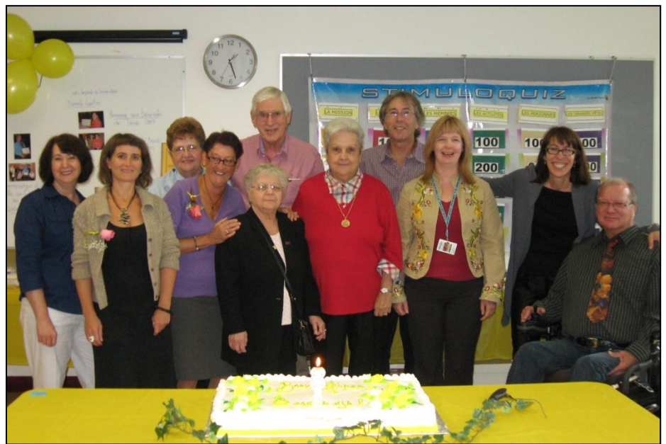
Portes ouvertes et 8 ième anniversaire de l'ALPAR