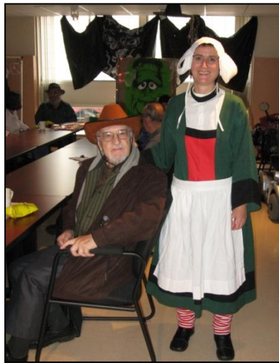
Quelques beaux costumes à notre fête de l'Halloween.