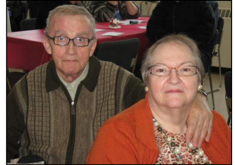
Notre grande fête de Noël en compagnie de l'ensemble vocal Cœur vaillant