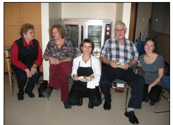
Une fête en l'honneur de nos bénévoles.