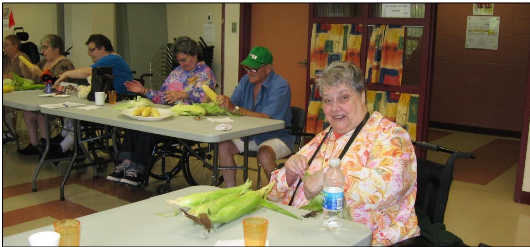
Une épluchette de maïs, au grand plaisir de tous.