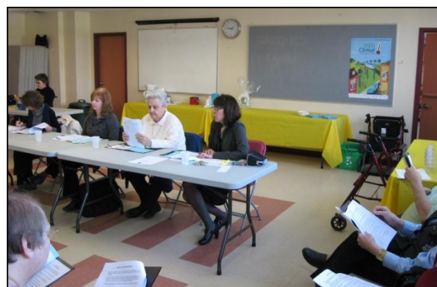
Un nombre record de participation à notre AGA de 2010.