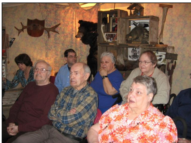
Une prestation théâtrale destinée aux membres de l'ALPAR présentée par Toxique Trottoir dans le cadre de la Semaine d'action contre le racisme .