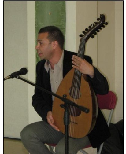
Musiques d'ici et d'ailleurs sur le thème du Maghreb.