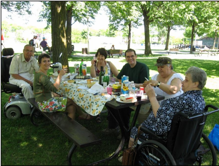
Un pique-nique fort agréable au parc Lafond