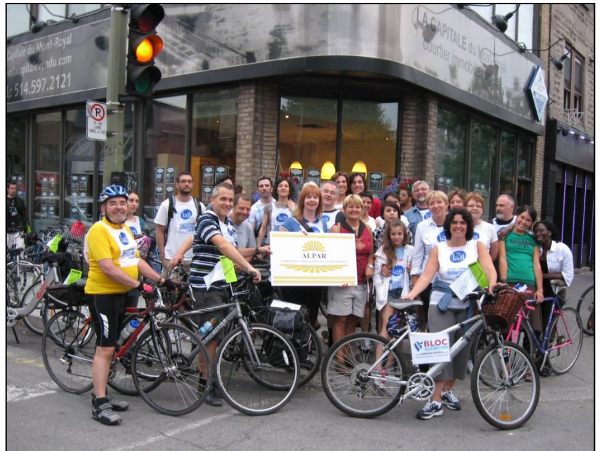
Les participants du 2 er cyclothon de l'ALPAR