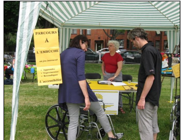
Kiosque de l'ALPAR à la Fête de la famille