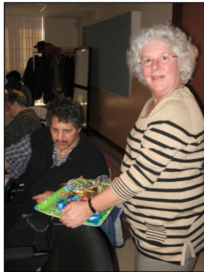
Des belles festivités pour Pâques.