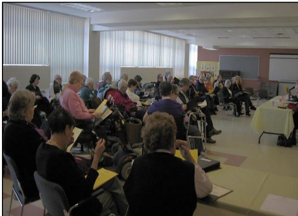
L'assemblée générale annuelle 2011.