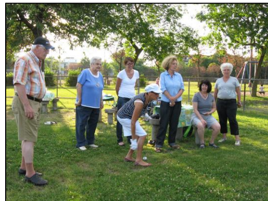
Un 5 à 7 estival pour remercier nos bénévoles.