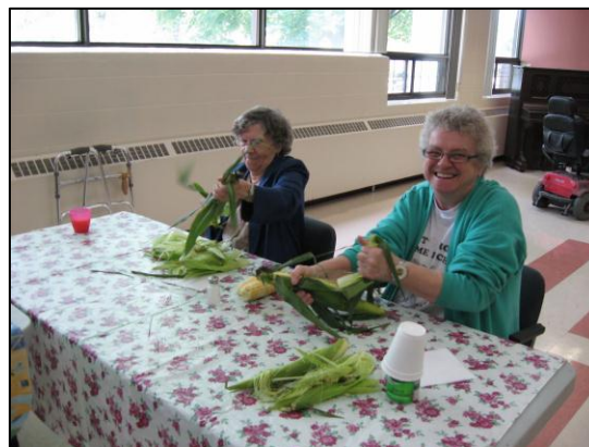
Notre épluchette annuelle.