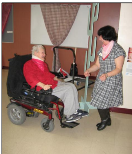
De la danse à la portée de tous.