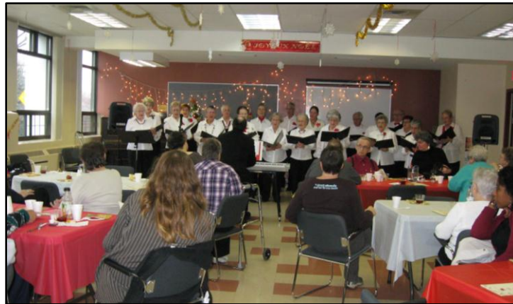
La prestation musicale de Cœur Vaillant.