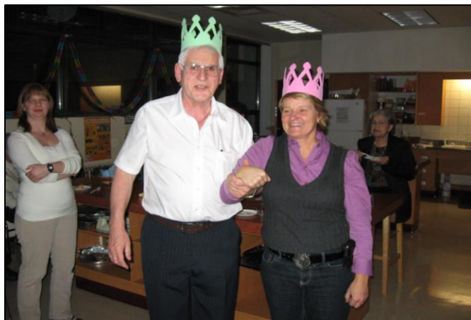
Célébration des Rois et des Reines pour nos bénévoles.