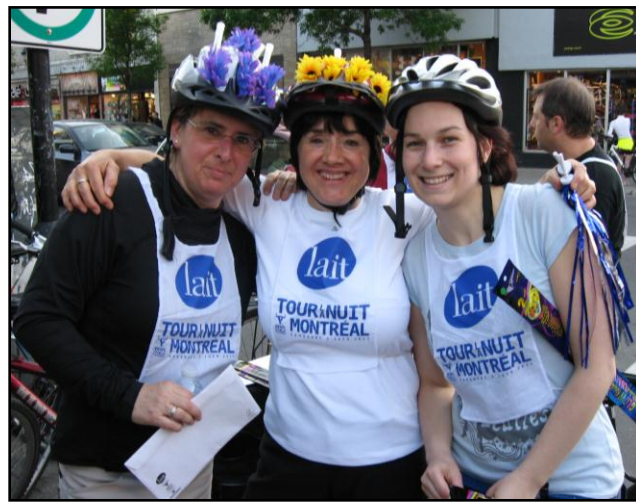
Le Cyclothon 2011 de l'Alpar.