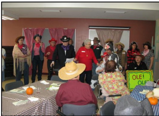
Une création théâtrale de l'Alpar