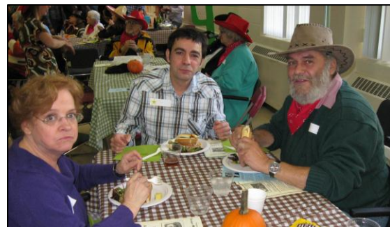
Quelques invités à notre grande fête La ruée vers le country .