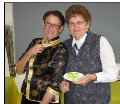
Une prestation de la chanteuse Thai Hien lors de notre fête portant sur le Vietnam.