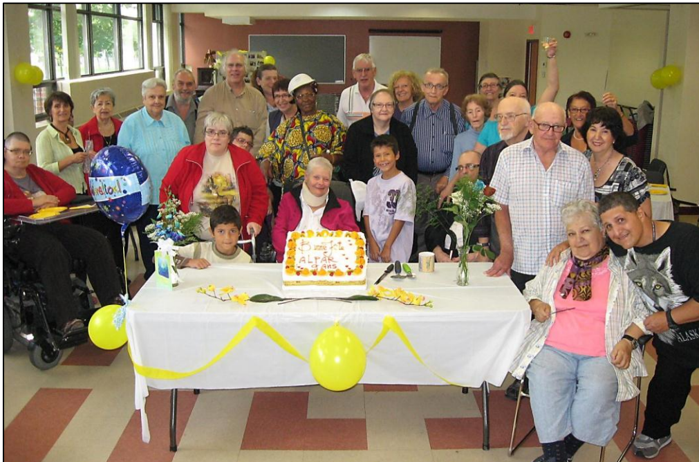
Nos festivités pour le 9 ième anniversaire de l'Alpar.