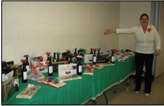
Une table abondante de cadeaux.