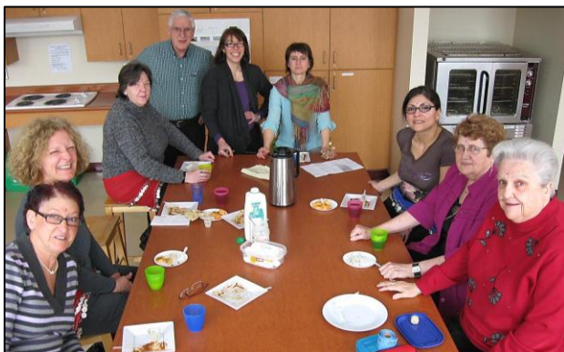
Réunion des bénévoles en vue de la fête de l'Inde.