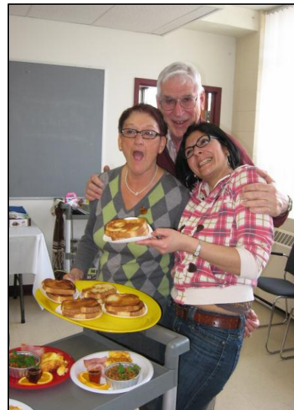
Un repas Cabane à sucre pour le plaisir de tous.