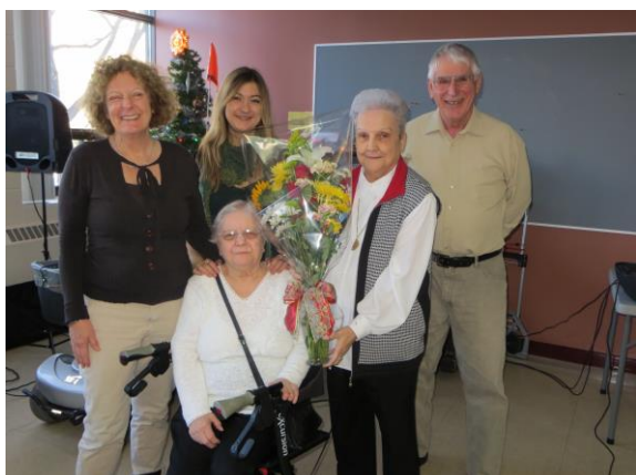
Un hommage émouvant à Mme Labelle pour toutes ses années d'implication.