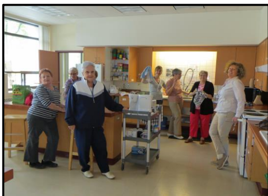
Nos bénévoles travaillent fort, même en coulisse!