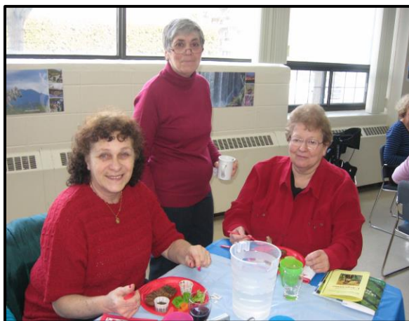
Le 13 février 2013, nous sommes partis à la découverte de l'Argentine !