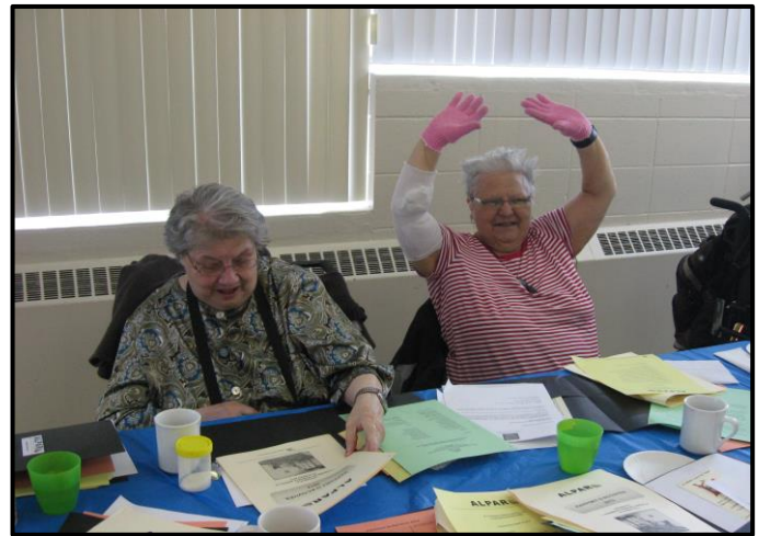
L'assemblée générale annuelle 2013 de l'Alpar.