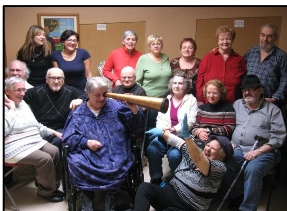
L'avenir à grand coup d'amour!