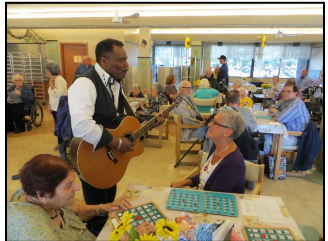
Une rencontre mémorable où nous sommes allés animer un Bingo au Centre d'hébergement de soins de longue durée Marie-Rollet.