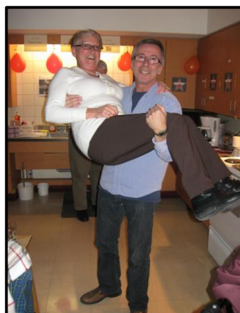
Pourquoi pas un brin de folie!