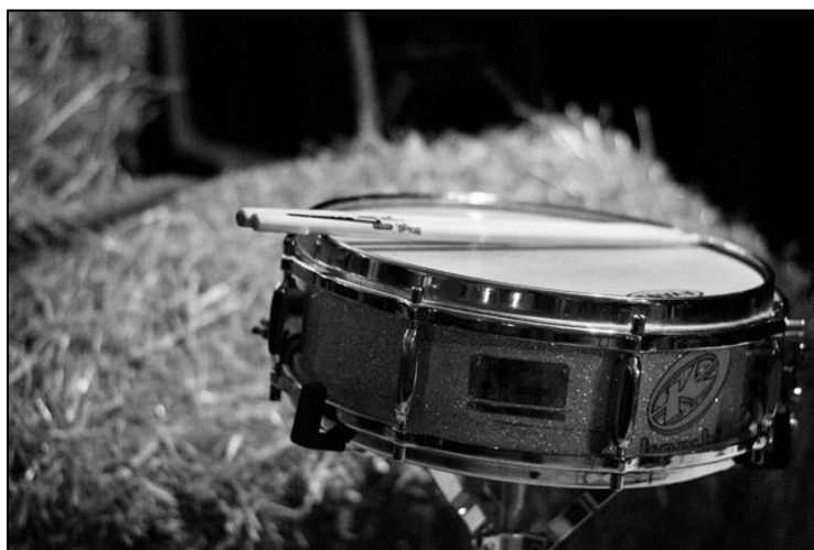
Souvenir de l' AlpaRodéo .

PRESENTÉ À L'ASSEMBLÉE GÉNÉRALE ANNUELLE LE 19 MARS 2014