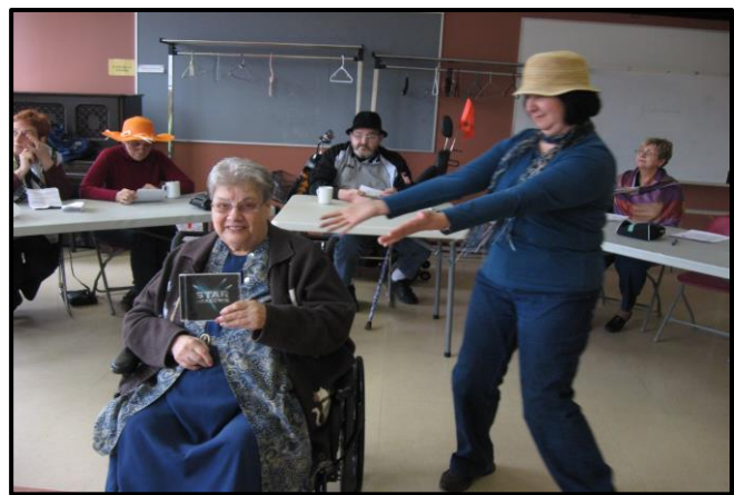
La pièce de théâtre Trouvez la réponse! entièrement réalisée par Jocelyne Bergeron, a su agrémenter et égayer notre après-midi cabane à sucre