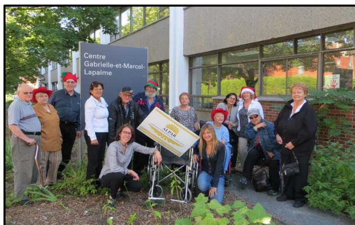
Une photo de groupe rayonnante.