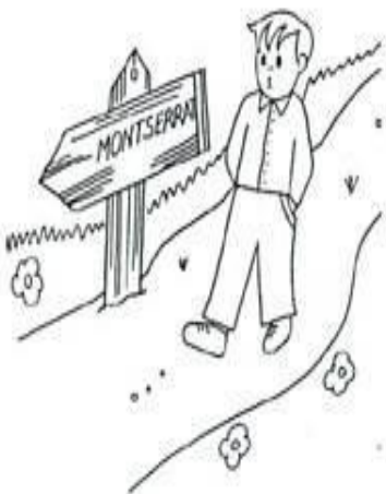
Enrique amaba a la Virgen María. El quería ser sacerdote.