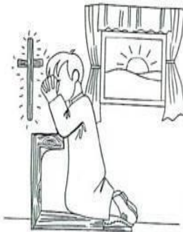
Enrique amaba mucho a Dios y hablaba mucho con Jesús.