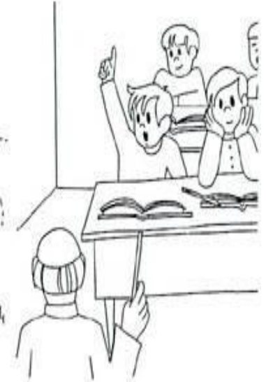
A Enrique le gustaba la escuela. El aprendió mucho.