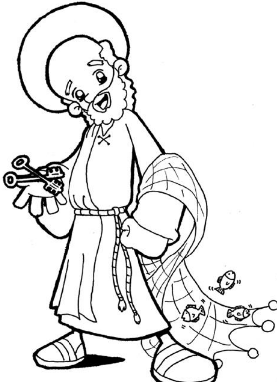
San Pedro, el Apóstol-ier Papa