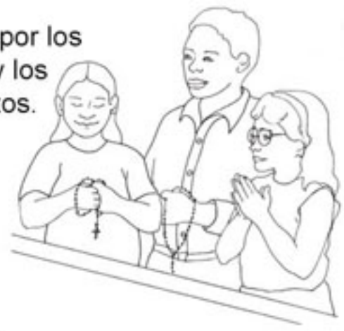
7. Rezar por los vivos y los muertos.