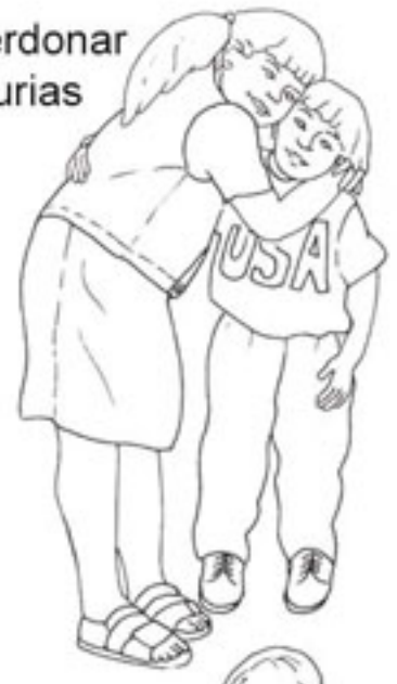
6. Perdonar injurias