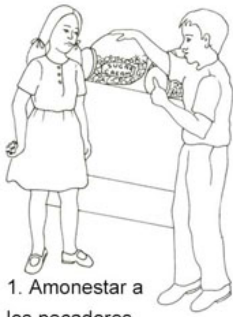
1. Amonestar a los pecadores.