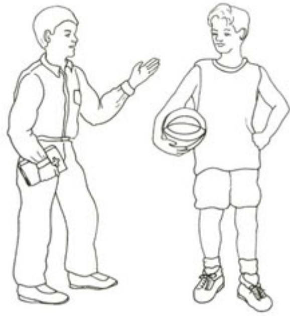
4. Consolar a los afligidos.