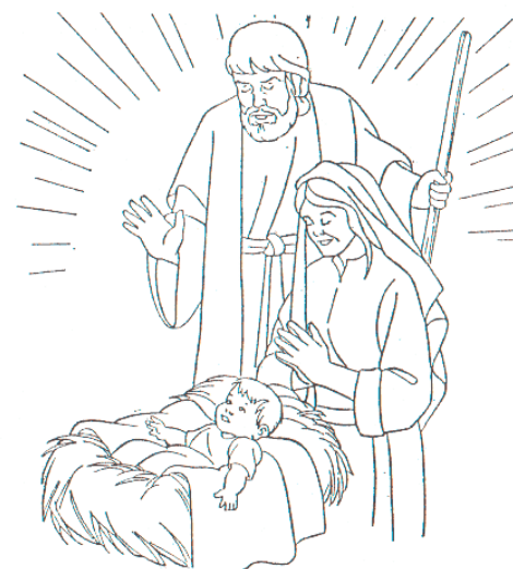
Maria y José cuidaban de Jesús mientras dormía ellos se alegraban daban las gracias a Dios por Jesús