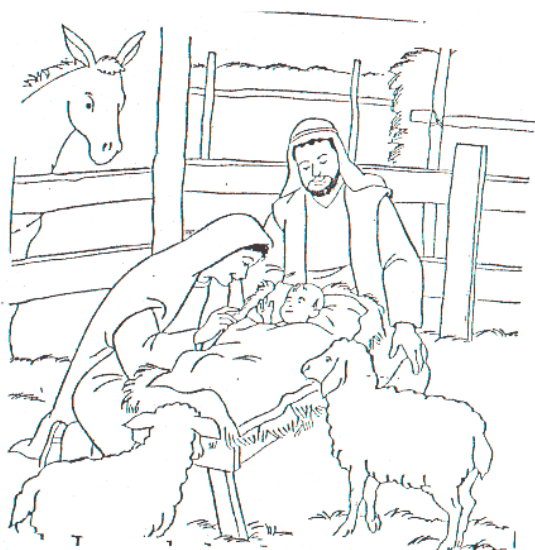
Esa noche Jesús nació lo envolvió en pañales