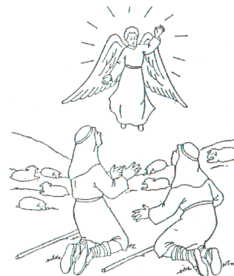
Un mensaje de Dios se les apareció y le dijo: "o tengan miedo yo les traigo buenas noticias hoy tu salvador